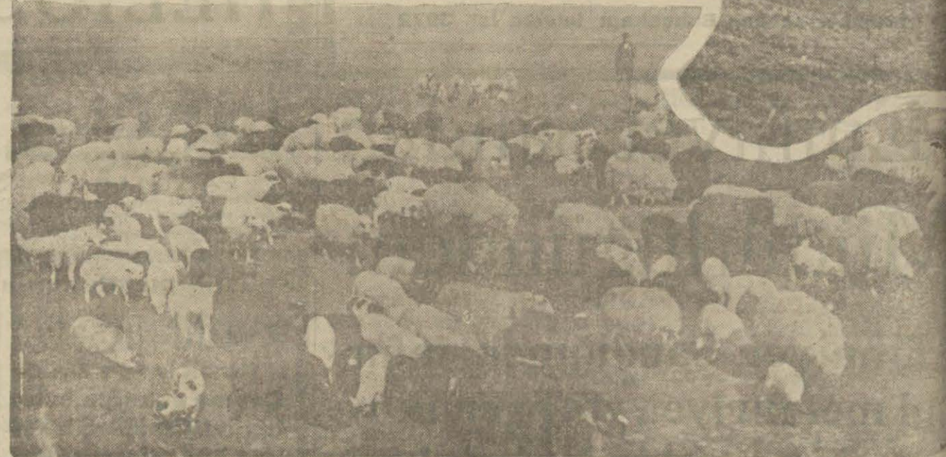
Son zamanlarda yağmakta olan yağmurlar Trakya'da büyük bir feyzül bereket husule getirmiştir. Resimlerde Çorlu'da ziraat hayatı görülmektedir.