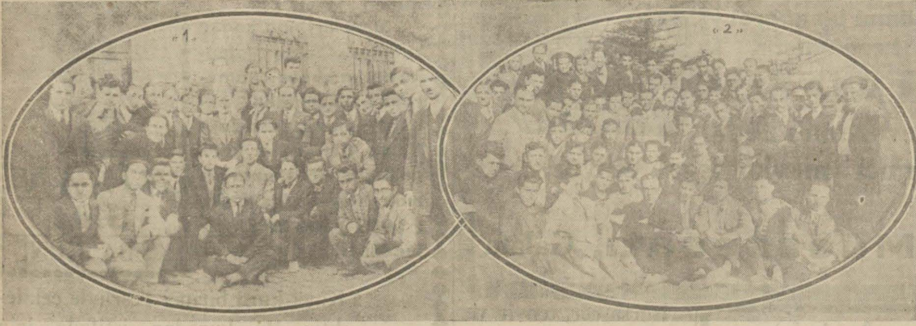
Resimlerimiz: İstanbul Lisesi son sınıf fen ve edebiyat şubesi (1) Tarih muallimleri ile. (2) Edebiyat muallimleri ile birlikte.