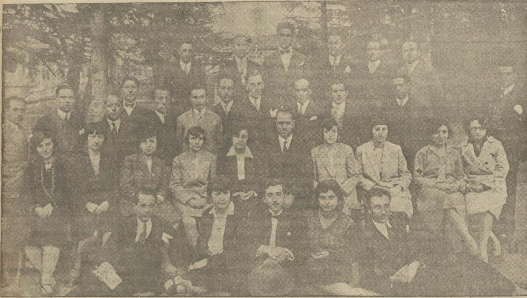
Bursada Muallimler Birliğinde verilen kırk kişilik konsere iştirak eden muallim Hanım ve Beylerden müteşekkil bir grup.