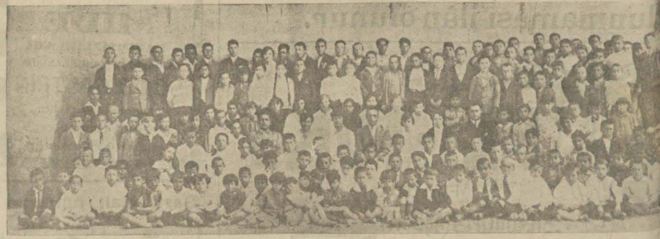
Tekirdağ Cumhuriyet mektebi talebeleri heyeti talimiyelerle birlikte