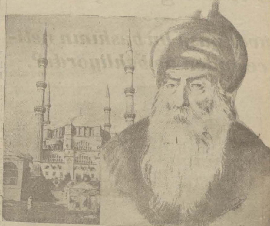
Koca Sinan ve Edirne'deki büyük eseri: Selimiye camii

47 inci hafta başlamıştır. Gazetemizde çıkan haberlerden en mühimmi seçip cumartesi akşamına kadar müsabaka memurluğuna gönderiniz.