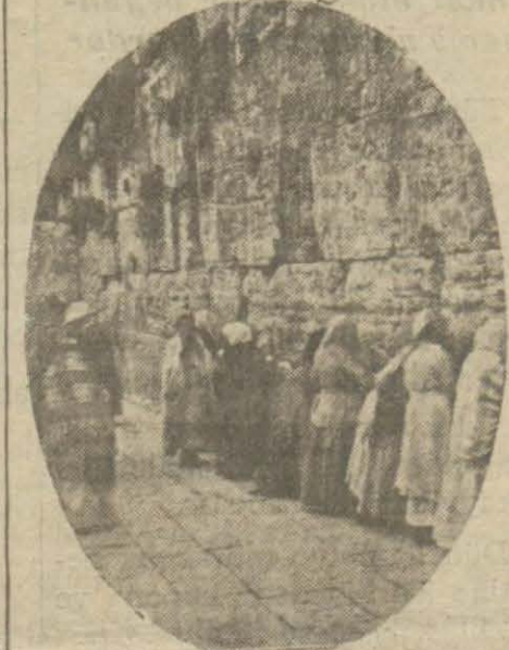
Filistin de dıvar dibinde ağlayan yahudi kadınları

Geçen ağustosta Araplarla Yahudiler arasında çıkan kanlı vekayi üzerine İngiltereden Filistine bir tahkikat heyeti gitti. Fakat aradan aylar geçtiği halde Filistin in müstakbel idaresine olacağı, yani hem Araplar, hem de Yahudileri tatmin edebilecek bir idare kurmak Yolunda ne yapılacağı gösterir ortada bir alâmet yoktur. Şimdiki halde Filistindeki idare takviye edilen bir zabıta idaresidir. Halbuki memleketin ekseriyetini teşkil eden unsur Arap unsurdur. Bunun karşısına dünyanın ötesinden berisinden getirilerek teşkil edilme istenen sun'î bir Yahudi ekseriyeti konmağa çalışılıyor. Bu ise iki unsur arasında gitigide artan husumeti azaltacak bir tedbir değildir. Kudüsten gelen aşağıdaki telgraf vaziyet hakkında bir fikir veriyor. Bir ay, kırk gün sonra kurban bay-