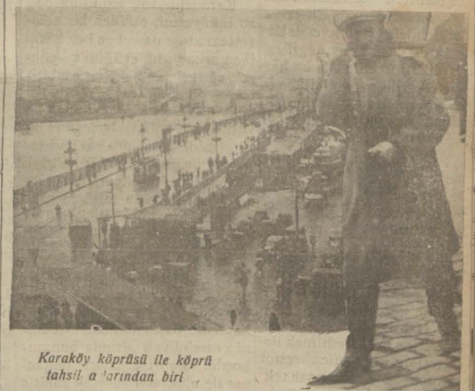
Karaköy köprüsü ile köprü tahsil a'arından biri

Türklüğe ebediyen yaşayacak abidat bırakan Sinan için bugün şehrimizde ve Edirne'de ihtifaller yapılacaktır. Edirne'de Selimiye camii bugün ihtifal yapılacak, bu günün büyük hatırasını tebcil edecektir. Çanakkale'de de Türk ocağında bugün merasim yapılarak koca Sinanın hatırası tebcil edilecektir.