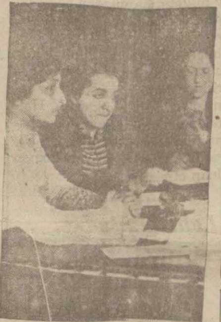
Kadın Birliğinde dünkü içtima

sına kaydedilmek üzere müracaat ettiklerini yazmıştı. Hanımlarımızın bu müracaatlarına, son vaziyet hakkında vilâyet şubesine resmen malûmat verilmemiş için henüz cevap verilmemiştir.