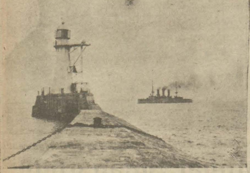
Tarhi bir resim: Hamidiye Odesa limanında.

Enver paşa bu baskının neticesinden ne bekliyordu?