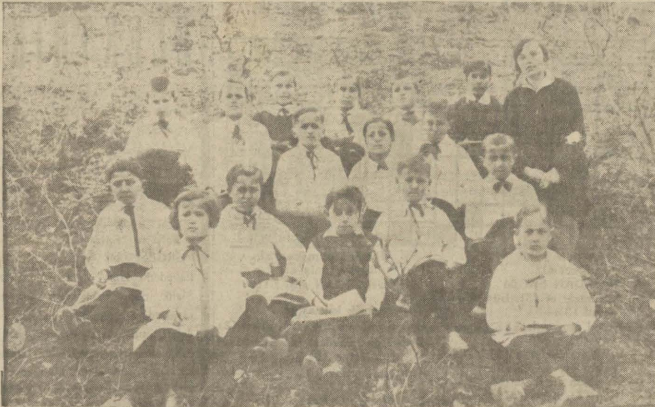
Devrek ik mektebin mini mini yavruları çiçeklerin resimlerini yaparken