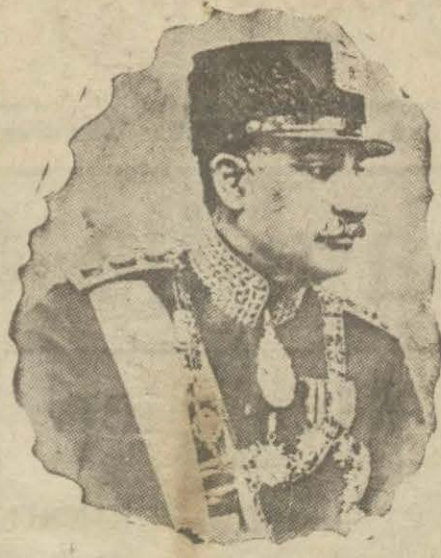
İranda yeni para

RİYO DE JANEYRO, 14. — M. Prestes'in reisicumhurluğa intihabı M. Vargas'ın kazaymış olduğu 659 bin 873 rey karşılığında 91 bin 927 rey ile temin edilmiştir.