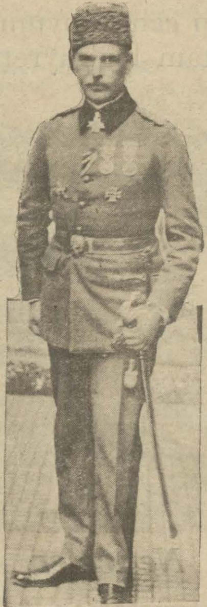
Liman von Sanders Bey

1 Ağustos Cumartesi günü ükêlâdan bir kısmı Babilâde adrazamın odasında oturların Enver Paşa gelip seferberlik için bir mazbata yapılmış istemiş. Harp ihtimali kuvvetli olmakla beraber henüz taakkük etmemiş bulunduğu bazı Nazırlar şimdiki böy bir tedbir Rusyaya karşı nümayiş olur mütalesile Pazartesi günü aktolunacak Vükêlâ eclesinde icap ederse böyle bir karar ittihaiz olunabileceğini söylemişler; fakat Enver Paşa idiginden şaşmamıştır! Erteğün erkenden İstanbul sokaklarına seferberlik beyannameleri yapıştırmış, ondan sonra seferberliğe dair bir Meclisi ükêlâ mazbatasını Nazırlara elden doluşturarak imza ettirilmiştir. Bu isticalin ve usulsüzğün sebebi sorulduğu vakit alât Bey: