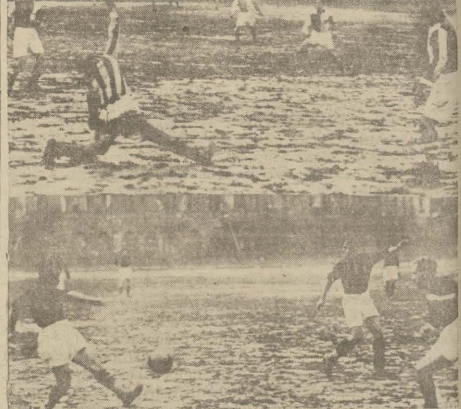
Dñn sabah sitadyumunda yapılan Milliyat kupası maçına ait iki intiba

Şık ve sağlam elbiselerin en muntahap çeşitlerini ERKEK, KADIN VE ÇOCUKLARA MAHSUS Friçkot - Pardesü - kostüm Palto ve muşambaların zarif çeşitlerini bulunduran Galatada Karaköyde poaçacı fırını ittisalindeki büyük mahallebicinein üstünde