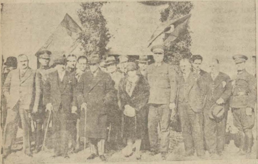
Şahi Hazretleri Antalyada İken Mursi çiftliğini teşrif buyurmuşlardır. Resmimiz bu ziyarete ait bir intibadır.