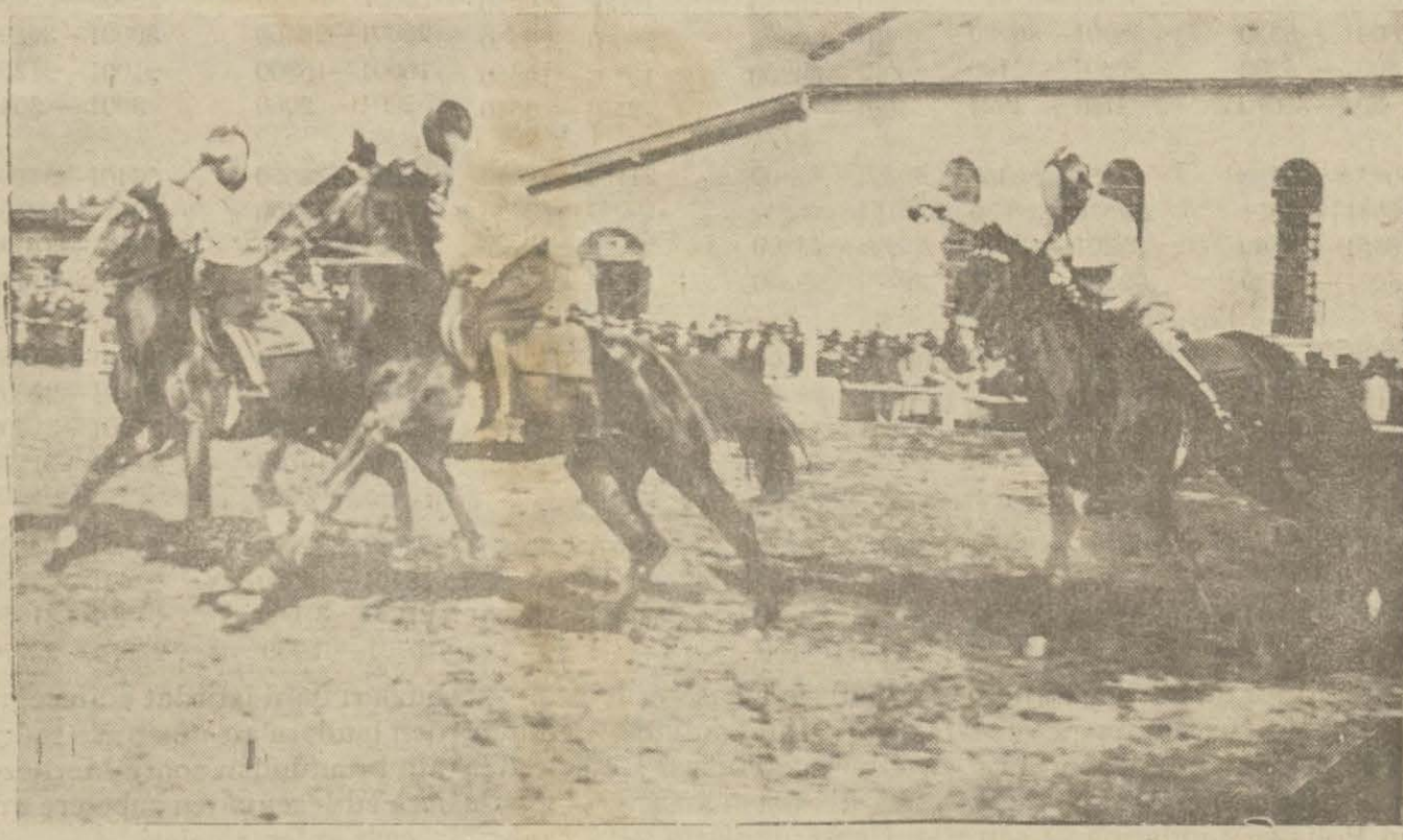
Sipahi ocağı tarafından tertip edilen binicilik müsabakaları, dñn Mektebi Harbiye tahimhane meydanında çok kalabalık bir halk huzurıyla ve büyük bir muvaffakiyetle yapılmıştır