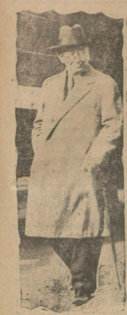
Sihhiye vekili Refik Bey