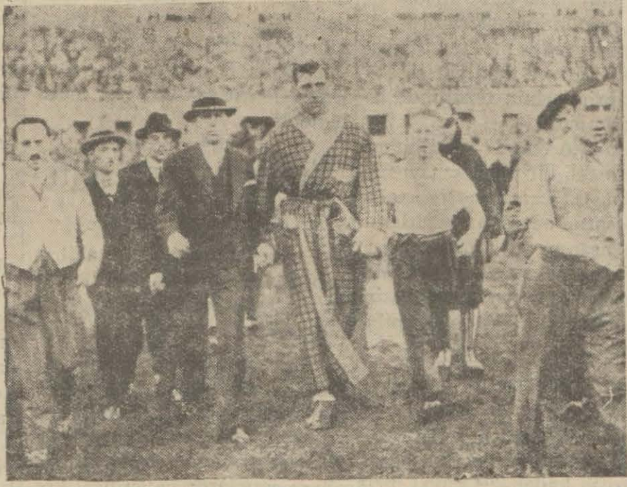
Karnera ringe giderken

Haftanın çok şayanı dikkat vak'ası hakkında güzel malûmat