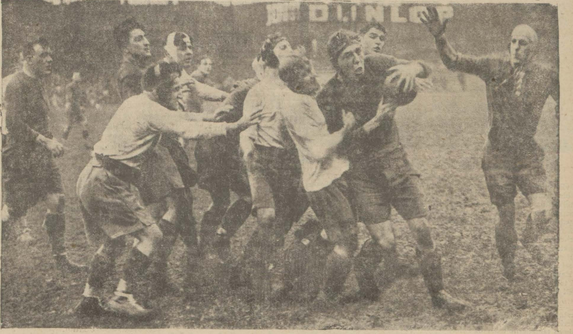
Bir Ragbi maçı

Karilerime Cumartesi nüshanmazda, İleri spor ve Karagürük takımları arasında icra edilen bir maça ait ufak bir havadis vermiştik.