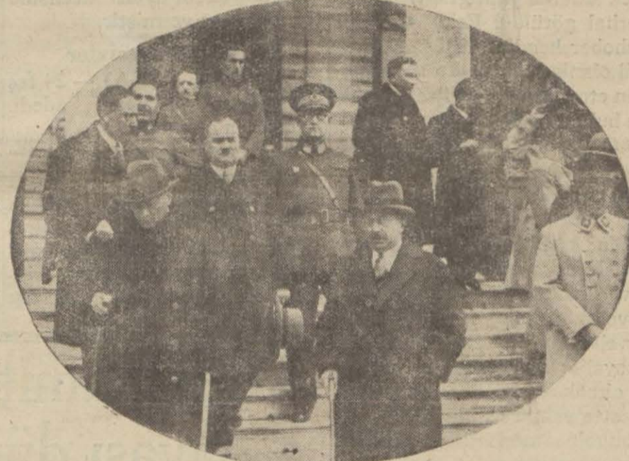
Gazi Hz. dün Dolmabahçeden çıkarırken.

Nezleden rahatsız ve dışlerini tedavi ettirmektedirler Reisicümhur Gazi Hz. bir kaç gün istirahat edecekler ve ziyarete bulunmayacaklardır. Gazi Hz. dün saat on dört buçuğa doğru, refakatlarında bulunan zevatla birlikte Dolma bahçe sarayından hareket etmişler ve Elhamra sinemasını teşrif etmişlerdir.