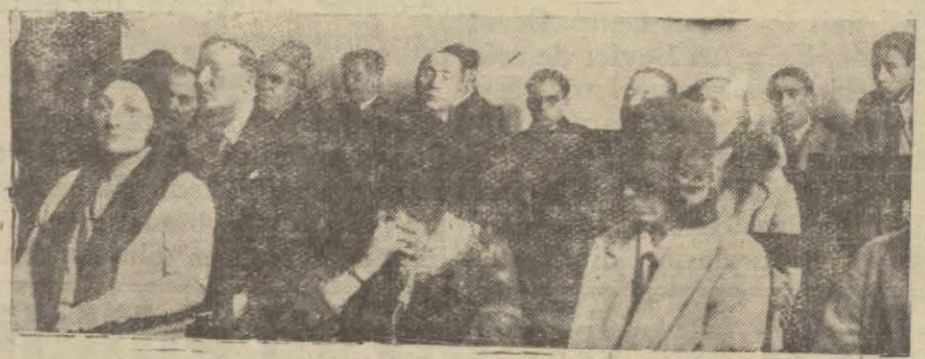
Abdülhamit veresesinin davasını gören Türk-İtalyan mahkemesi

Dava bitti. Mahkeme kararını bu hafta zarfında tefhim edecek