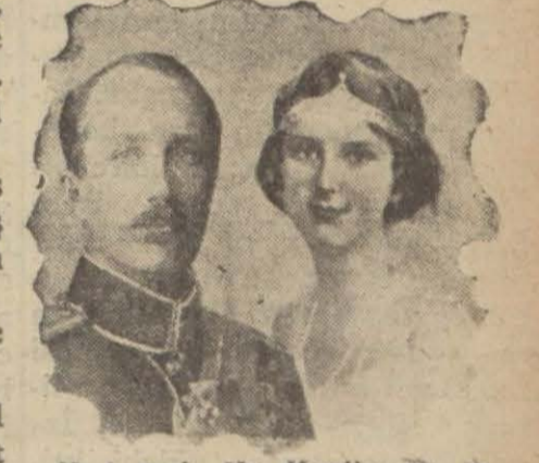
Kral Boris Hz. Kraliçe ile birlikte

SOFYA, 2 (AA) — M. Burol, bugün Tevfik Rüşti Beyin şerefine bir öğle ziyafeti vermiştir. Bu ziyafette başvekil ve sair hükümet erkanı hazır bulunmuşlardır. Öğleden sonra kral Boris Tevfik Rüşti Beyi kabul etmiştir. Tevfik Rüşti Bey, akşam üzeri Türkiye sefaretinde Bulgar gazetecileriyle hasbihalde bulunmuştur.