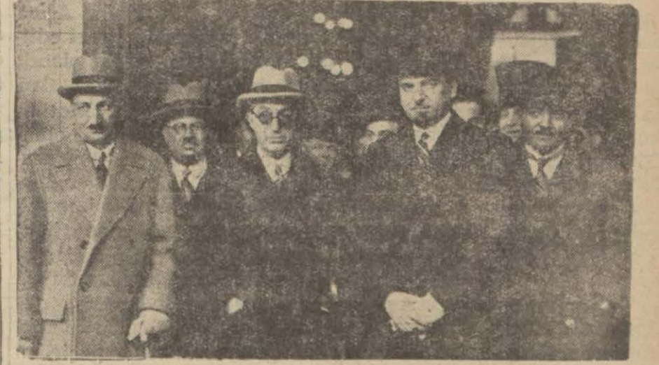
Tevfik Rüşti Bey Romada İtalya Hariciye nazırı M. Grandi ile birlikte

— Yeni bir harbin imkânsız olduğunu kat'iyen zannediyorum. Fakat, harp olursa muhakak ki buna arazi üzerinde emeller besleyen memleketler sebebîyet verecektir. Halbuki, ne Türkiye ne de Yunanistan hiçbir vehîle arazilerini tevsi etmek emelinde değildirler."