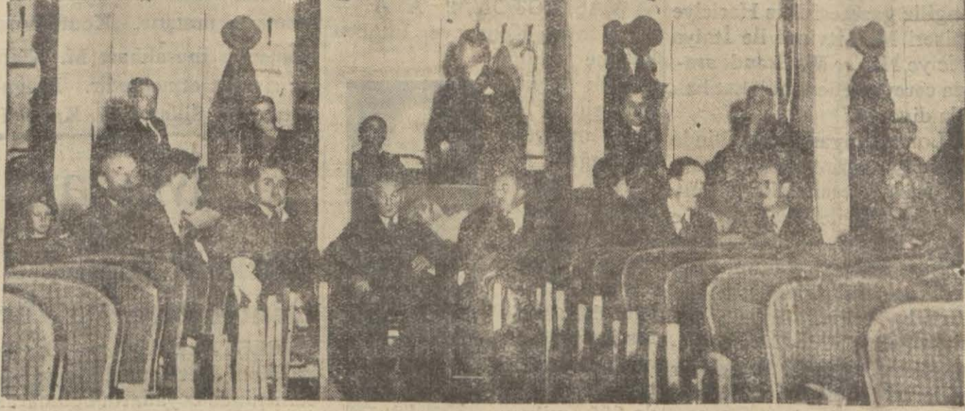
Reisicümhur Hz. Elhamra sinemasında. Ankarada irad etmiş oldukları belîğ hitabeyi filmde dinlerlerken.

Gazi Hz. tetkik ziyaretlerini bir kaç gün için tehir buyurdular..