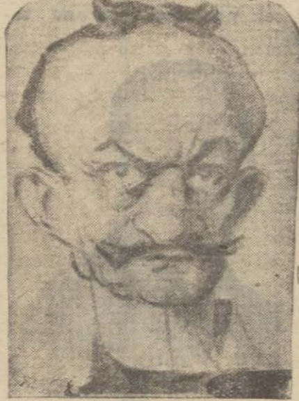
Alman murahhası Kont Bernstorff

Maamafih bu müzakerat daha ziyade fennî olduğu için bütün teferruat ile meseleyi kavramak daha ziyade ihtisasıdır. Bununla beraber elde edilmiş olan neticelerin herkeşce anlaşılması kabil olmadığımızı söylemek istemiyoruz. Bilâkis müzakere-