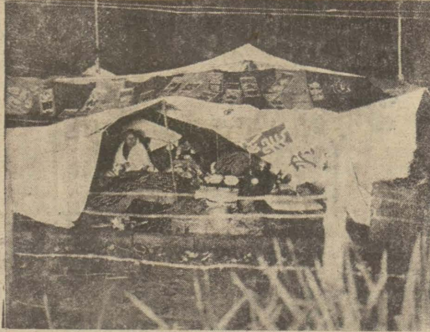
Japonyada sık sık hareket oluyor. Geçenlerde vuku bulan hareket pek çok fahriyat yapmış. Bu resim hareketten yıkılan yerler hakkında bir fikir verebilir. Hareketten açıkta kalanların vaziyetinde görülmektedir.