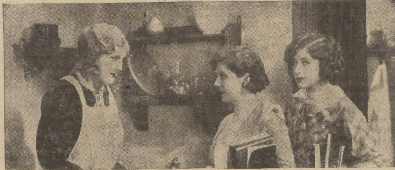
"Ren kızları", filminden

Madridli bir genci babası yaramazlığından dolayı (Santiyago) daki darülfünuna gönderiyor ve orada tanıdığı bir aileye