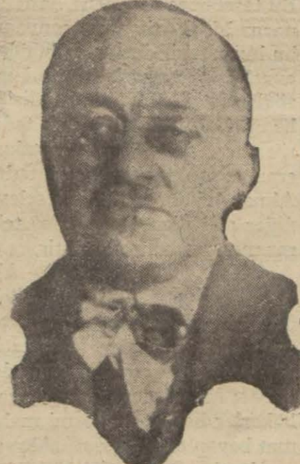
İbrahim Tali Bey

İbrahim Tali Beyin isminden bahsediliyor