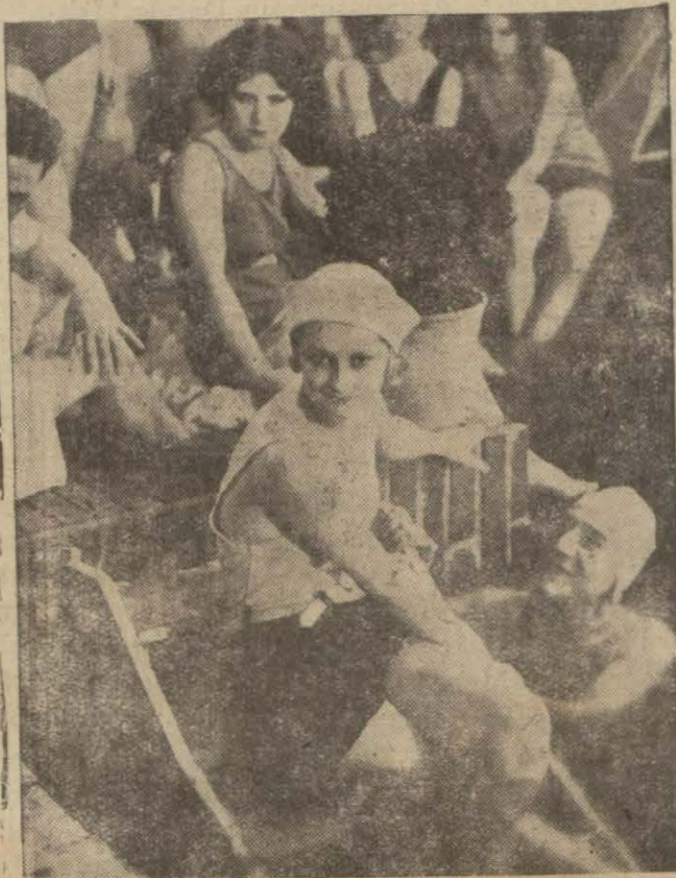
"Bedavacların şaht", filminden