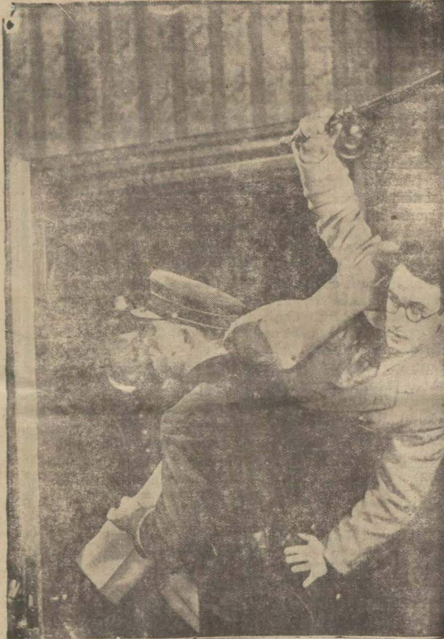
"Belâlar mübareki", filminden

Sesleri filme uymadığı anlaşılan Kolleen Moor, Rod la Rocgne, Vilma Banky, Alice White sinemayı terk edip tiyatroyo artistliğine başlayacaklardır.