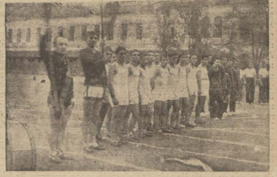
Hacıoğlu ve Kuleli atletizm takımları bir orada

Nezihi Bey müderrisleri bu meselenin gazetelere aksettirmesinden ve dedikodu halini almamasından dolayı (Devamı 4 üncü sahnede)