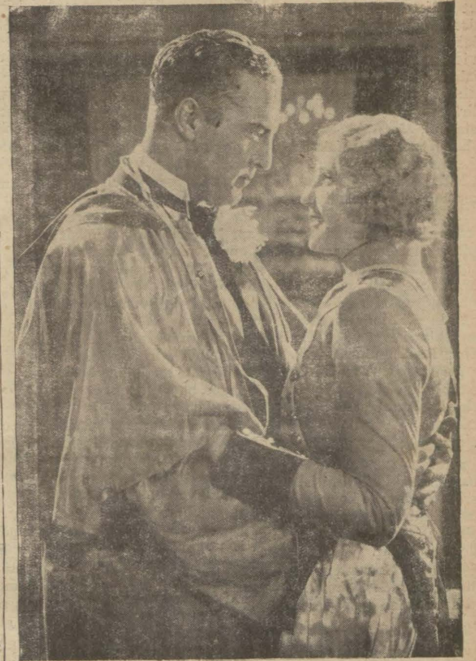
"Ren kızları", filminden