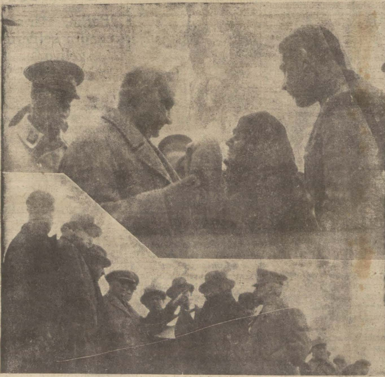
Trakya seyahatlerinden dün gece avdet eden Gazi Hz. halk arasında halkın dertlerini dinlerken

Ankara, 25 [ Telefonla ]— Dolmabahçe mülâkatına ehemmiyeti mahsusa atfolunmaktadır. İsmet paşa, bu ikinci seyahatinde Reisi-cümhur Hazretlerinin bazı meseleler hakkındaki fikir ve mütaleasını alacaktır. Düyunu umumiye meselesi bu mülâkatın başlıca mevzularından birini teşkil etmektedir. İstanbulda üç büyük Elçinin iştirakile bir de içtima akdi muhtemeldir. İsmet Paşa İstanbulda üç dört gün kalacaktır.