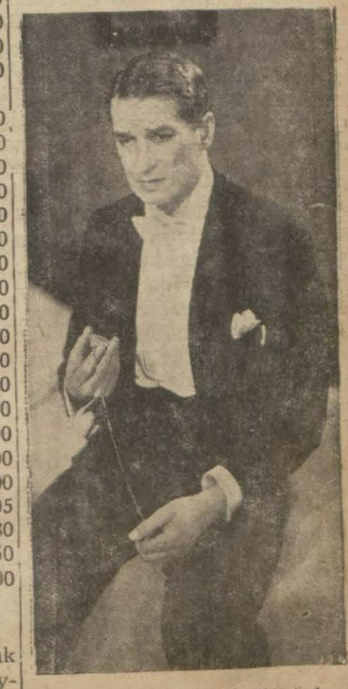
"Paramunt şeref geçidi", filminden

(Garp cephesinde tebeddül yoktur) ismindeki meşhur romandan çekilen bu isimdeki film Pariste gösterilmektedir. Bu filmi Almanlar sosyalnasyo nalistlerin nümayişleri üzerine menetmeğe mecbur olmuştur. Bu film İstokholmda de büyük rağbet görmüştür. İstanbulda bu film bazı noktalarla sansürün ilistiği söyleniyor. Dünyanın her tarafında rağbet gören bu film yalnız Almanyanın (Hitler) partisinin teşebbüsile menedilmiştir. Yakında bizde de gösterileceği ümit ediliyor.