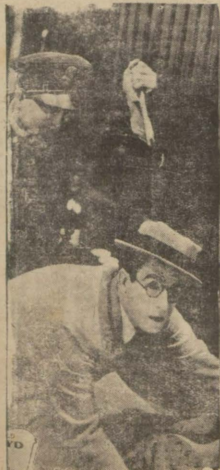
"Belâlar mübareki", filminden