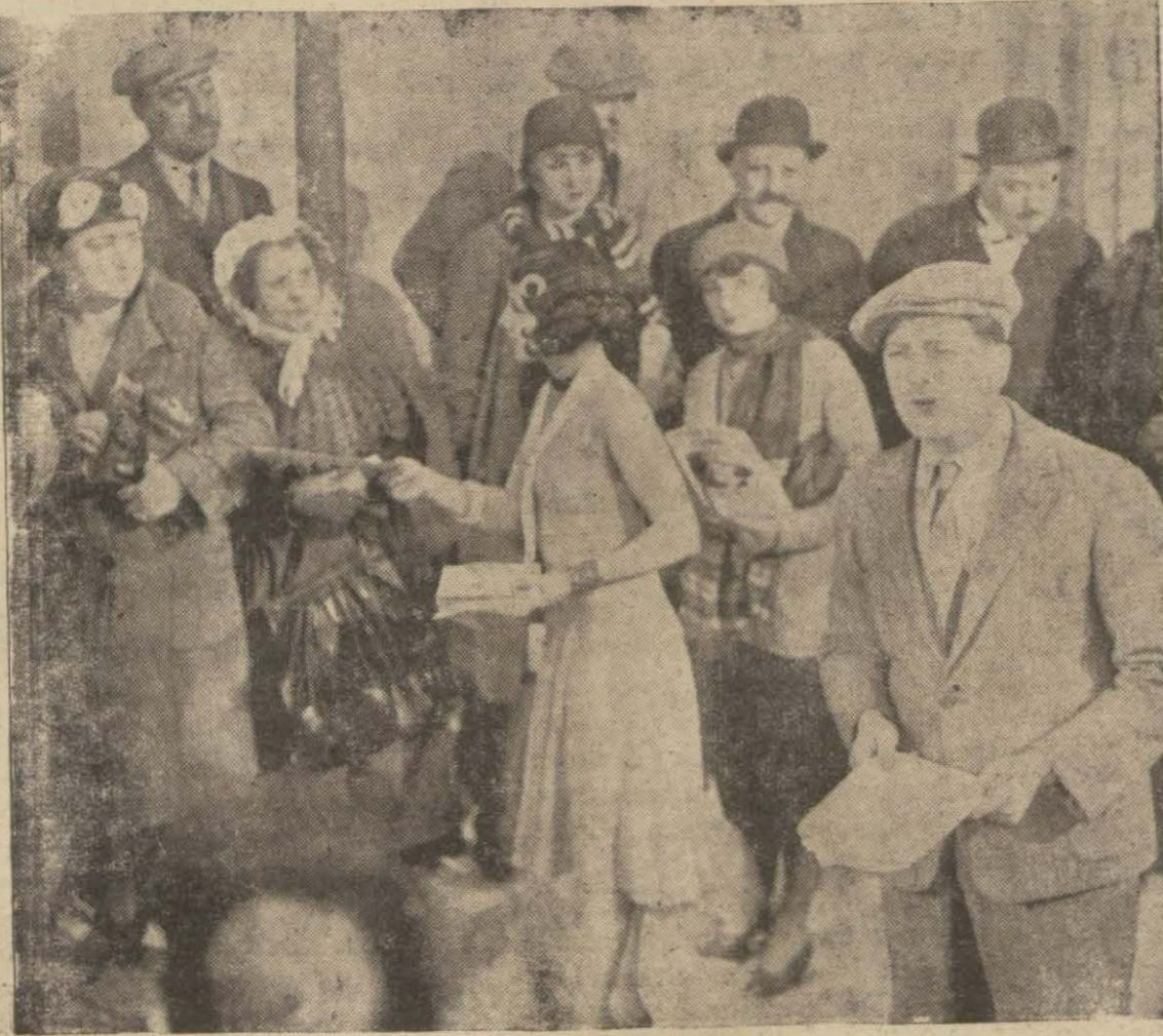
"Paris da arı altında", filminden

San Fransisko şehrinde bir akyonhane var. Polis bu müsbet müesseseyi idare eden ve onun yerini bulamıyor. Polis âmirlerinden birisi müteveffa ve meşhur polis hafiyesinin oğlu olan Harold Loyd'i bu iş için davet