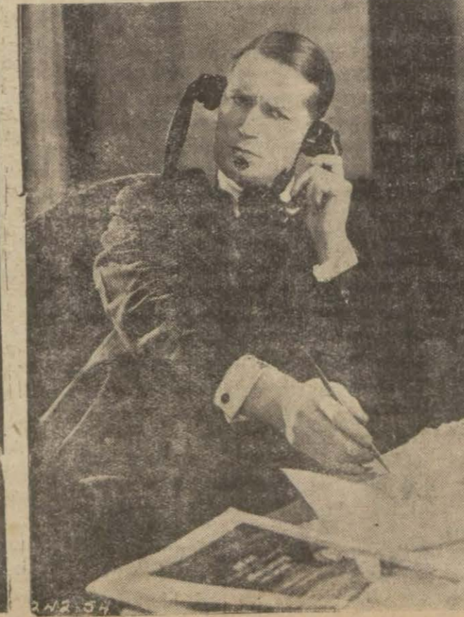
"Paramunt şeref geçidi", filminden