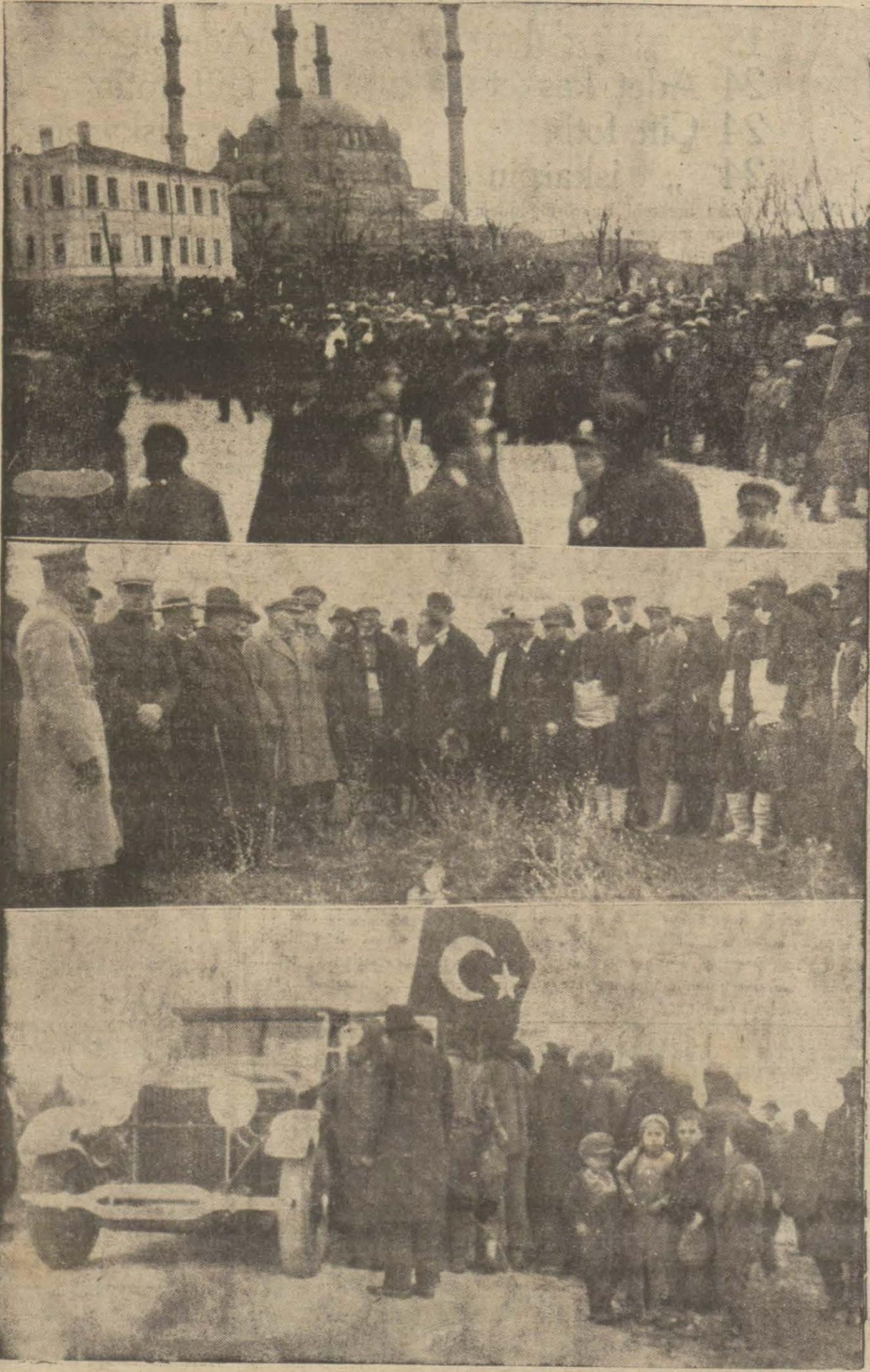
Gazi Hazretlerinin Edirne seyahatleri intibaatından: Yukarıda, halk Gazi Hz. sı bekliyor. Gazi Hz. köylülerle konuşuyor. Gazi Hz. nin yolu üstünde bekliyorlar.