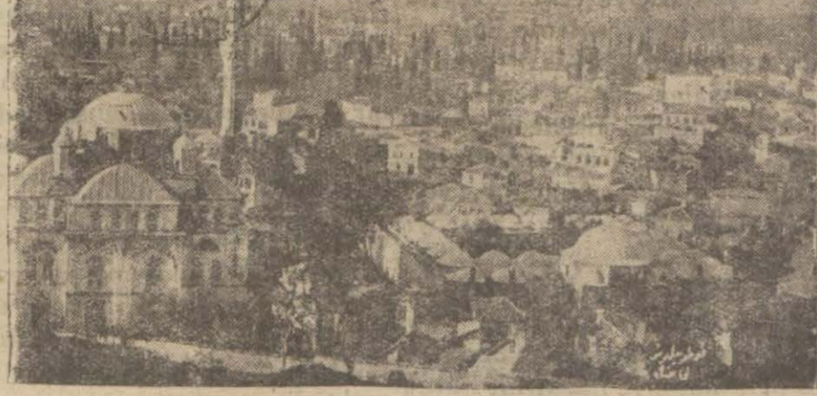
Hâdise ile alakadar 12 kişinin tevkif edildiği Manisadan bir manzara..

Demokrasinin ömrüne bir daha dua edelim.