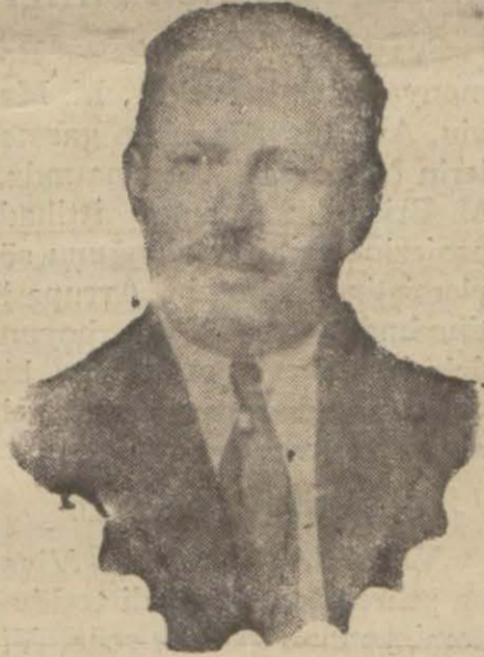
İzmir Valisi Kazım Paşa

tırıldığı hakkında İzmir muha- birimizden aldığımız mütem- mim malûmatı sırasile nesrediy- yoruz: