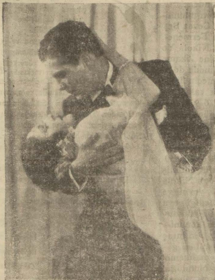
"Çılgınlar revüsü,, filminden