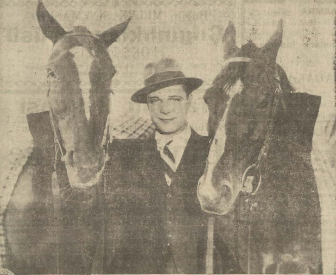
"Mukaddes vazife,, filminden

Clara Bow "Sadık bahriyeli," ismindeki filmi bitirmiştir. Yakın "The Plum Beach Girl," ismindeki yeni filmi çevirmeye başlayacaktır. Bu yeni filmde Clara Bow Skeet Gael'le beraber oynayacaktır.