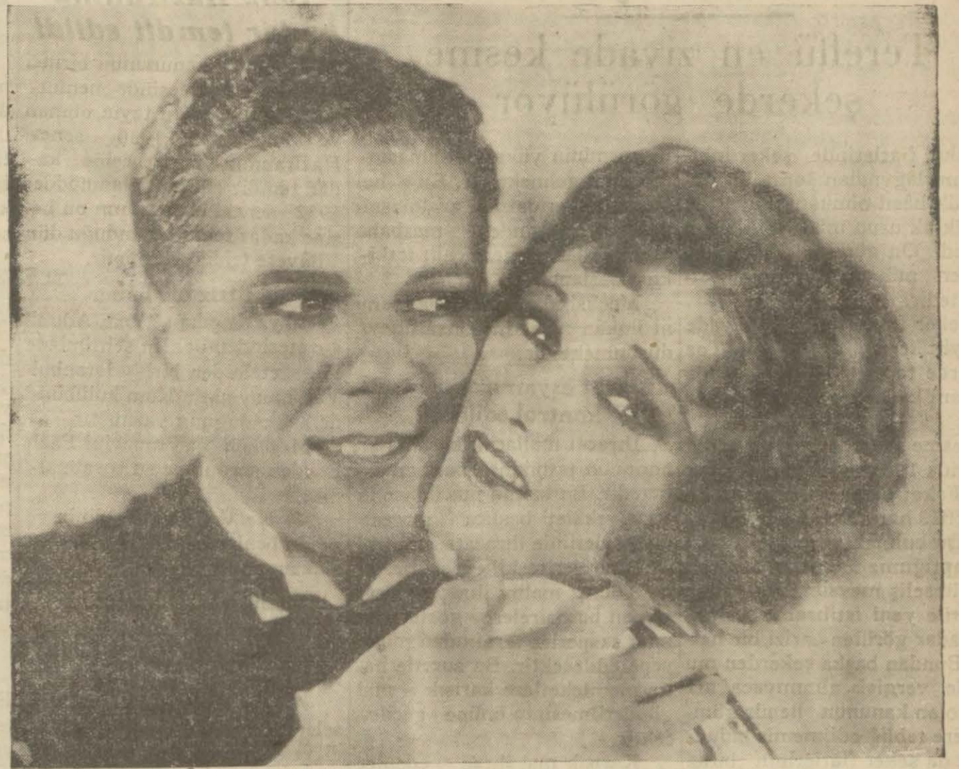
"Çılgınlar revüsü,, filminden

Fakat Jessie intihar etmeden evvel sevdiği bir delikanlının cebine Hendersonun mektuplarını koyduğundan bu genç Hendersonun alçaklığının cezasını vermek için onun nezdine giderse de Hendersonu Jessie'nin pederi tarafından öldürülmüş bulur ve bu vak'a üzerine Hattonun masumiyeti meydana çıkar.