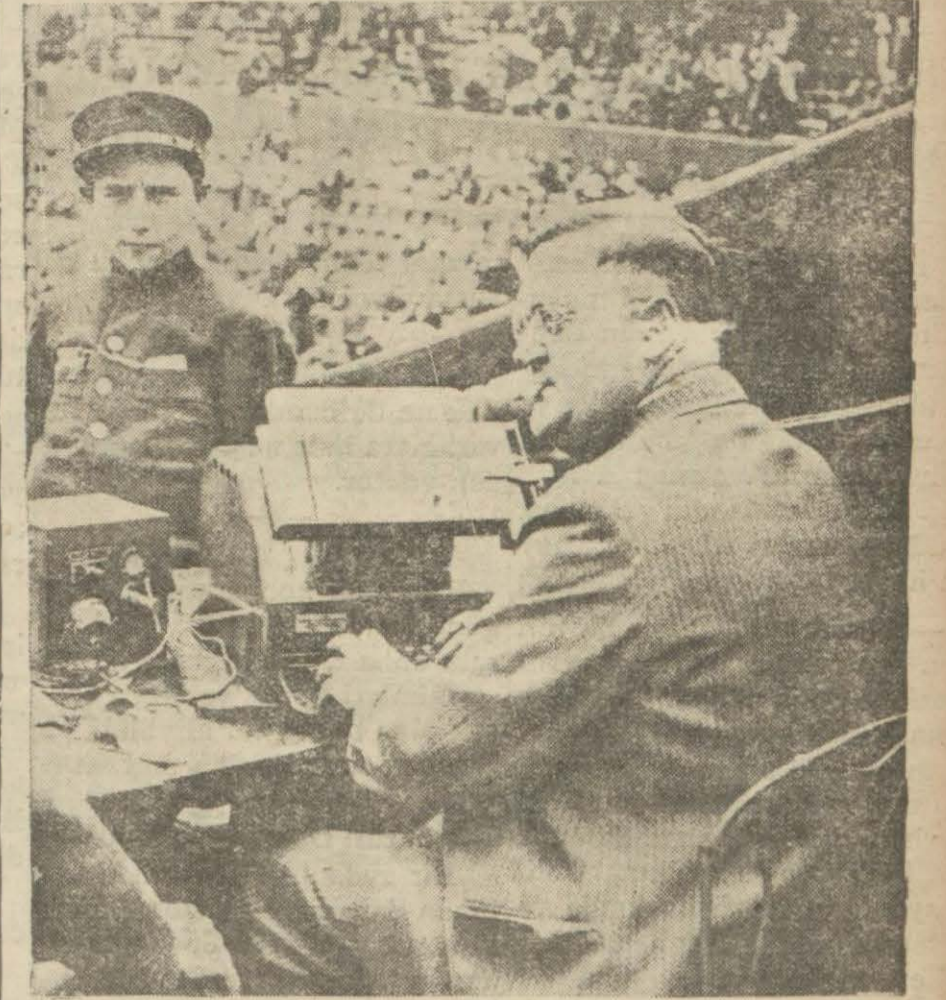
Fransa tenis şampiyonası esnasında bir Amerikalı muhabir ihtisaratını doğrudan doğruya Amerikaya nakletti.