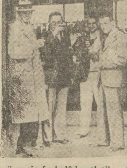
yüzgecin fevkalâde atletik vücudünü gösteriyor. Ortadaki resimde olimpiyat dalma kadın şampiyonile beraber. Aşağıdaki resimde bir bar kapısında. Sol-