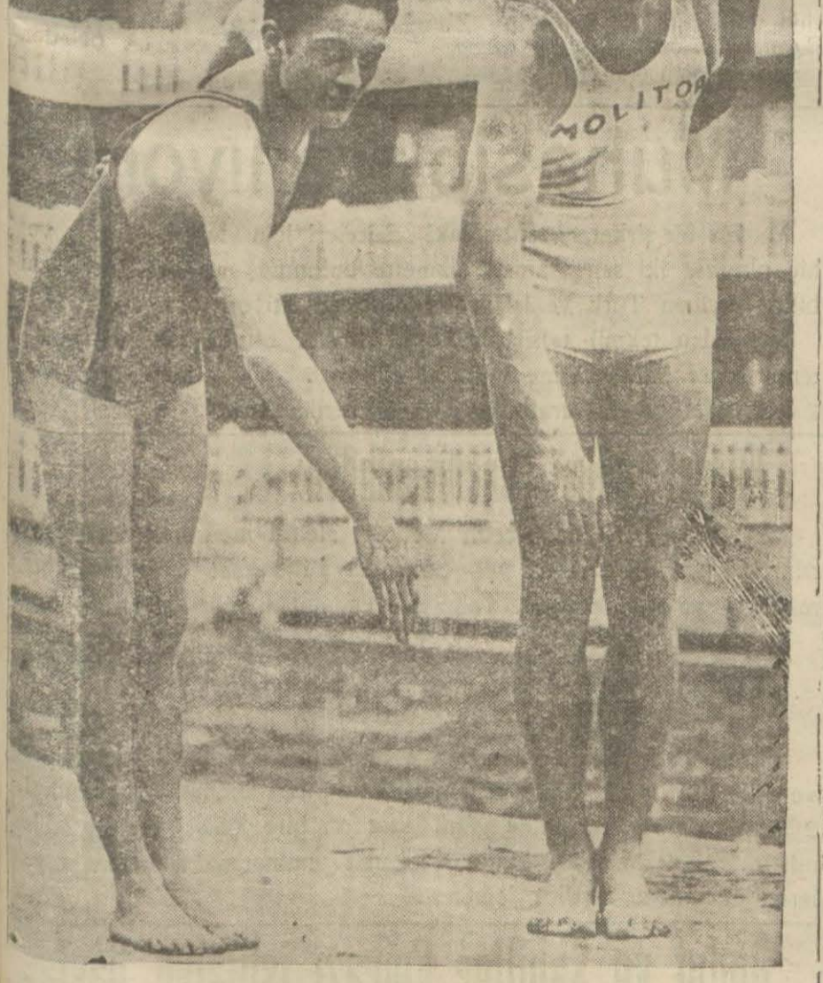
Dünyanın en iyi yüzgeci Amerikalı profesyonel Weismuller Pariste yeni açılan (Molitor) yüzme havuzuna bir ay için muallim olarak angaje edilmiştir. Yukarıdaki resim bu da bir ders esnasında.