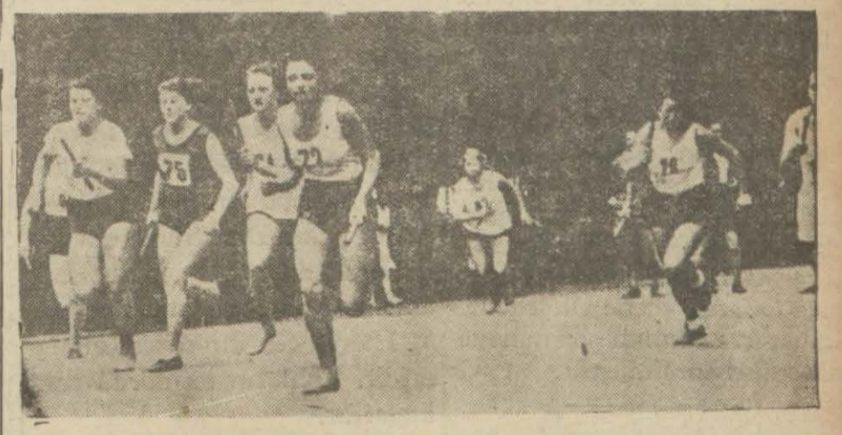
Viyana'da kadınlar arasında sokakta yapılan bir bayrak koşusu.