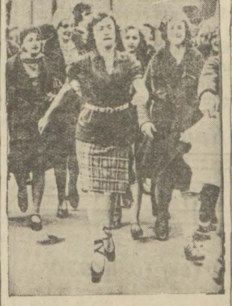
Bristol'da genç bir aktris parmaklarının ucunda 1200 metre vürtiyerek rekor tesis etti.