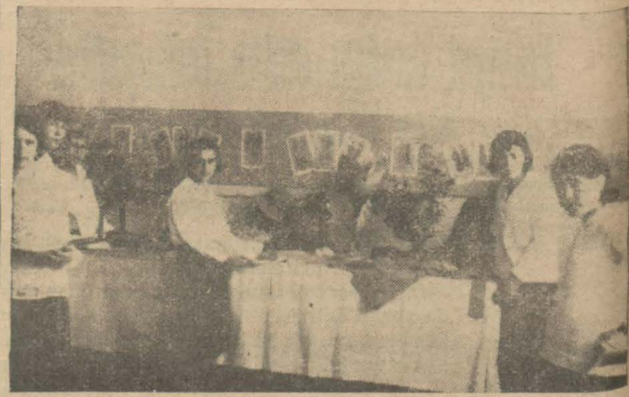
Dün Selçuk hatun kız lisesinde talebe el işleri ihtiva eden bir sergi açılmıştır. Resmimiz sergiden bir intibadır