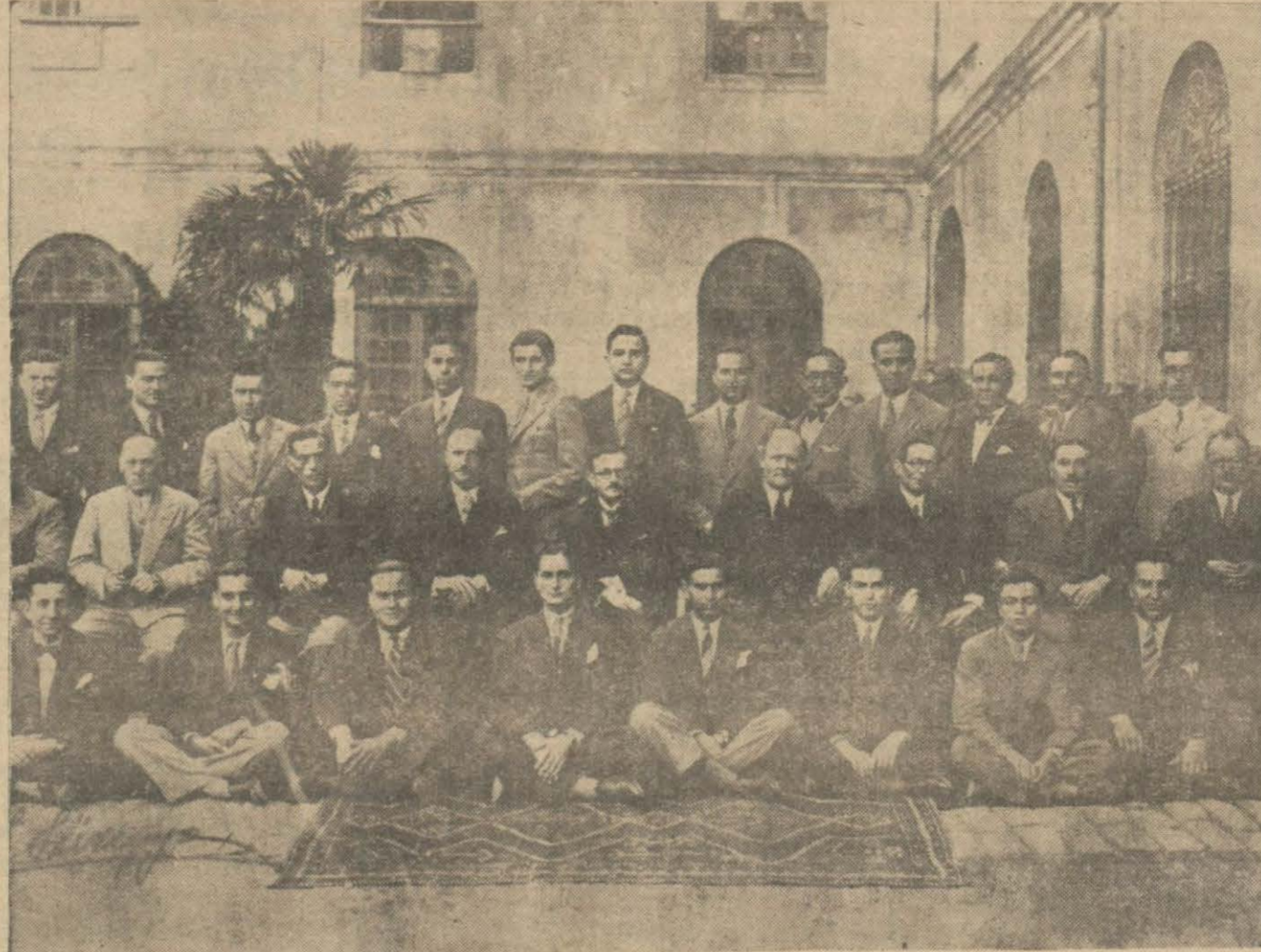
Galatasaray Lisesinde de drisatın muvafık bir tarzda ce- mezuniyet imtihanları bitmiş- reyan ettiği tesbit olunmuştur. tir. İmtihanlar neticesinde te- Bu münasebetle Galatasaray Ticaret kısmı mezunlarının fo- tograflarını dercediyoruz.