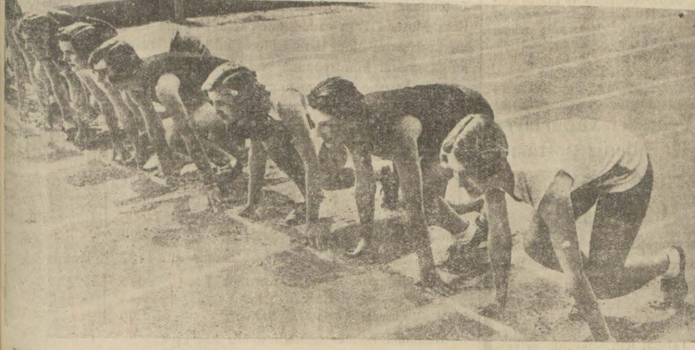
Kadın sporlarının en müteakleki bulunduğu ve sporcu kadınlara en fazla malik memleket muhakkak ki Amerikadır. Orada hemen hemen spor yapma-

yan kadın yok gibidir. Bu kadar bolluk içinde tabii dünyanın en iyi sporcu kadınları da umumiyetle orada yetişmektedir. Resmimiz Amerikalı genç ve güzel kızları bir 100 metre deparında göstermektedir. Nefis bir tabloya benzeyen bu resmi görünce insan spor yapmağa hevesleniyor mu?