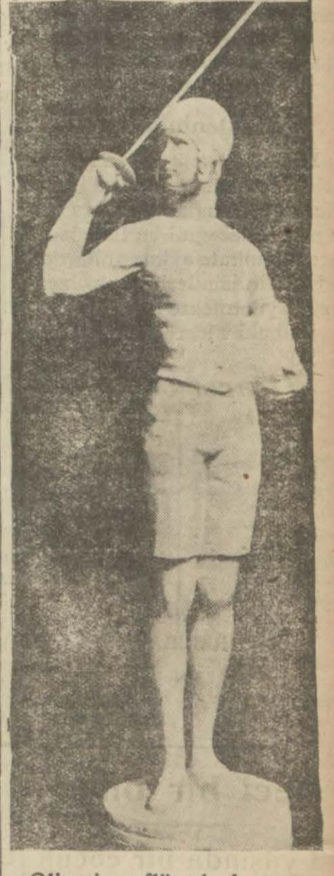
Olimpiyat flöre kadın şampiyonu Elen Mayer'in nefis bir eldiveni moda olmağa başlamış statüsü.