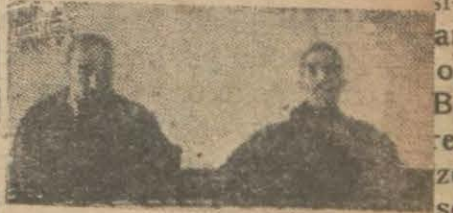
Bursanın asıl hâkimleri

Çünkü heyeti hâkime bu adilâne kararile hürriyeti matbuat ve gazeteciliğin bir lâzımı gayri müfarkı olan hakkı tenkidî tarisin etmiş oluyor. Dün bu hususta Bursa muhabirimizden aldığımız