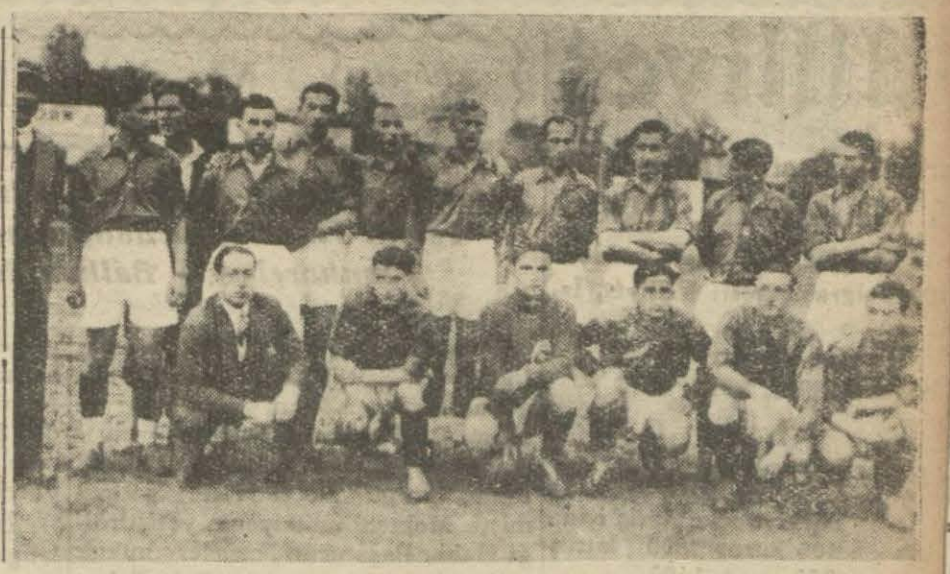
Galatasaray Dresten sahasında..

Üç aylıkların tediyesi için tekaüt kanununun Zat işlerine tebliğ edilmesi lâzımgelmektedir. Dün akşama kadar, Zat işlerine tebliğat yapılmadığından tevziata ne zaman başlanacağı malûm değildir.