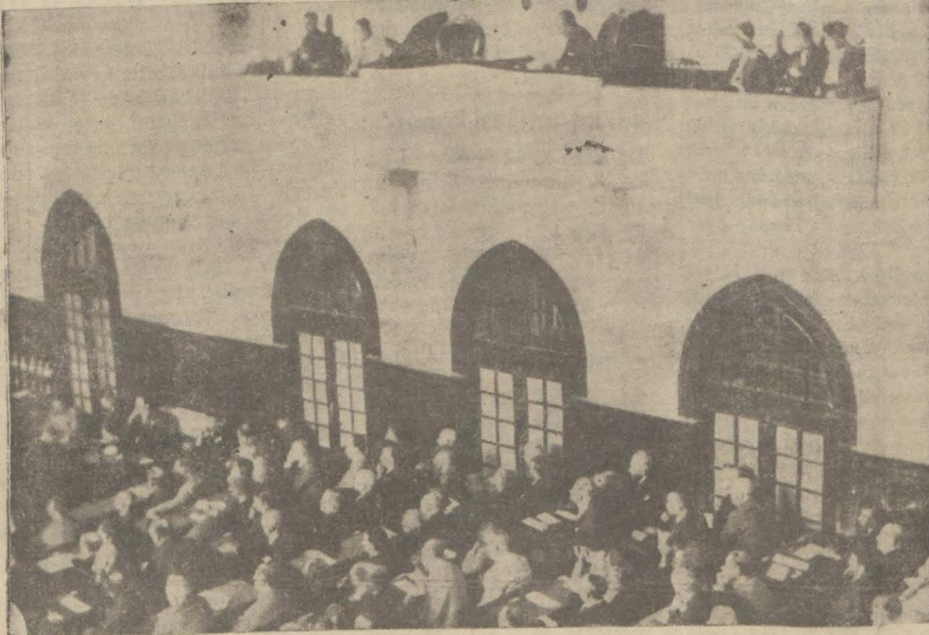
Gazi Hz. Meclisteki localarından İsmet Paşanın nutkunu dinliyorlar