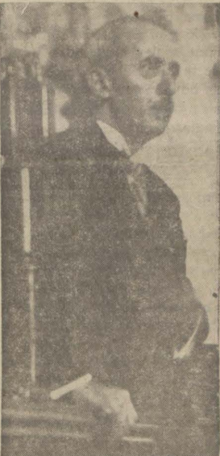
İsmet Paşa, Millet kürsüsünde şark zaferimizin ehemmiyetini işaret ederken