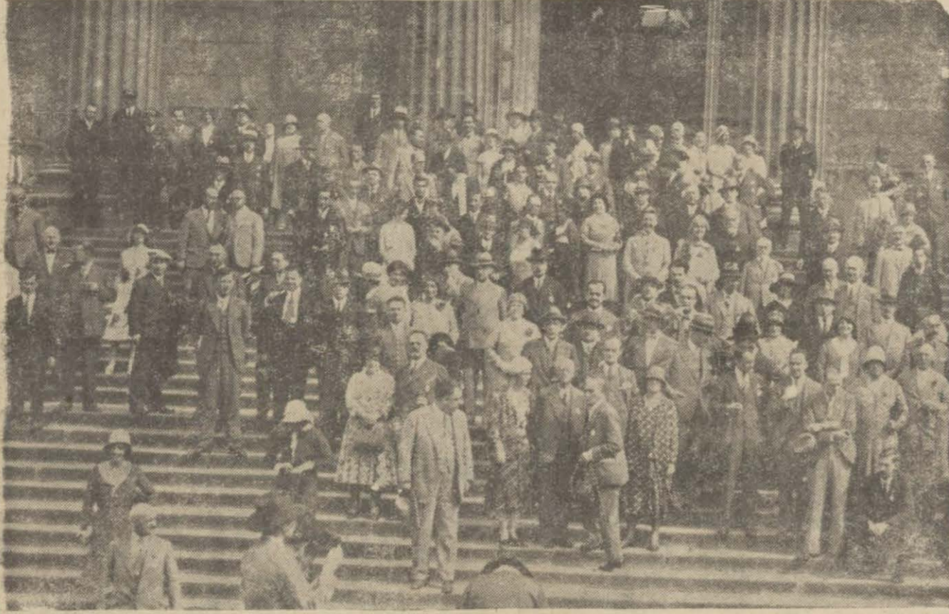
Beşiktaş'ta beş Eylülde bütün dünya mimarları murahhaslarının iştirakile bir kongre toplanmıştır. Resmimiz kongrenin içtima ettiği bina önünde murahhasları göstermektedir.