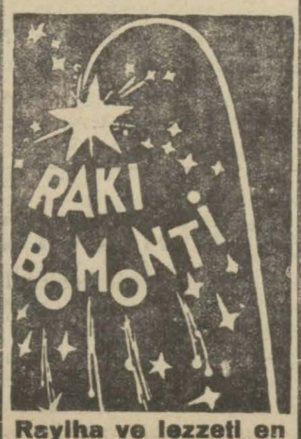
Rayiha ve lezzetli en

Rakiya kıymet veren yainiz rayiha ve lezzetli değil, kimyevi terkibinin safiyetlidir