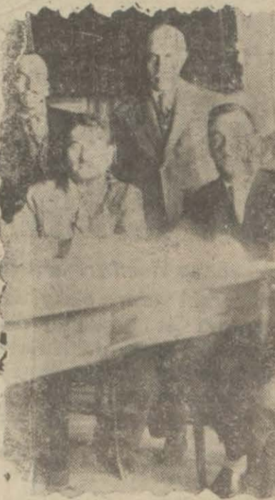
Beyazıt belediyesinde intihap encümeninin faaliyetleri

İntihap cedvellerinin aslı müddeti yarın akşam saat altıda tamam olacak, cedveller kaldırılacaktır. Yapılan müracaatlar neticesinde isimleri unutulmuş larm da isimleri cedvellere idhal edilmiş ve artık bu kabil müracaatların önü hemen, hemen açılmıştır. Bundan sonra reylerin toplanması için hazırlıklar başlayacaktır. İstanbulda belediye intihabatına iştirak edecek kadim, erkek müntehiplerin miktarı 250 bin kadardır. Sandıklar 5 Teşrinievvelde çıkarılarak reyler toplanmağa başlanacak ve herkesin bizzat reyini kendisi vermek mecburiyeti bulunduğundan hiç bir mazeret kabul edilmeyecek ve başkaları ile gönderilen reyler kabul olunmayacaktır. Sandıklar kaza merkezlerinde bulunacak ve evvelâ kaza dahilindeki müntehiplerin, sonra da nahiyelerdeki müntehiplerin reyleri toplanacaktır. Nahiy müntehipleri de kaza