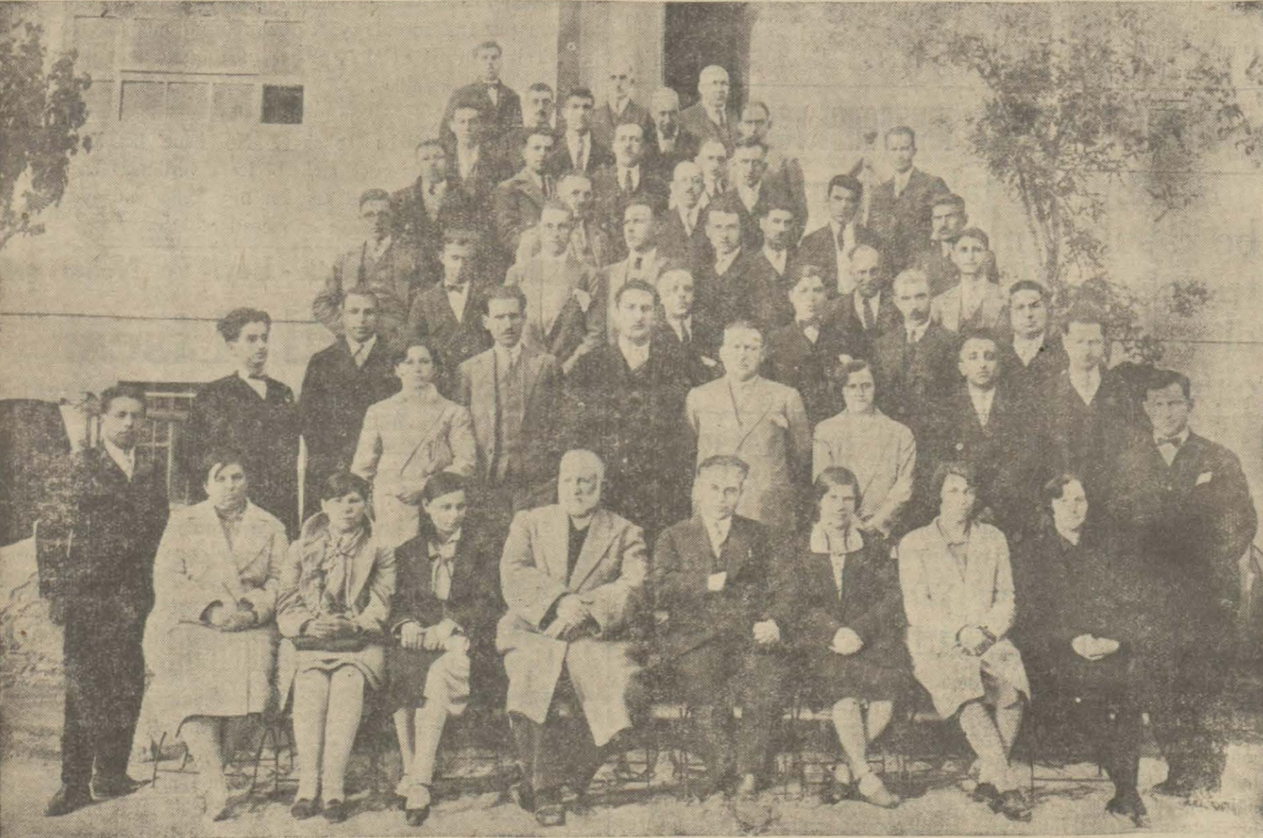
Bandırma'da mektep muallimleri gurup halinde