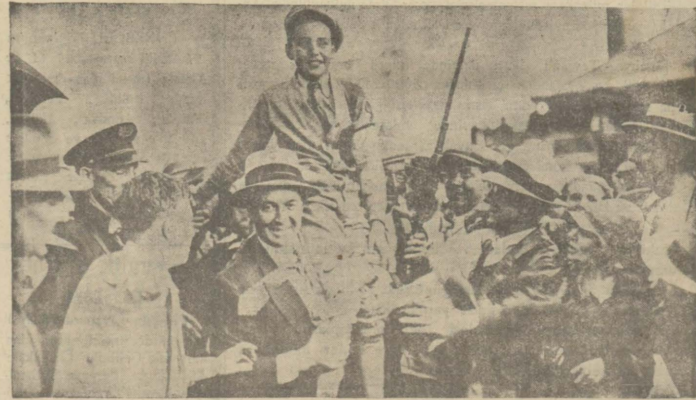
Bu ondört yaşındaki çocuk Amerikada ahiren yapılan atıcılık müsabakasında birinci gelmiştir. Bunu takdir için bütün rakipleri kendisini omuzları üstünde gezdiriyorlar

Hiç beklenilmediği bir zamanda birdenbire zengin olmak ancak Tayyare Piyango bileti almakla kabildir. Onun için: