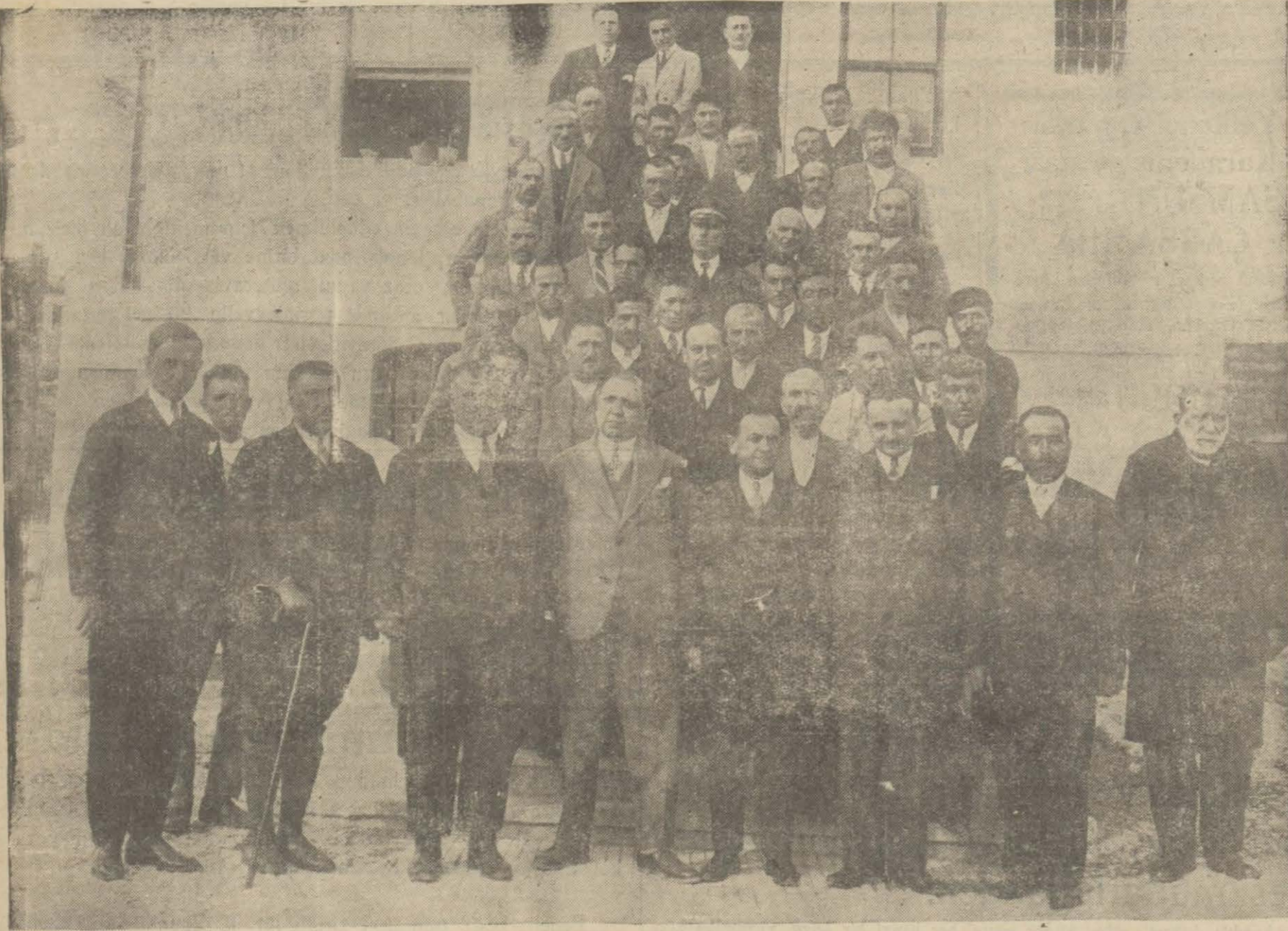
Bandırma'da 930 senesi ticaret odası hey'eti umumiyesi