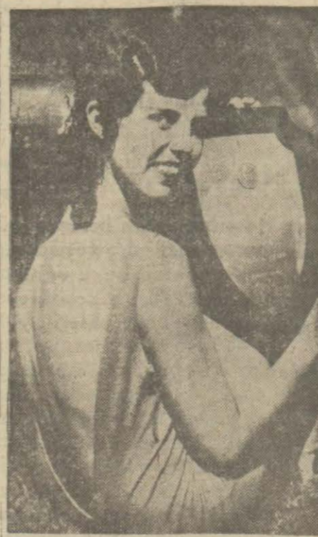
13 yaşındaki güzel kız ahiren Amerikada dörtüç genç kadın arasında yapılan müsabakada omuz ve arkasının güzelliği ile birinciliği kazanmış ve bunun için eline mükâfat olarak madeni bir levha verilmiştir.