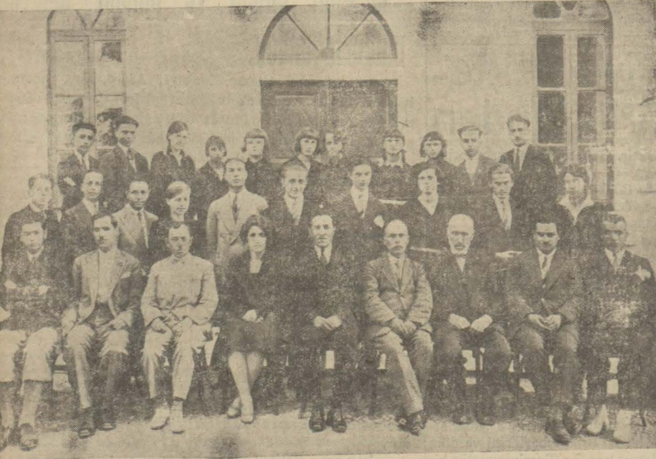
Çanakkale orta mektep 930 mezunları, heyeti talimiyesi ile birlikte