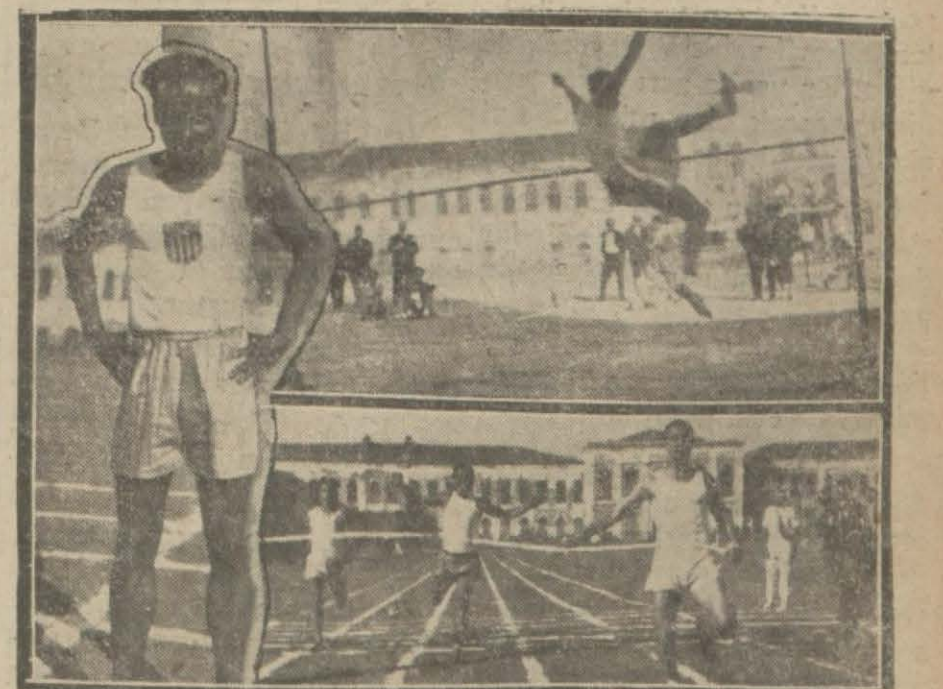
Dünkü atletizm müsabakalarından bir kaç sahne: Yukarıda yüksek atlama, aşağıda yüz metre sür'at koşusuna giren atleter, Sağda yüz metrede galip gelen Cezayirli Fransız koşucu.