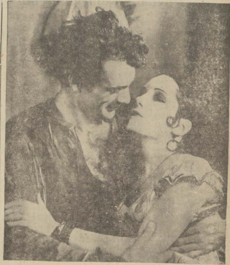
Kurt şarkısı filminde (Lupe Velez ve Garri Kuper)