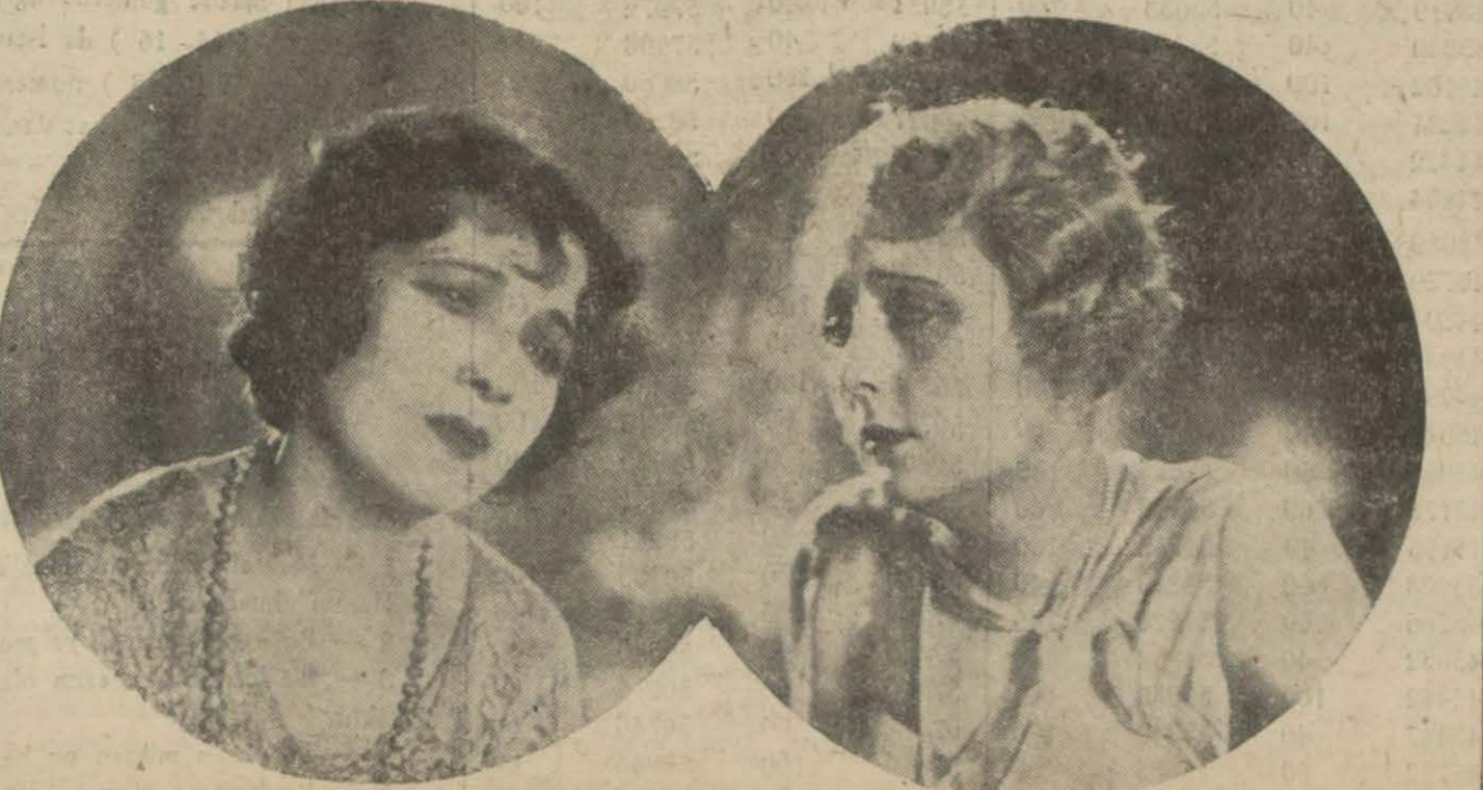
"Bir kadın yalancı,, filminden