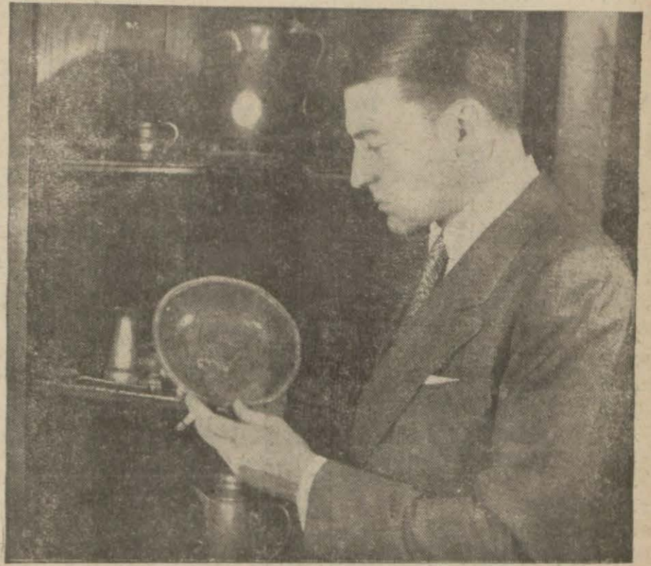
Maruf İngiliz sinema artisti Klayv Bruk