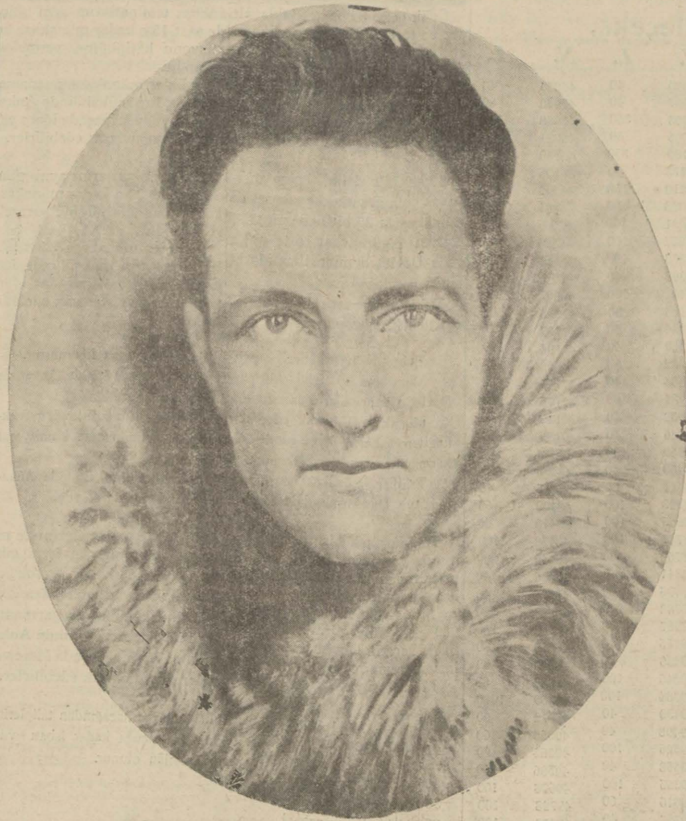
Amerikalı kâşif Amiral "Byrd,,

Direktör Iort Browing, Yackic Coogaran ailesine küçük kardeşi Patıda filme vermelerini teklif ve kabul ettirmişti. Acaba oda Yackic kadar muvaffak olabilecek mi? Ona da Chaplin gibi bir hami lâzım gelecek mi?