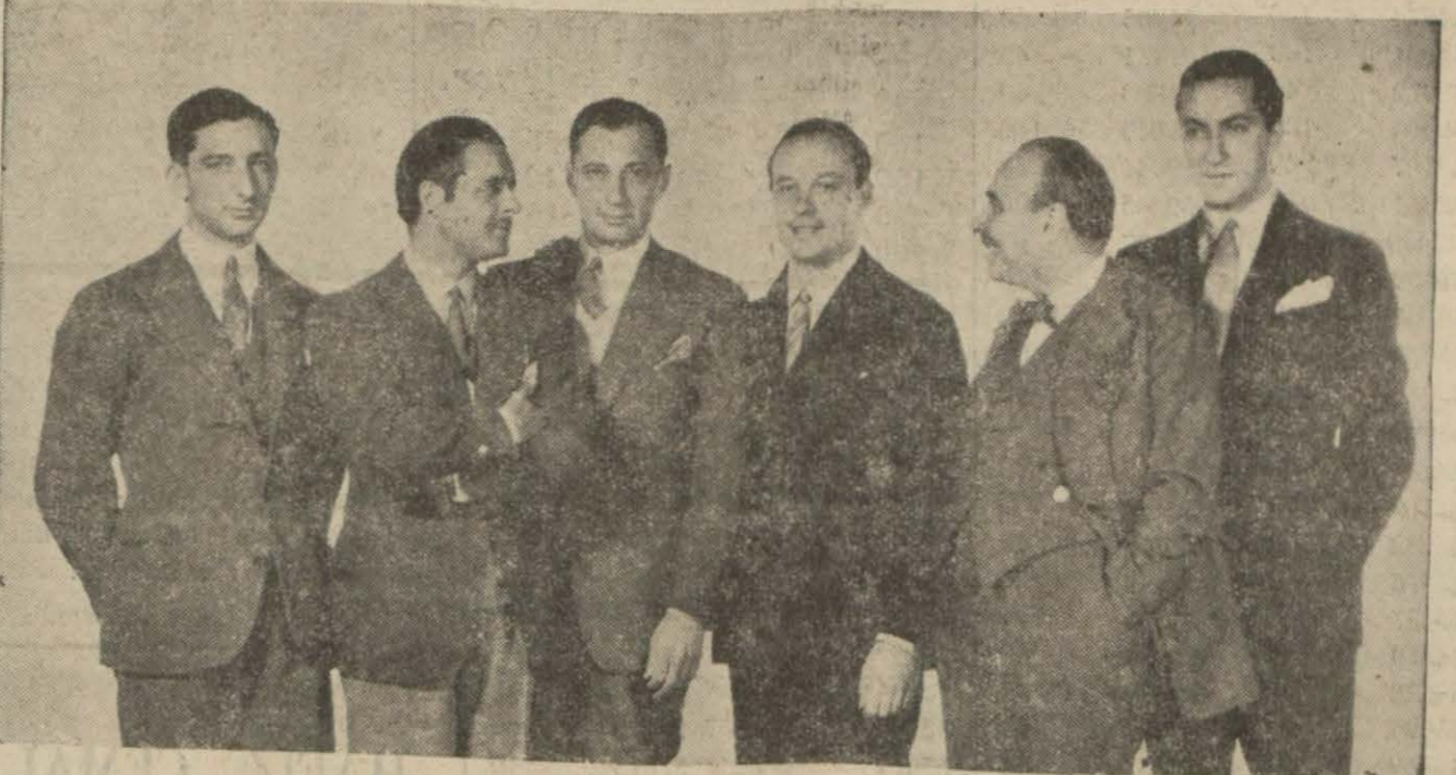
"Ho y o'd,,da Fransız sinema kolonisi