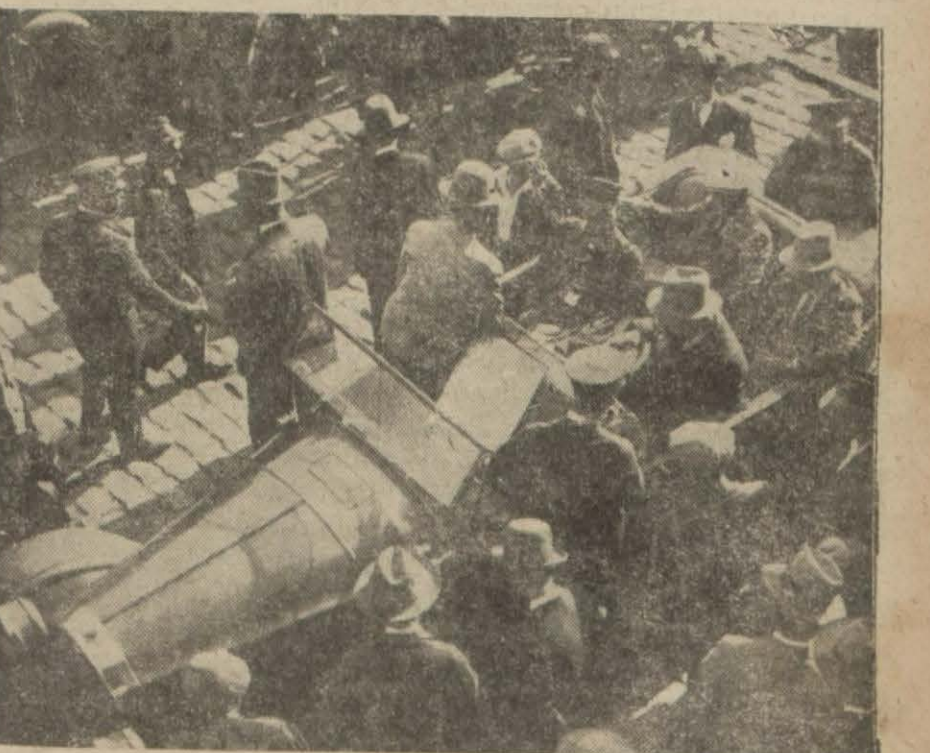
Şoförler cemiyetli idare hey'eti İntihabi dün bitti. Resmimiz rey sandığını doluşturan otomobil gösteriyor

İZMİR, 10 (Milliyet) — Haber adımıza göre İstanbul müddeiumumîliği Son Posta gazetesi, İzmir müddeiumumîliği Yeniasır, Hizmet, Halkın Sesi gazetelerine mevkufklar hakkında hükümete ve meclise hakareten dolayı takibat yapabilmek için Adliye Vekili vasıtasile meclisten müsaade istemiştir. Adliye Vekili meclis reisine arz etmiş ve Meclis Reisi de istenilen müsaadeyi vermiştir, takibat derhal başlayacaktır.