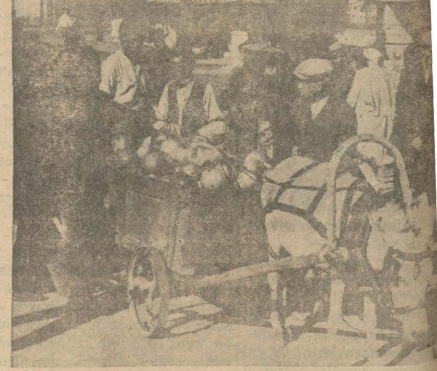
Bu sene karpuz çok boldur. Sokaklarda karpuz satan arabalar görülmektedir.

Şişli'de Meşrutiyet mahallesinde İzzet Paşa sokağında Valide apartmanında 1, 2, 8, 6 numarolu dört daire kiraya verilmek üzere müzayedeye konulmuştur. Talip olanların yevmihalâ ve müzayedeye olan şehri halâ 23 üncü cumartesi günü saat on beşe kadar İstanbul Evkat müdüriyetinde Pertevniyal vakfı idaresine veya encümenine müracaat eylemeleri.