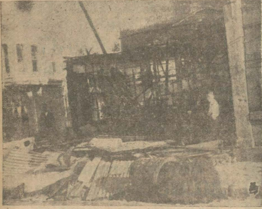
Dün Bakırköyünde yanan bes dükkandan biri " Yazısı iç aahifemizdedir .