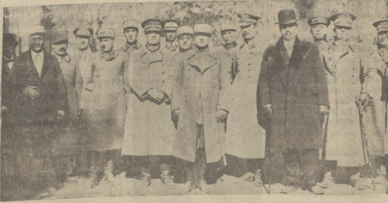
Türk-İran tahdidli hudut komisyonunun yakında faaliyete başlayacağından bahsediliyor. Bu münasebette İğdırda İran tahdidli hudut zabıtlarına zabıtlarımızla birlikte çekilmiş bir fotoğrafını dercediyoruz.