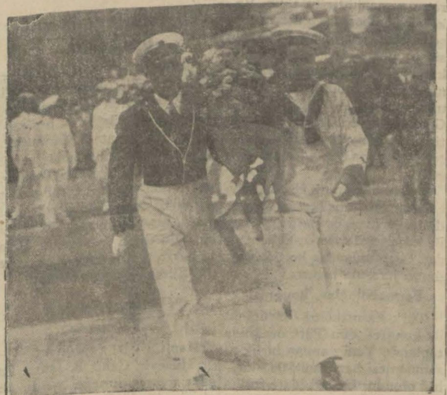
İtalya bahriye talebesi Cumhuriyet abidesine çelenk hoymağa giderken

Dün akşam sefaretçilerimiz sereflerine bir gardenparti verildi.