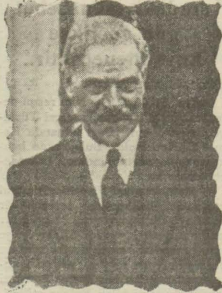
Mr. Mac Donald

İngiliz Başvekili ile diğer kabine arkadaşlarının maaşlarının arttırılması meselesi bir müddettenberi tetkik edilmektedir. Başvekil ile nazırların aldıkları maaş az görülüyor. Maaşları şimdi ki Başvekil Mr. Mac Donald maaşının tezyidi hakkında bir talepte bulunmuş değildir. Fakat parlamento da bir komisyon bu hususta tetkik yapmaktadır. İngiliz Başvekil ile kabine arkadaşlarının senede aldıkları maaş miktarı arasında pek göze çarpan bir fark vardır. Öyle ki kabinedeki bir kısım aza Başvekinden çok maaş alıyor. İngiliz kabine