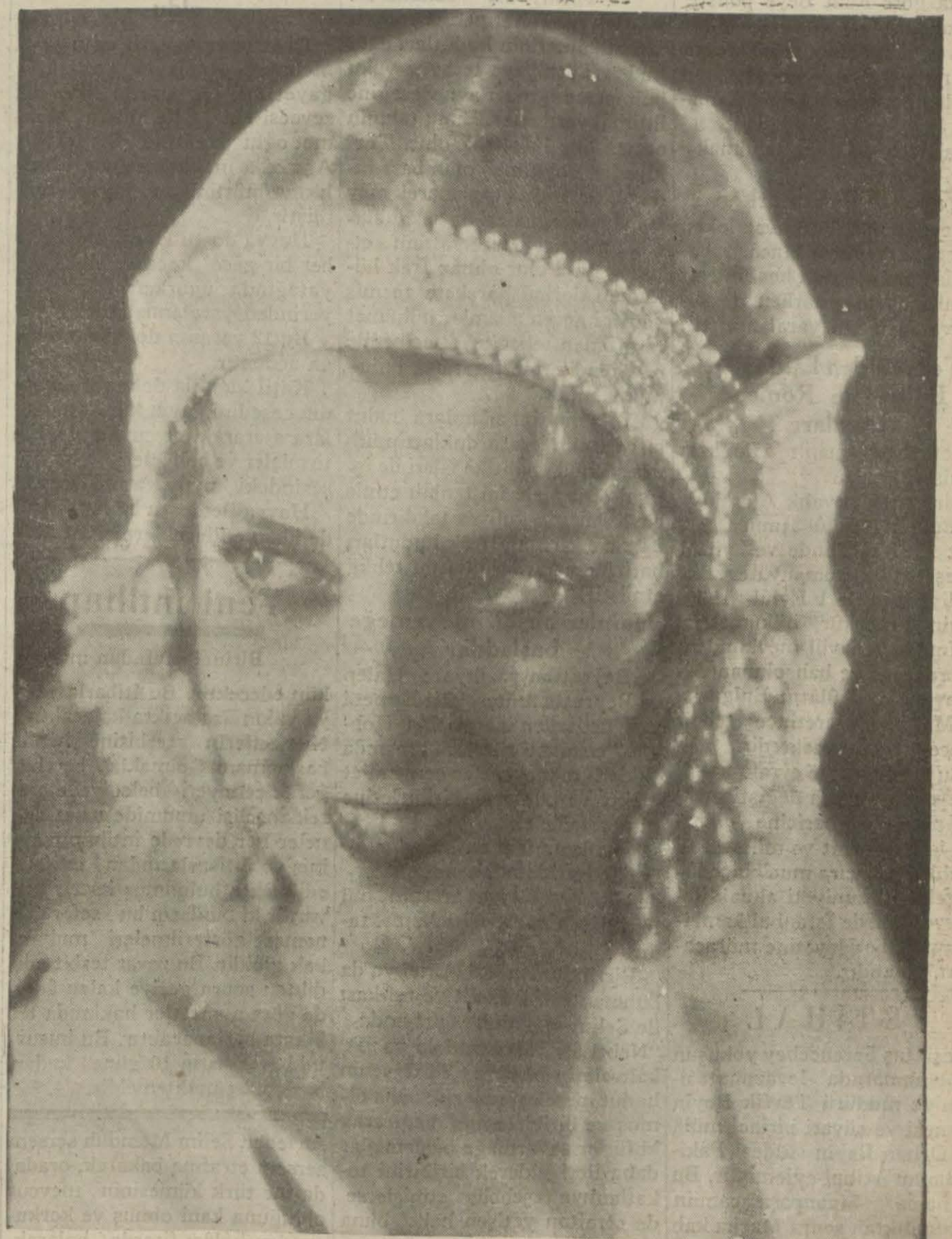
Jeannette Mac Donald Senseri Kırkı filminde