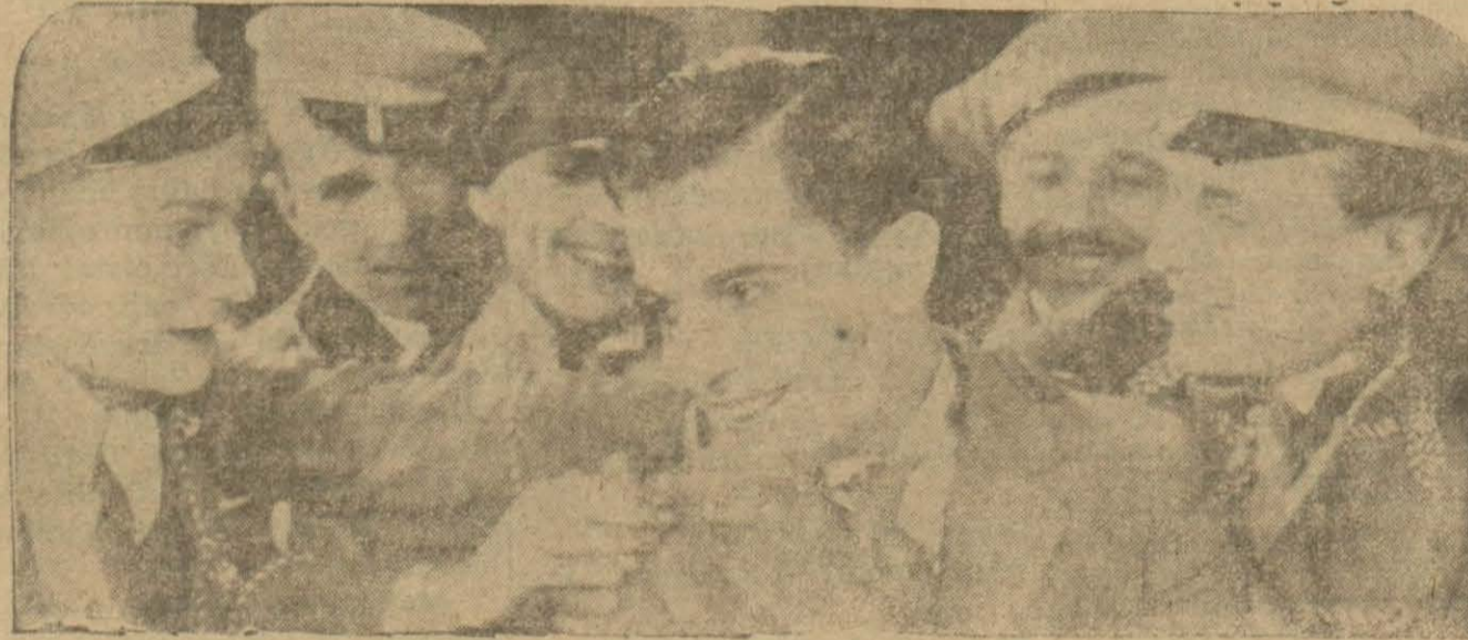
«Talebe Prens» filminden