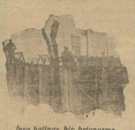
İnşa halindeki bir betonarme.

Tetkikatımızdan elde ettiğimiz netice şu oluyor: İstanbulca program üzerine müstenit, ihtiyaca muvafık