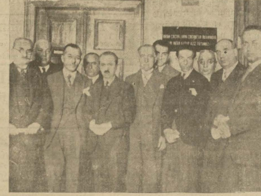
Ankara'da (Arı ve kömes hayvanatı koruma cemiyeti) namında bir cemiyet teşekkül etmiştir. Cemiyetin birinci içtimaidan sonra azalar bir arada