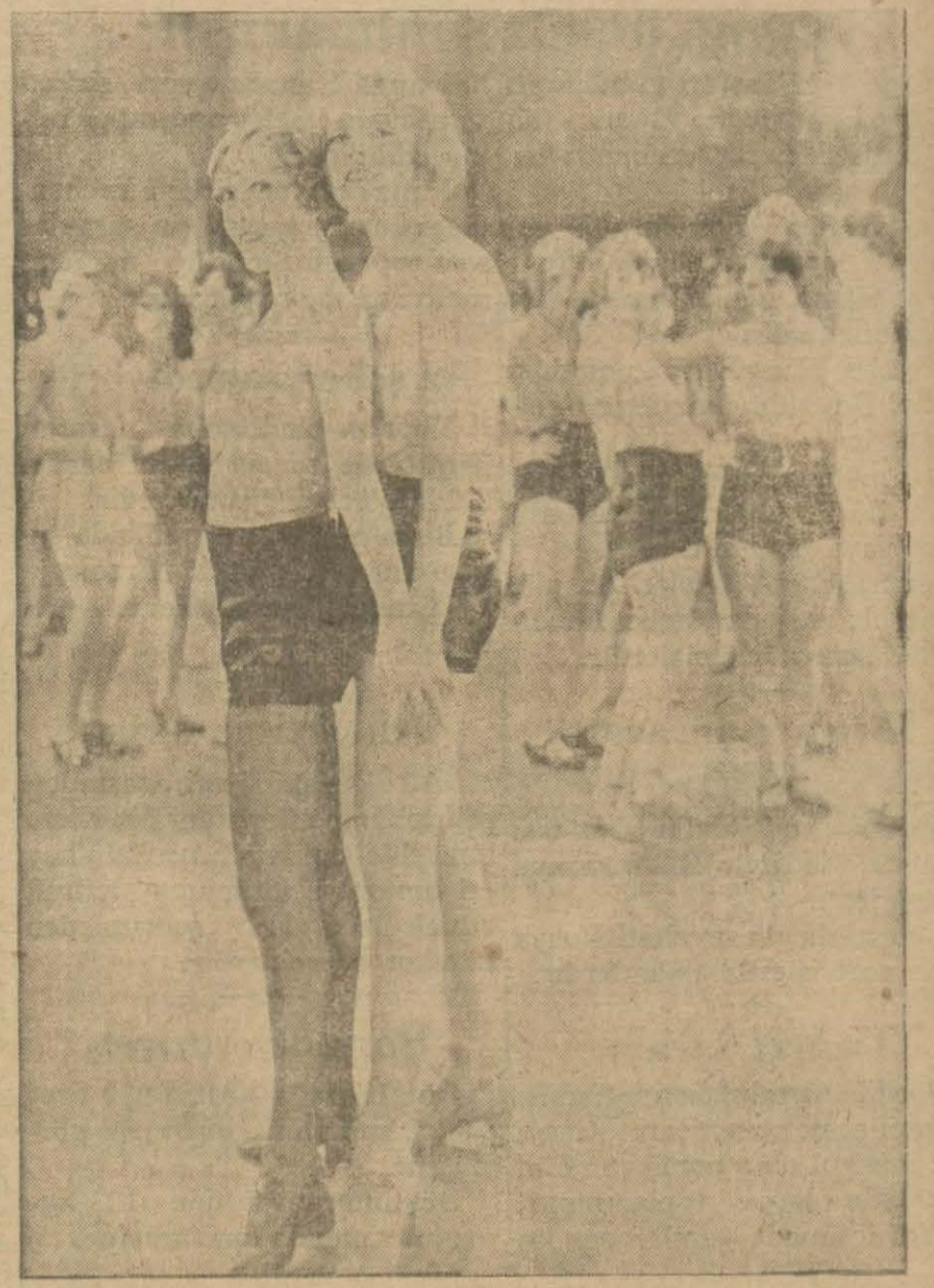
«Broadway Melody» filminden

— Şehrimizin film müesseselerinden biri gelecek sene Türkçe film çevirebilmek için 25000 dolar kıymetinde makine getirmeyi tasavvur etmektedir.