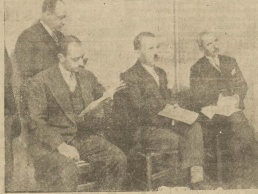
Ankara'da toplanan Ziraat bankaları kongresinde rapor dinletirhen: İsmet Paşa Hz. Maliye vekilli Saraçoğlu Şükrü B. ve İktisat vekilli Şakir B.

Gaza hile karıştırdıkları için 18 bakalı mahkemeye vermişlerdi. Davaları epeydenberi uzayıp gidiyordu. Dün son muhakemeleri görüldü, kabahatleri olmadığı anlaşılacak beraat kazandırlar.