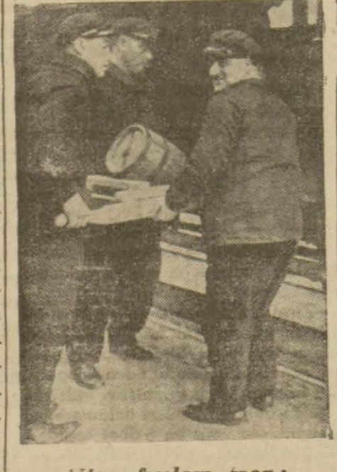
Altın fiçaları trenle yükletiliyor!

kları, parayı bir an evel kurtarmak için vakit kaybetmemişlerdir.