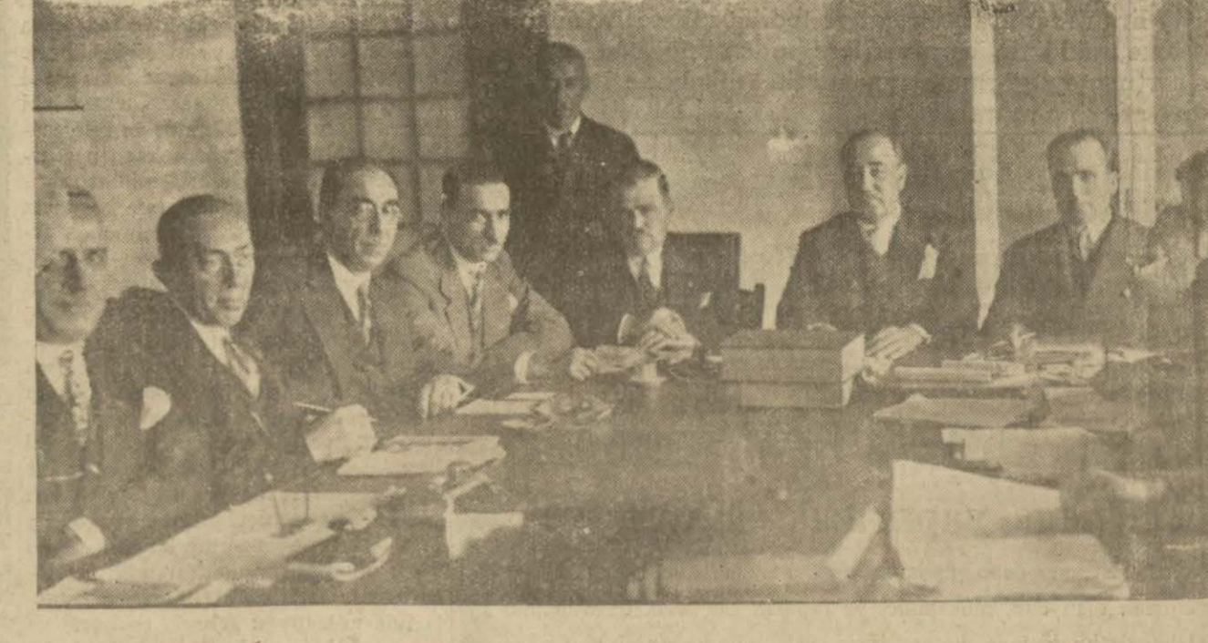
Belediye kanun lûyhası B. M. Meclisinde alt olduğu encümeninde müzakere edilmektedir. Lâyhayı müzakere eden encümen