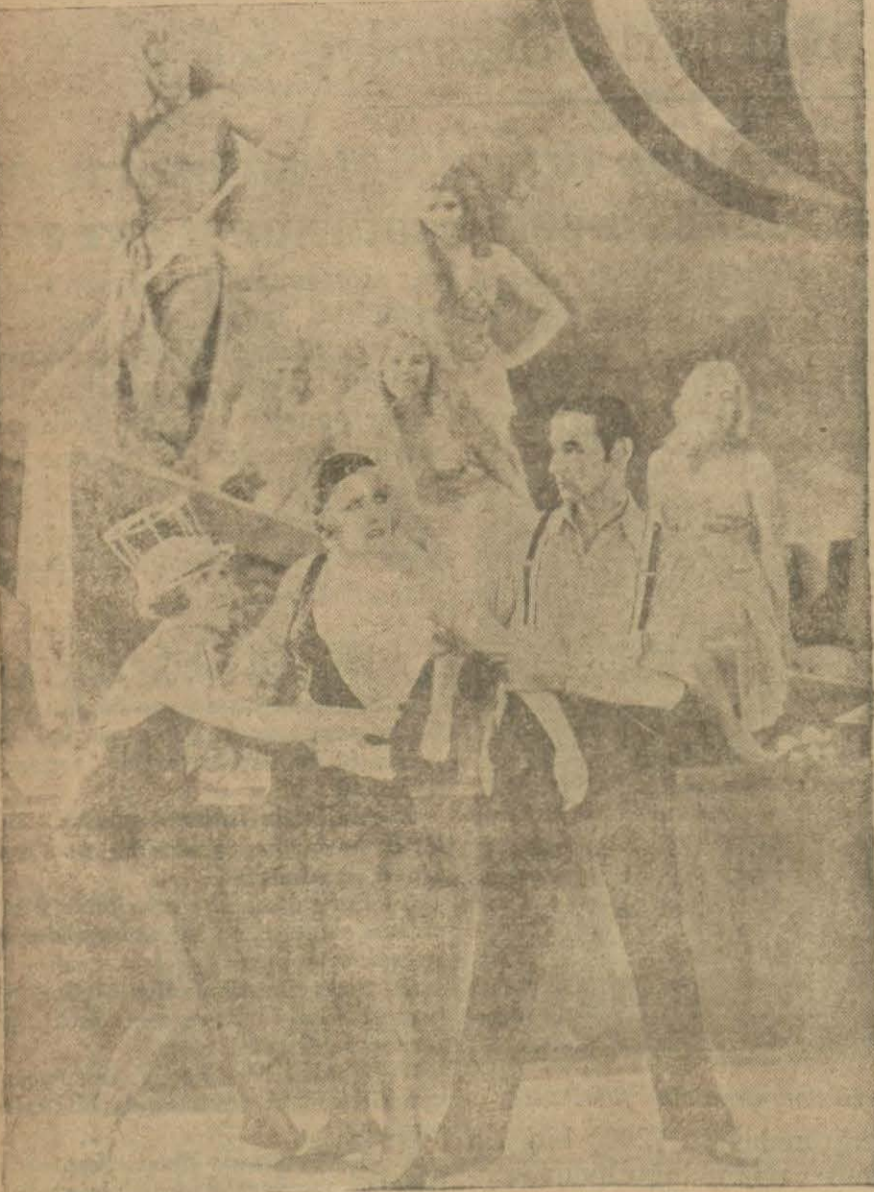
«Broadway Melody» filminden