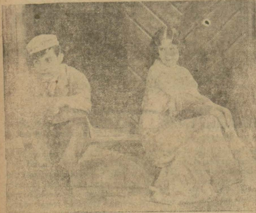
«Talebe Prens» filminden