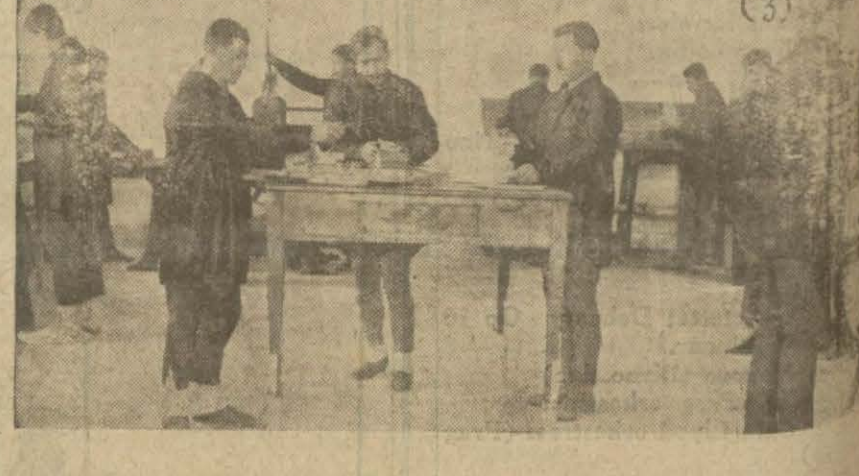
1— Ankara hapşanesinde mahkûmlar yeni e biselâ ile 2— Mah- kûmlar ders okurken 3— Mahsûmlar matbaada çaişirken