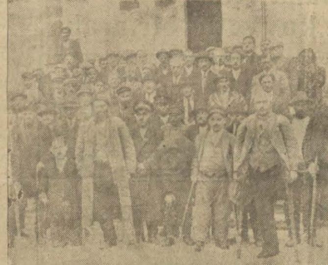
Ekseryet olmadıgından dün toplanamayan malûl gaziler kongresine iştirak edenler