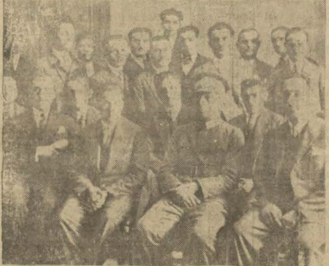
Süleymanlıye kulübü umumî senelik kongresini aktetti