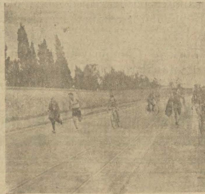
Galatasaray atletleri dün bir kır koşusu yaptılar