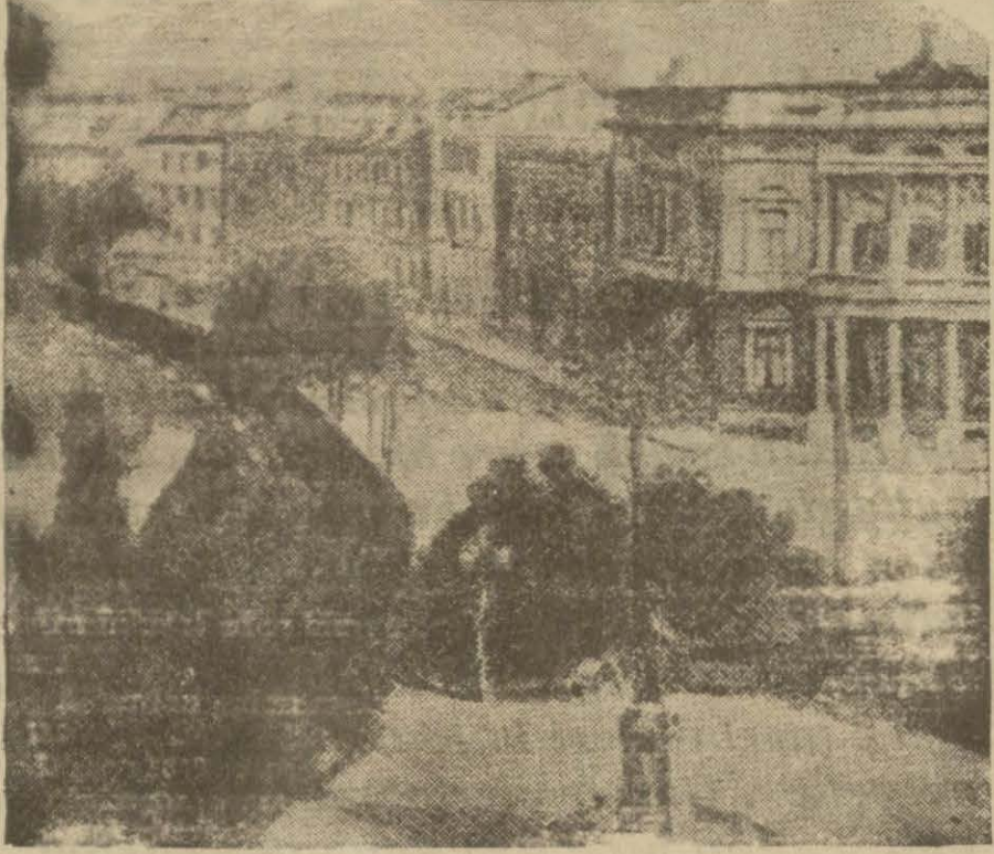
Düsseldorf şehrinin en güzel ot köşesi

Filhakika yapılan tahariyat kadının cesedini meydana çıkarılmıştır. Meçhul katil günden güne çüretini arttırmış, bir gazeteye neşredilmek üzere yolladığı mektuplarla yaptığı cinayetlerin kurbanlarının nerede gömülü olduğunu itiraf etmiş, fakat bunlar, zabıtanın tahariyatını hiç de kolaylaştırmamıştır. Halk arasında