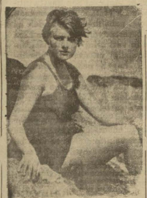
Meçhul katil en çok 'hafif mesrep kadınlara tesallut etmektedir

Bu gizli katilin Düsseldorf şehrinde çıkan bir gazeteye mektup göndererek polise meydan okuduğu yeni bir mektubule da-