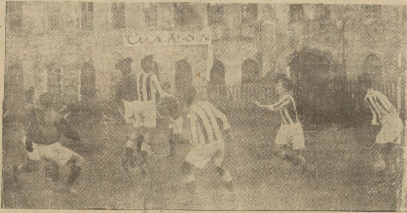
Dün ee ilk aışlarına devam edilmiştir. Resmimiz Galatasaray - Vefa maçıını gösteriyor

Gaz rakabeti aldı yürüdü. Bir şirket — gazı, ibreti âlem için 15 kuruşa indireceğini" diye