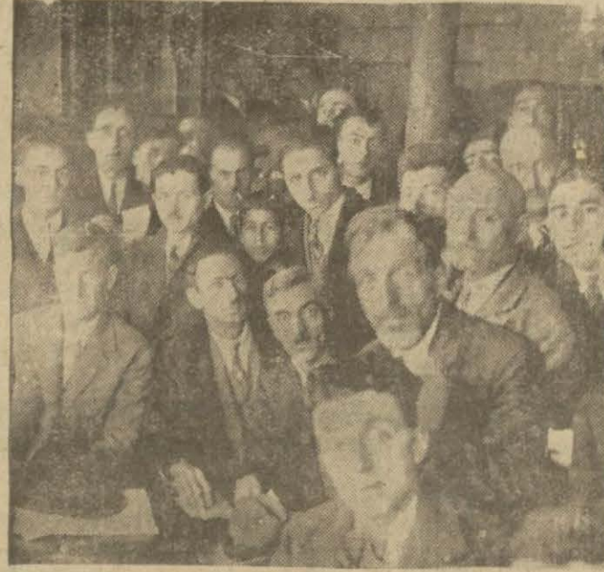
Dün senelik kongresi toplanarak yeni hey'eti idaresi intihap olunan Türk mürettibin cemiyeti