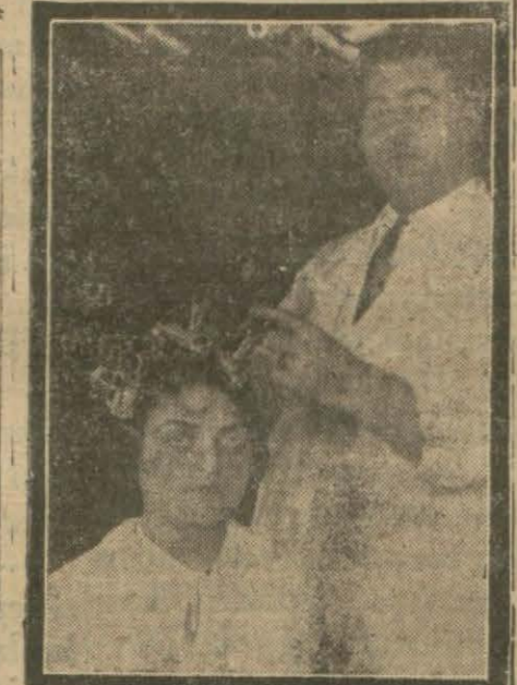
Altı ayda bir saç kıvrırma

— Kim bilir diyorum, bu fanusun içine saçlı saçsız kaç baş-