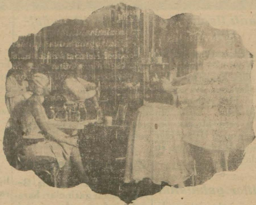
Öndülasyon ve perük esnasında

— Alo alo... Vilman salonu Burası, "... apartmanı... Hani manikürcü gönderirsiniz? — Alo... Ben Macide... Cakırsanız da dün yaptıracağım manikür bozuldu... Fena da sinirliyim... Anlaşıldı demi, hemen şimdii! — Geçen gün aldıracağım saç