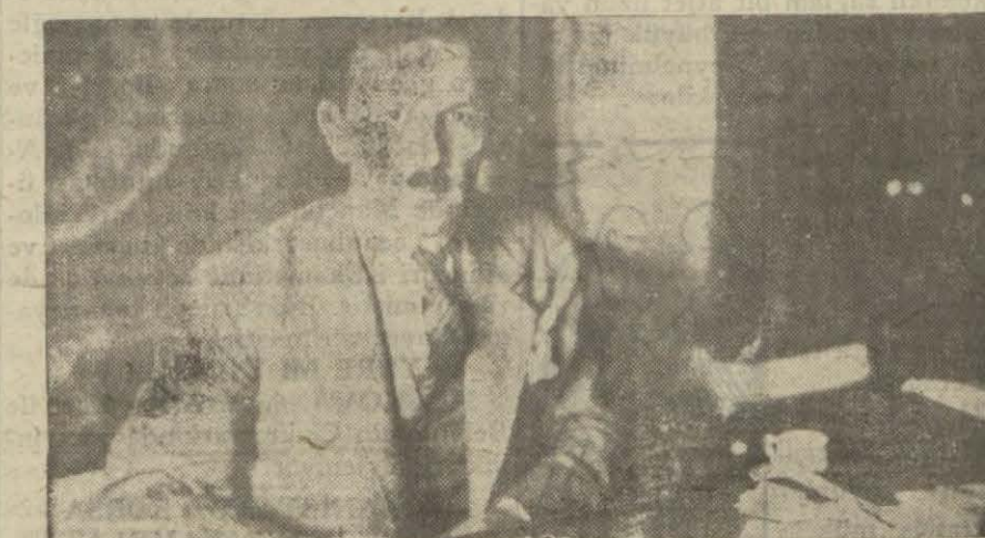
Maliye vekili Saracoğlu Şükrü Bey

Vergilere ihtiyaç nispetinde retuş icrası muhtemeldir. Gelecek sene bütçesi.. (DAYINLER VEKÂLETİ MESELESİ)