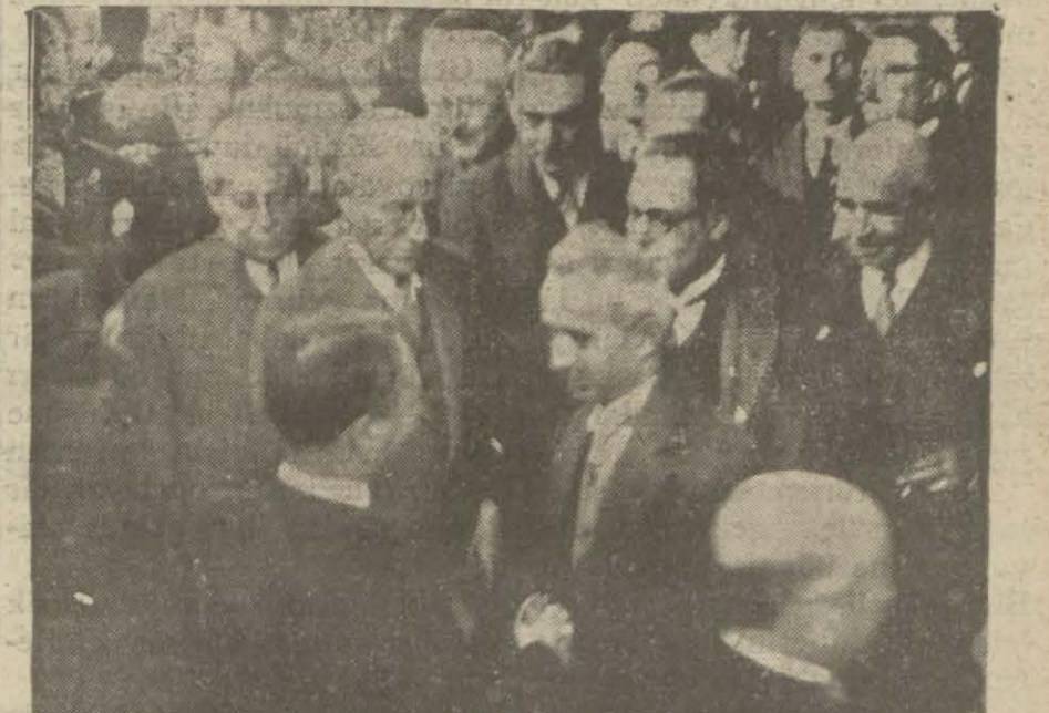
Başvekil Hz. hareketlerinden evel

Başvekil Pş. Hz. istasyonda Meclis reisi, vekiller ve meb'uslar tarafından parlak bir surette teşyi edildi