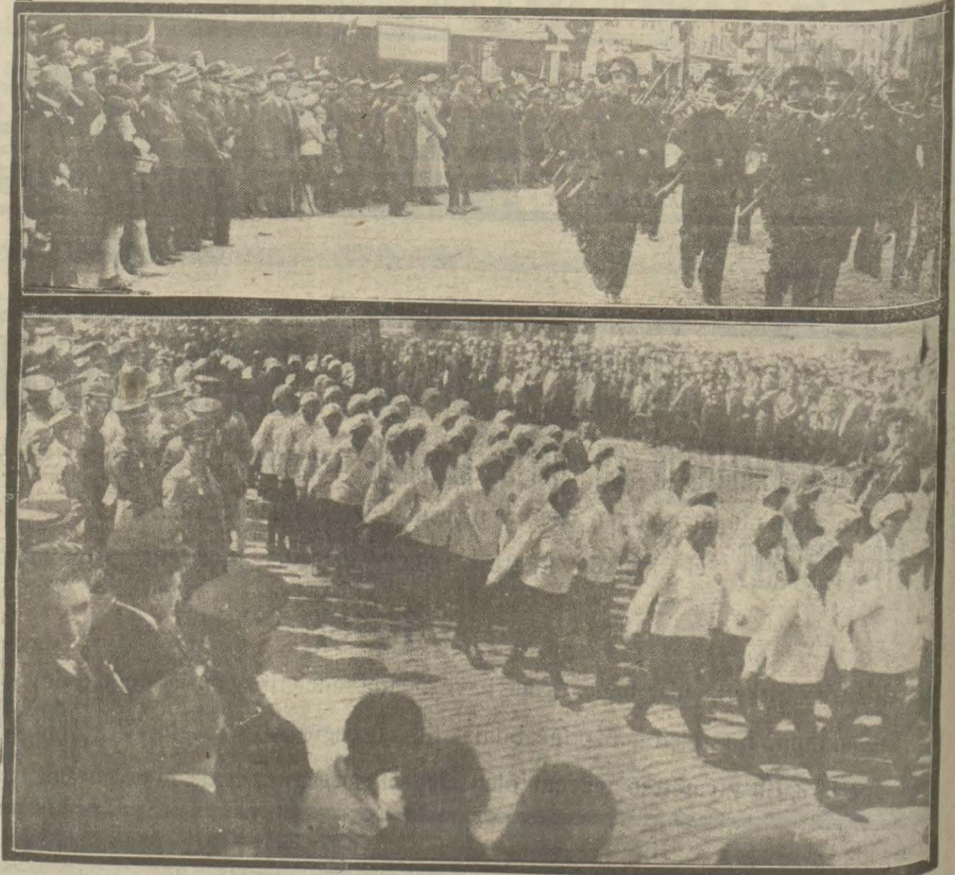
Dün İstanbulun kurtuluş günü idi. Bu münasebetle Takımda yapılan resmi geçitte ait iki intibadır.