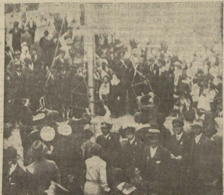
Dün açılan çocuk bahçesi yazısı (3 üncü sahifede)

Taksim meydanı bu büyük kitleyi istiyab edememiş, bir çok kimseler de ağaçlara, duvarlara tıranmıştı. Meydanın intizamı güçlekle temin edilebiliyordu. Meydanın bir köşesine şık, zarif bir tribün yapılmıştı. Tribünde Vali vekili ve Şehremini Muhiddin B. kolordu kumandan vekili, kolordu erkânı, Cumhuriyet halk fırkası müfettişi Hakkı Şinasi paşa, İstanbul meb'usları ve şehrimizde bulunan bazı meb'uslar, polis müdürü, Vilayet, Emanet erkânı Cemiyeti belediye ve vilayet azaları ve diğer bir çok zevat