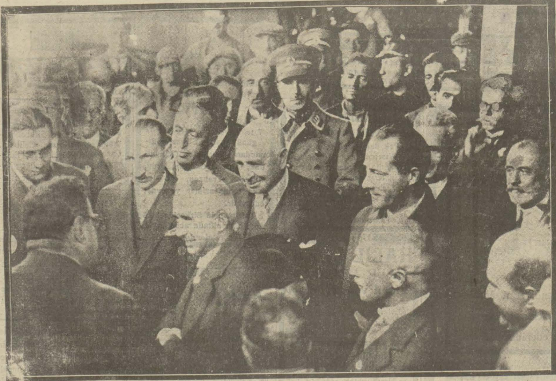
İsmet Paşa Hz. dün akşam treni mahsusla Ankara'ya gitmişlerdir. Resmimiz teşkil merasimine ait bir intibadır.