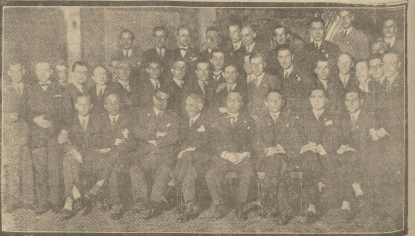
Cümhuriyet bayramı şerefine İstanbul Türk matbuat cemiyeti tarafından Turkuvaz salonunda matbuat erkân ve azasına bir çay ziyafeti verilmiştir