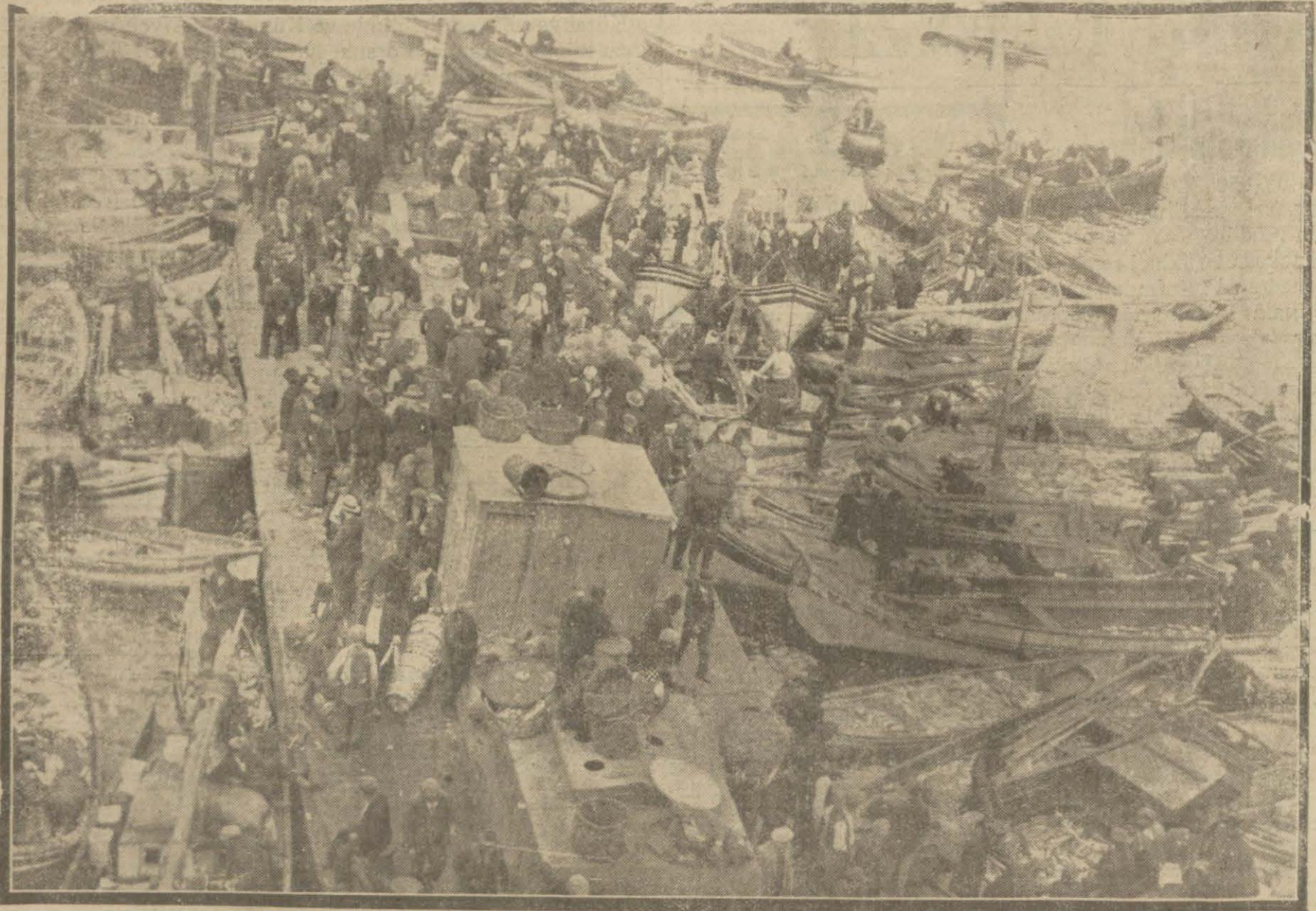
Dün Balıkhane'de şimdîye kadar nadiren görülen bir vaziyet vardı. Denizden altıyüzbin çift palamut çıkarılmış, nişçileri bulmaamağı için bu miktarda mühim kısmı denize dökmüştür.