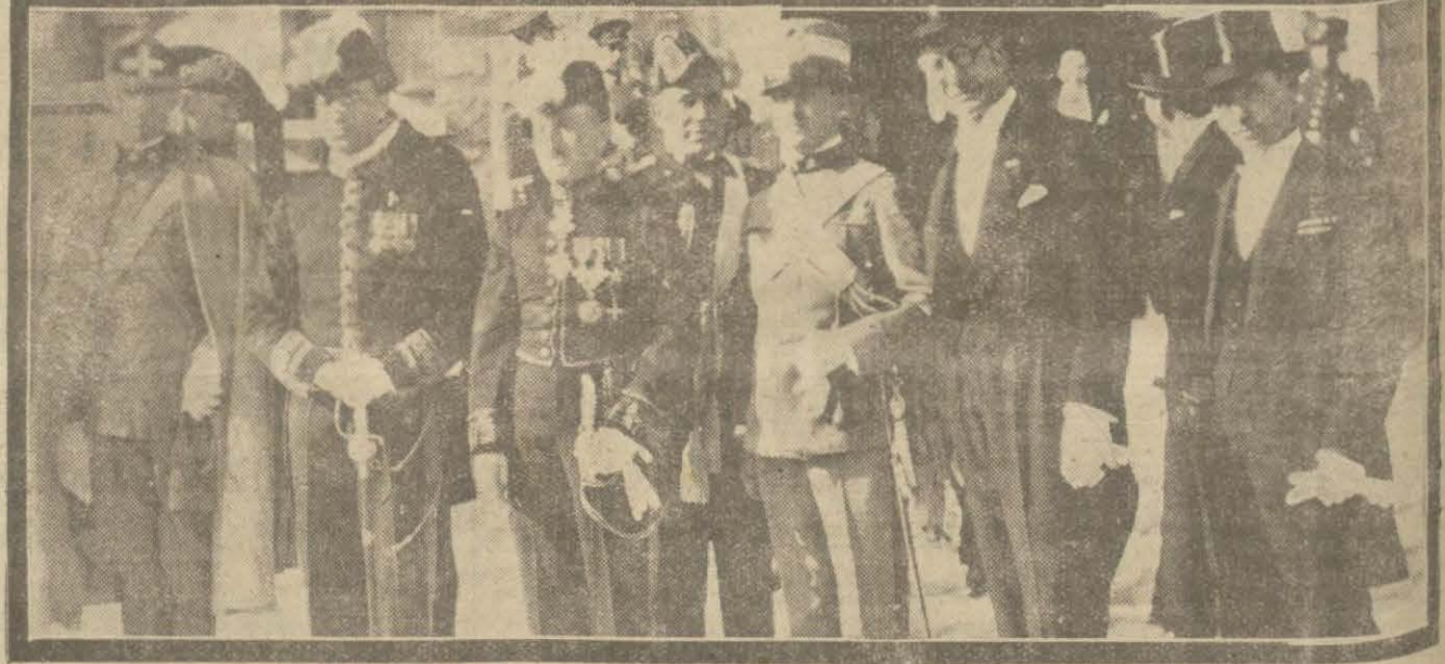
Cümhuriyet bayramı bilhassa Ankarada büyük bir tezahüratla tes'it edildi. Resmimiz bu merasimden iki intiba göstermektedir.