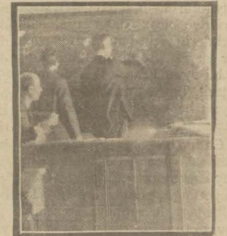
MÜHİM BİR TAMİM

4 seneden beri görülmiyen bu balık bolluğunun sebebi, palamutların kışlamak üzere Karade-