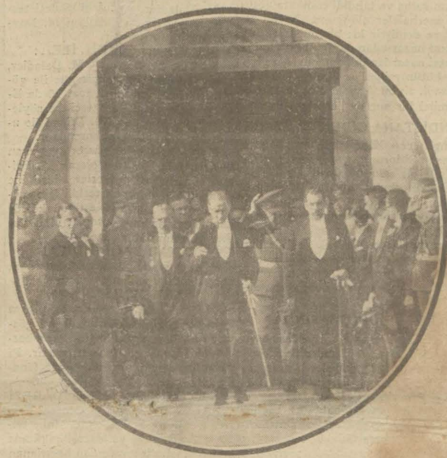
Reiscumhur Hz. Büyük millet meclisinden çıkarılarken

Bu sırada Vilâyette resmi ka bul hazırlığı başlamıştı.