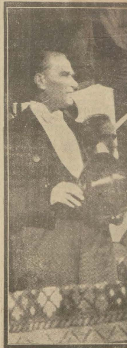
Gazi Hz. geçit resmini seyrediyorlar

Bunu müteakip sıra ile şehri mizdeki Maliye, Mülkiye, Adliye memurları ve sair vekâletle-