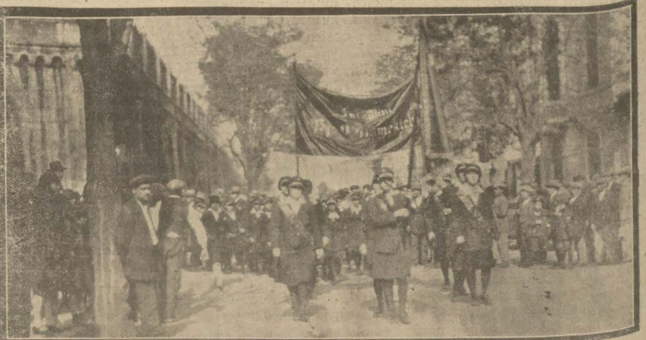
Cümhuriyet bayramına iştirak eden mekteplerden İstanbul kız, erkek muhtelit mektebi talebeleri merasim esnasında