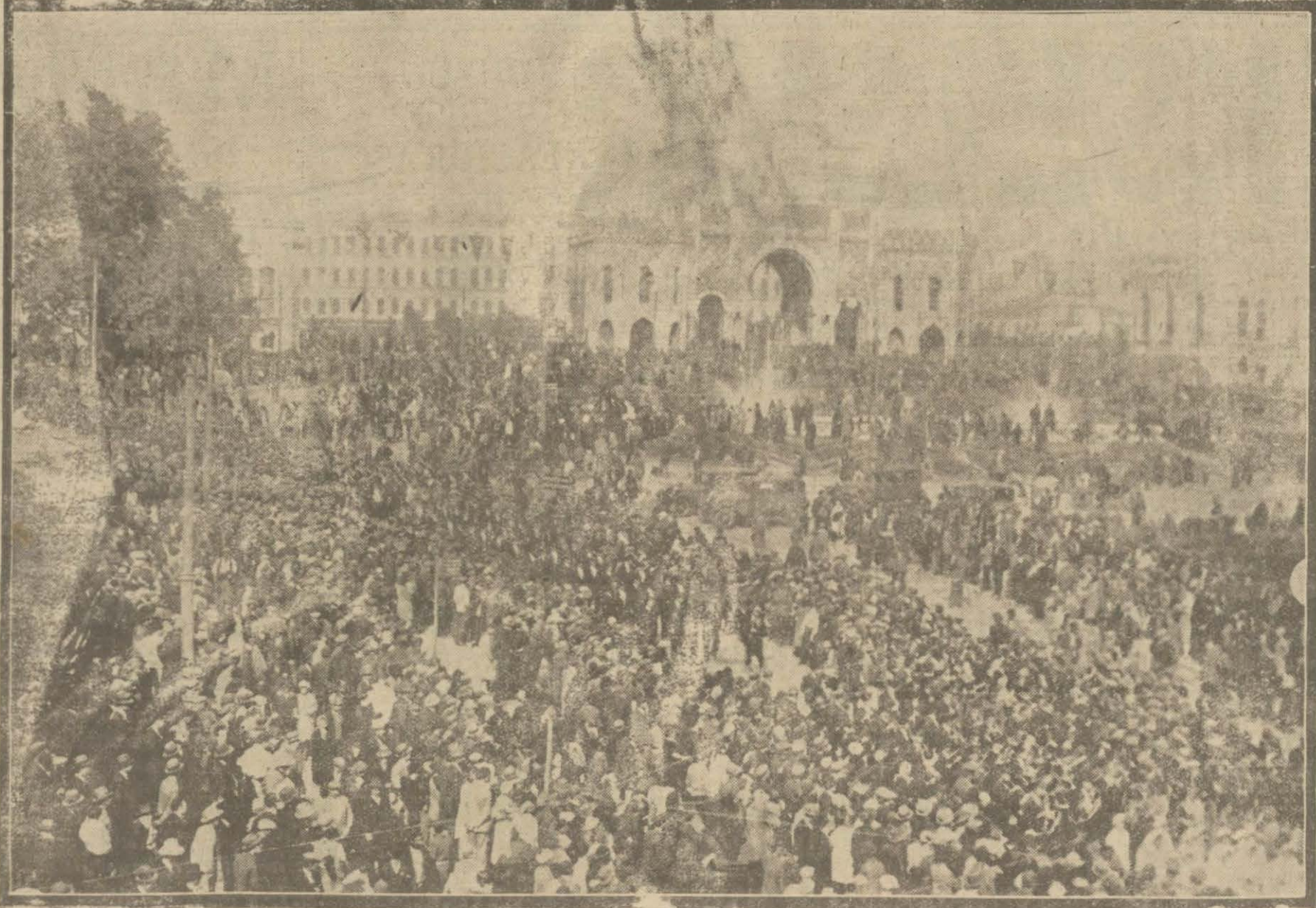
İstanbulda Cümhuriyet bayramı parlak bir surette tes'it edildi. Resmimiz Beyazıt meydanını dolduran halkın tezahüratını gösteriyor.