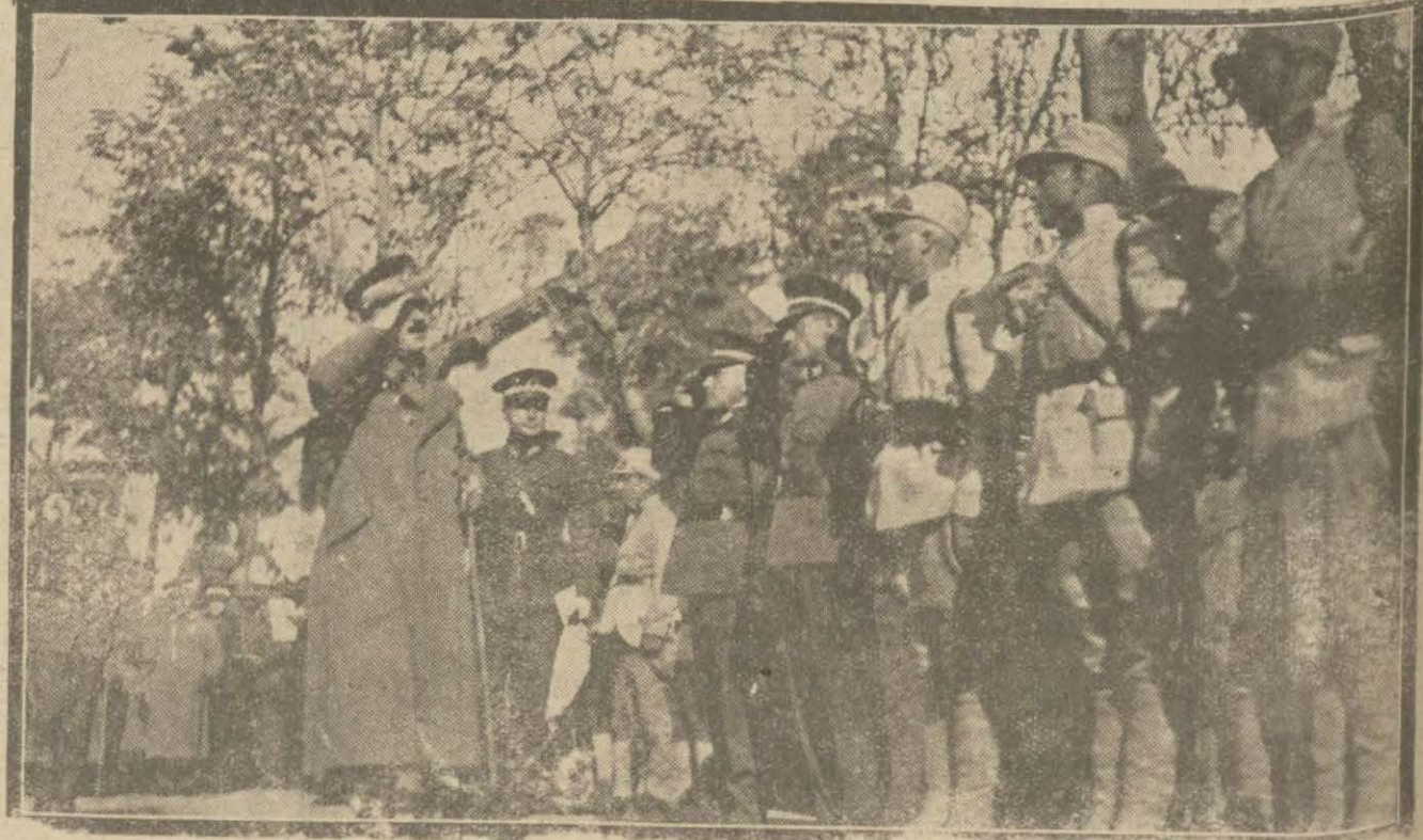
Erkânı harbiye ve umumiye reisî Fevzi Paşa nazretleri Ankarada i'tikbat edilirken...