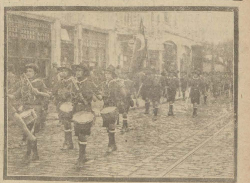
Ankarada geçit resmine iştirak edecek izcilerden.

Bu kurnaz Rum ilk vapurla Yunanistan'a gönderilecektir.