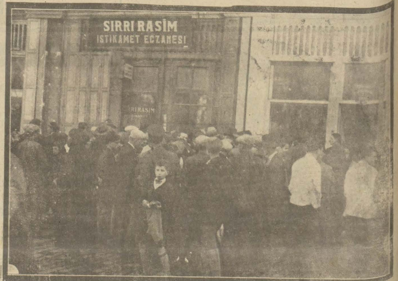
Dün Çenberlihtaşa bir otomobil faciası olmuştur. Facianın kurbanı olan kadıncığızın nakledildiği eczahane önünde biriken halk.

İstanbul mahkemesi asliye 3 üçüncü hukuk dairesinden: 929/1004