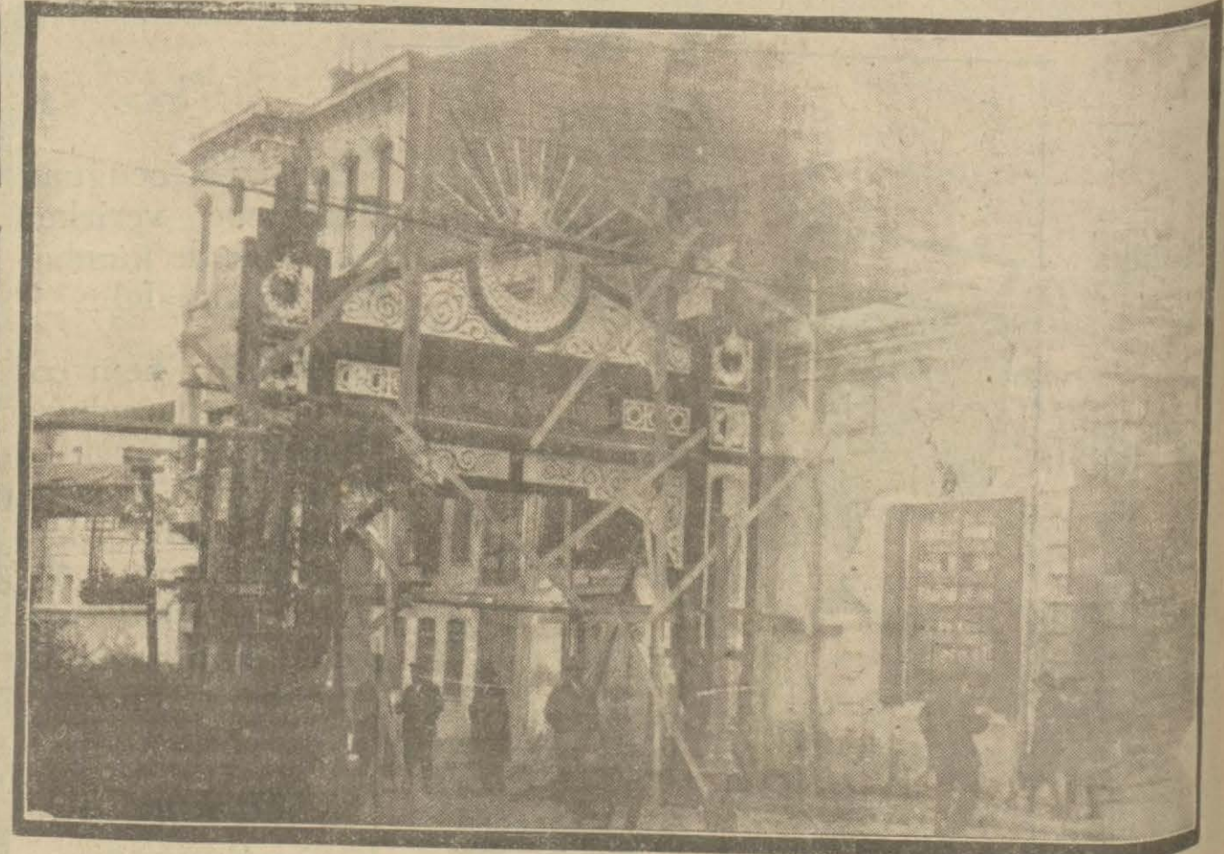
Cumhuriyet bayramı yaklaştığından şehrin her tarafında taklar kurulmaktadır. Evkaf müdürlüğü bünyesindeki tak.