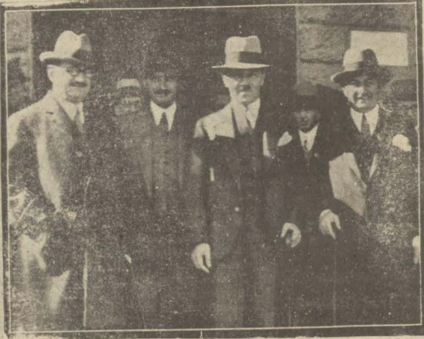
Maliye vekili Saracoğlu Şükrü Bey Ankara'da samimi bir surette karşılanmıştır.