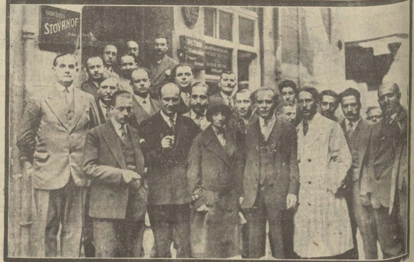
Dün dış tabipleri cemiyet merkezinde gürültülü bir içtima yaptı ve Sıhhiye vekili Reşik Beyin riyasetteah affına karar verdi. Yeni idare heyeti de tothap edildi.