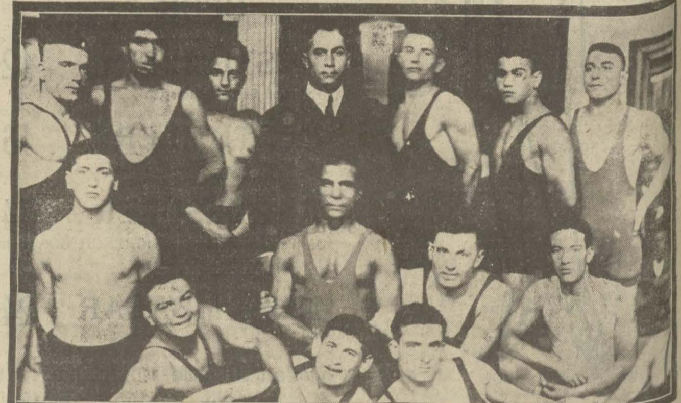
Mıntaka güreş teşvik müsabakalarına dün Beyoğlu C. H. Firkasında başlandı. Müsabakalara iştirak eden güreşçiler.