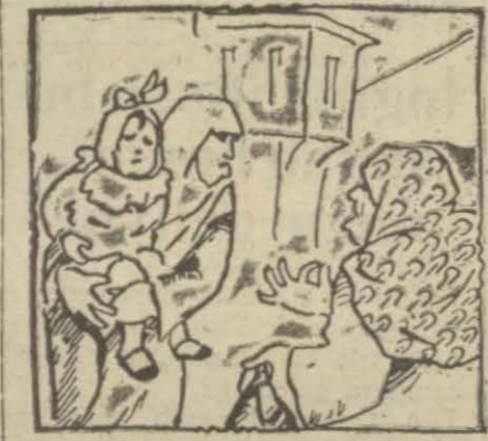
İlahi kardeş olan kolajı var.

Sonra Nureddin tekkesi sokağı gördünüz ya, adeta gecilemez bir halde. Hala iç sokak-