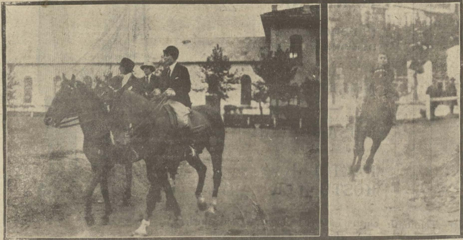
Dün Sipahi ocağında amatörler arasında müsabakalar yapıldı. Bu müsabakalara beş hanım ve on yaşında bir küçük çocuk ta iştirak etti. Müsabakalar çok heyecanlı olmuştur.