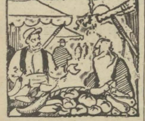
Dört ok kabağımız ne etti?

— Bir gün de diyordun, çarşamba taraflarını dolaşsanız! Muhterem okuyucuma gös- terdiği alâkadan dolayı burada teşekkür ederim. Sim