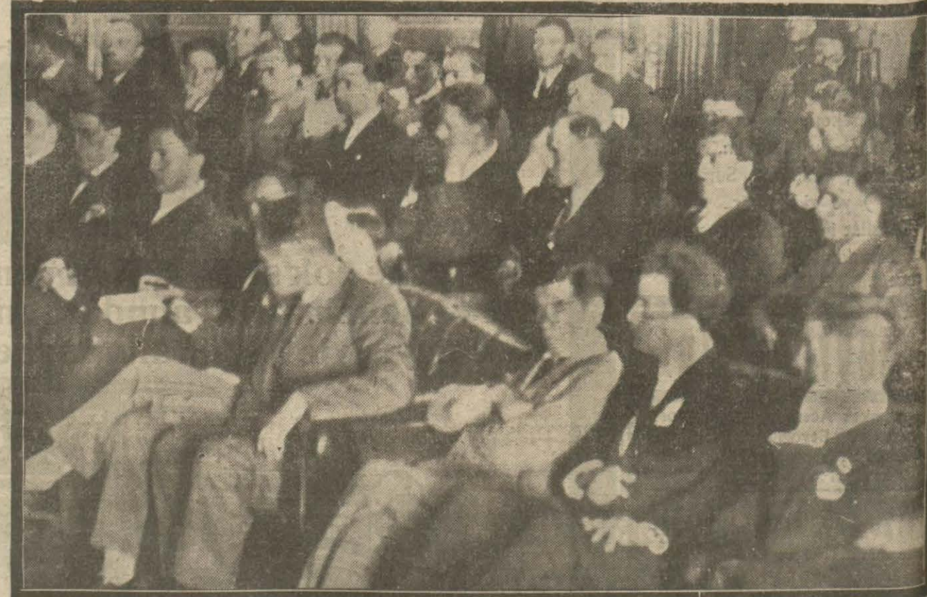
Dön Balkan talebe kongresi Darülfünunun merasim salonunda yapıldı ve 20 mura'has iş irak etti