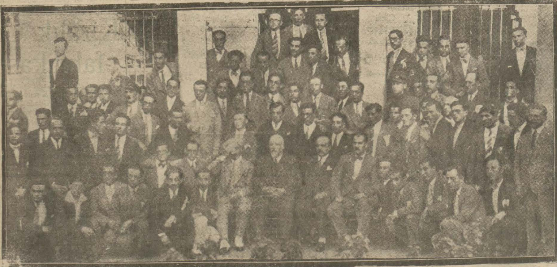
Dön Darülfünun gençliği Türkocagında toplandılar ve bazı matbuatta millî şair ve nasirlerimizden bazıları aleyhine yapılan neşriyatı protesto ettiler