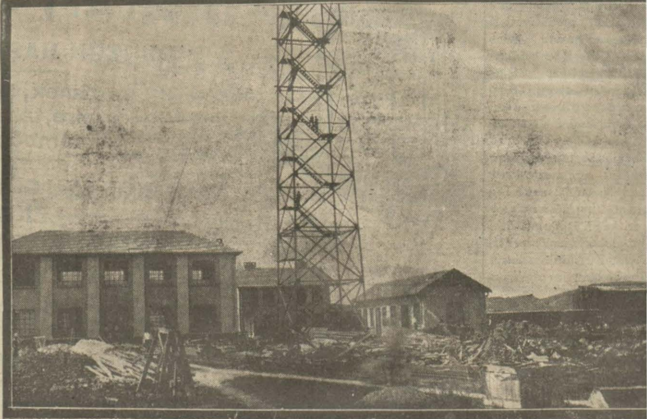
Yeni Barut inhisar şirketinin Silihlar ağada yaptırdığı fabrikalardan biri