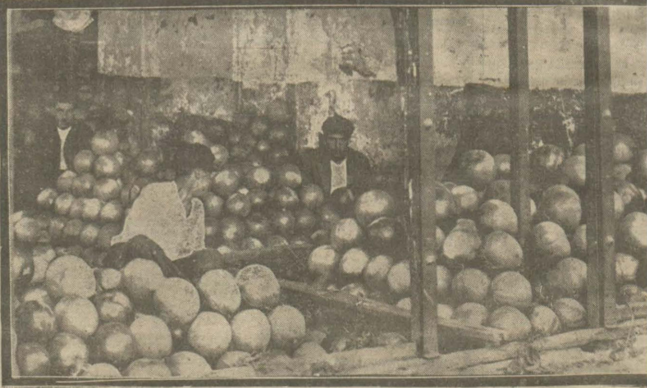
Henüz fazlaşmamış olan karpuz sergilerinden biri