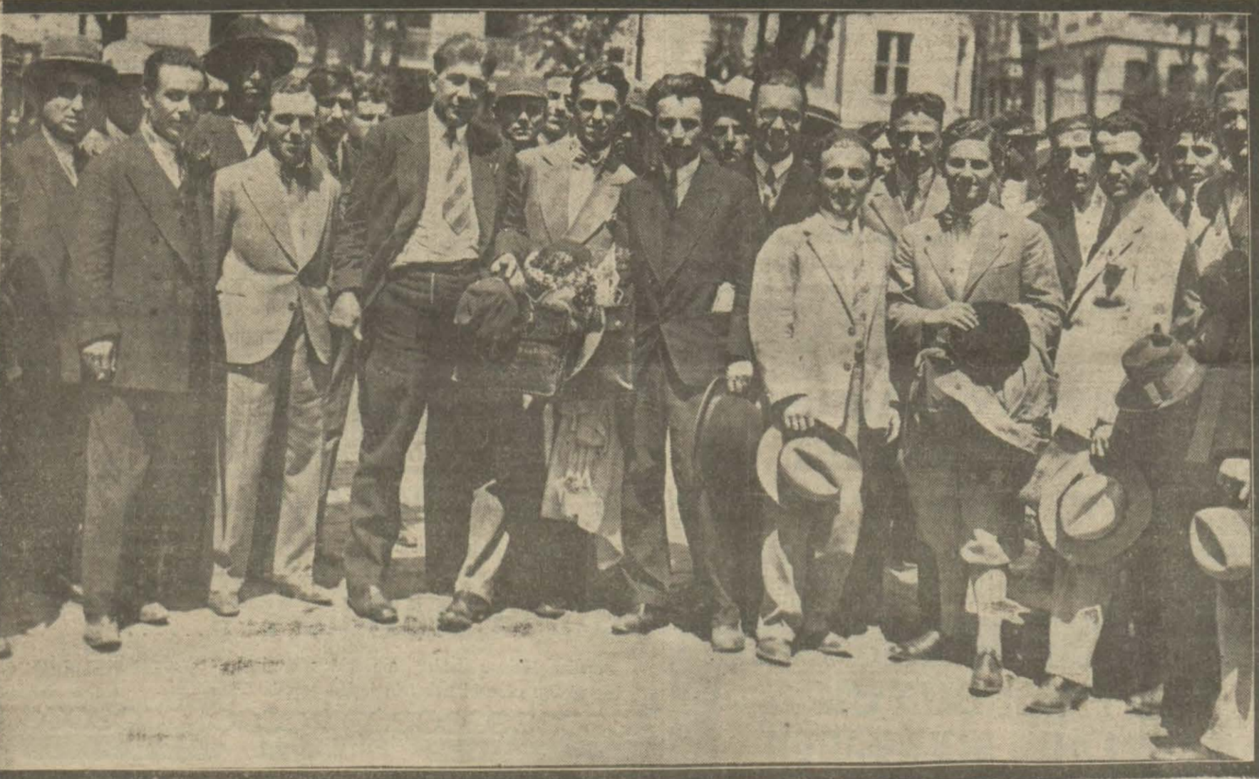
Balkan talebe birliği kongresi murahhaslarından bir kısmı dün şehrimize gelmiş ve parlak bir surette istikbal edilmişlerdir.