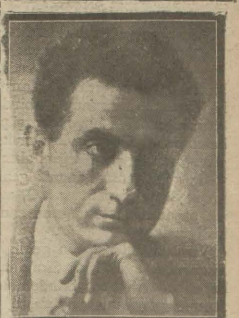
Faruk Nafiz Bey

Birini ötekine tercih etmenin imkânı yoktur