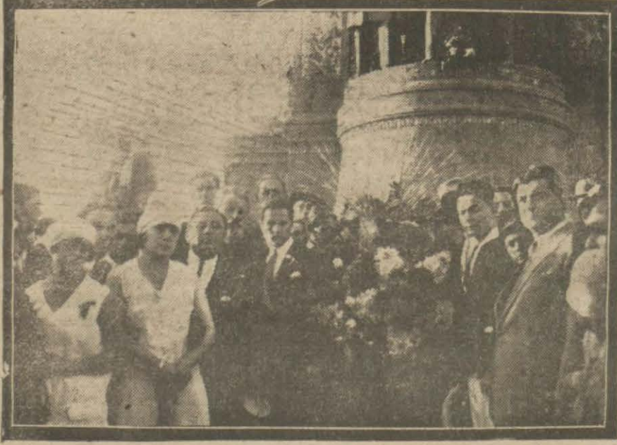
Romanyalılar dün Cumhuriyet abidesini ziyaret ettiler ve bir çelenk koydular.