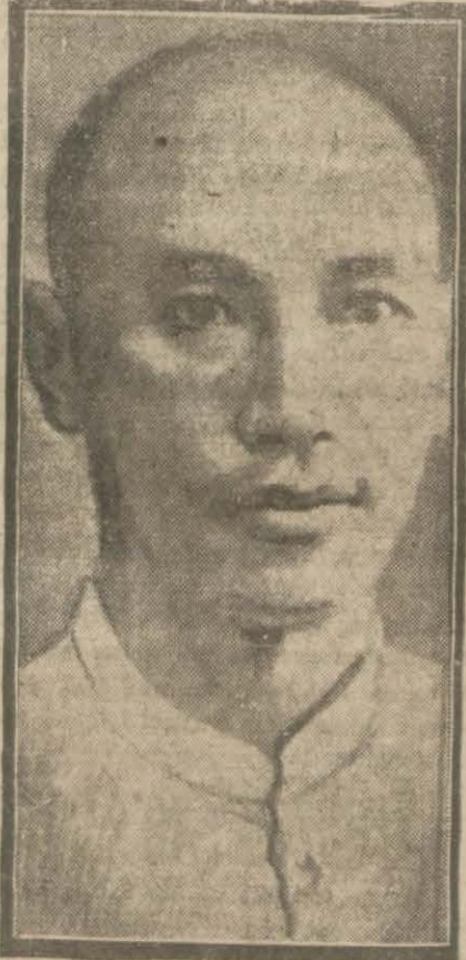
Çin Reiscumhuru Çan-Kay-Sek

Nankin, 16 (A.A.) — Sovyet ultimatomu dün Chiang kışek e takdim edilmiştir. Nim resmî bir habere nazaran Çin'in şark tarafındaki demir yollarının şark kısmını takviye etmek üzere o taraflara 5000 Çin askeri gönderildiği gibi huduttaki Manchuli şehrine de 10000 kişi sevk edilmiştir. Çinliler Ruslarla burada karşılaşmağa hazırlanmaktadır.