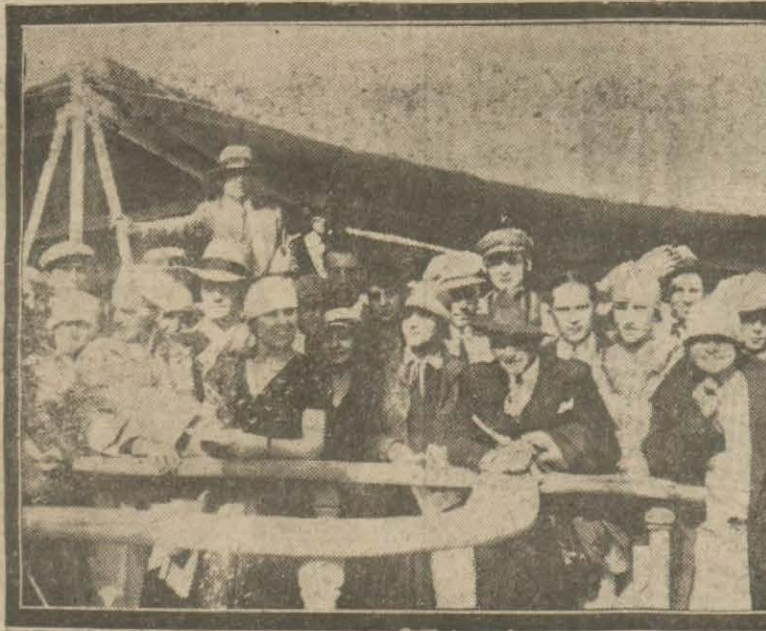
Dün Romen Dartüfünununa mensup 50 talebe 8 profesör ve 2 temyiz reisi şehrimize gelmişlerdir. Romenler Galatasarava misafirdirler.