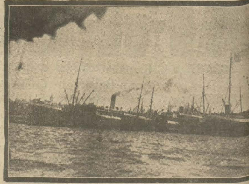
Seyrisefain idaresile Millî vapurcular ihtilâfi tetkik olunuyor. Bu ihtilâfınımızdaki Türk vapurları görülmüyor. Yazısı iç sahifemizde.