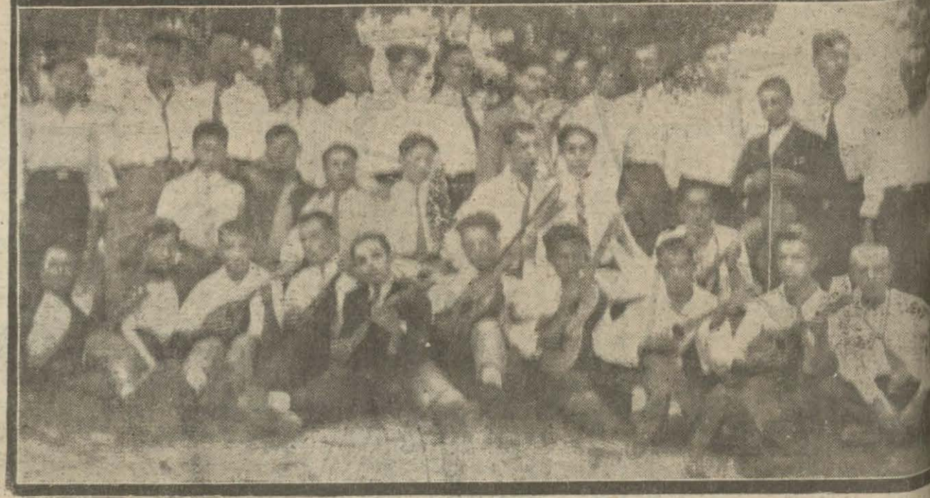
Garbi Trakya - İskeçedeki türk gençleri bir musiki birliği tesis etmişlerdir Bu resim birliğin kür gezintisine ait bir intibaini gösteriyor