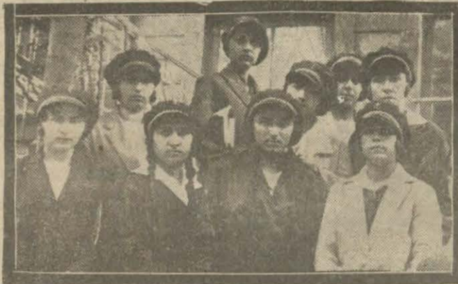
Bu sene Feyzli kız lisesinden çıkan talebe