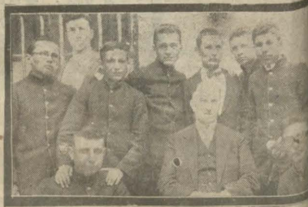
Resimde bu sene Darüşşefekadan çıkan talebe görülüyor