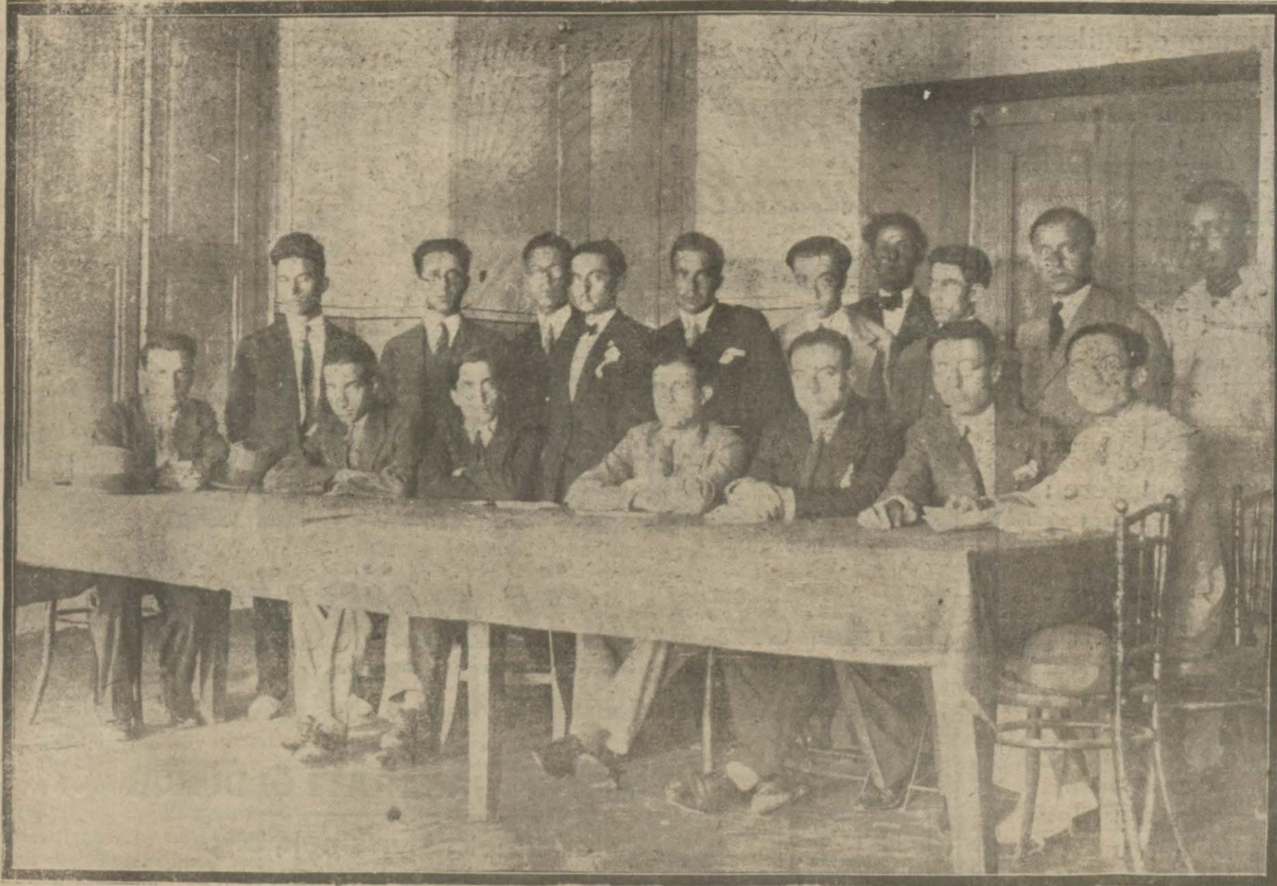
Dün Darülfünun Hukuk Fakültesi talebe cemiyeti bir kongre akdederek bazı hususat hakkında konuşmuşlardır. Kongre yazısı iç sahifemizdedir.