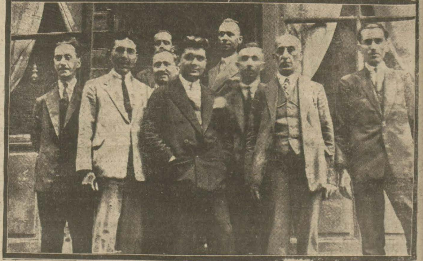
Telgraf memurları dün bir içtima aktederek mesleke ait bazı hususlar hakkında görüşmüşlerdir.