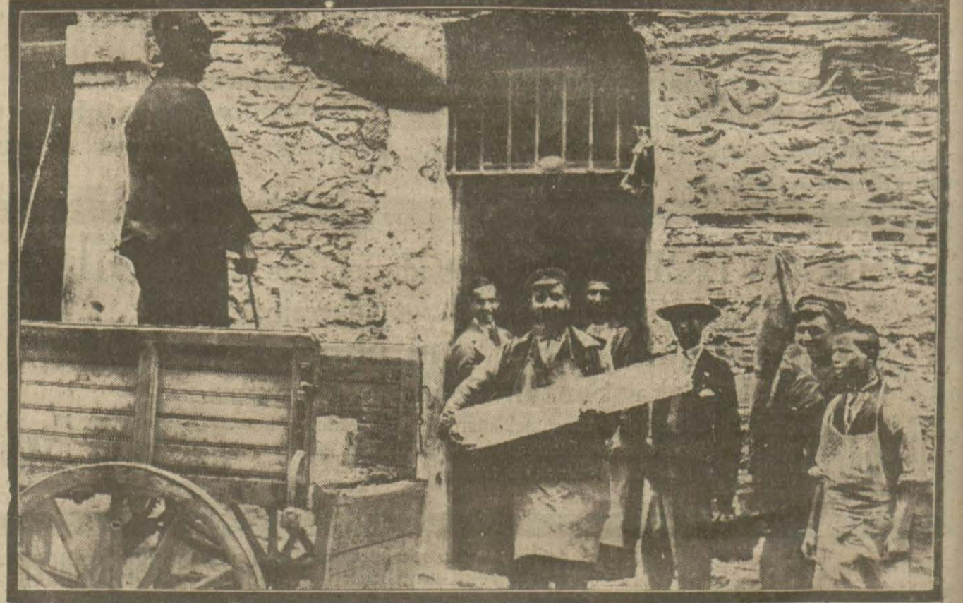
İki fabrikanın yekdiğerine rapu ameliyesi yüzünden iki gündür güçlükle buz tedarik edilebilmiştir. Bu gün halli tabii aydet etmiş olacaktır.