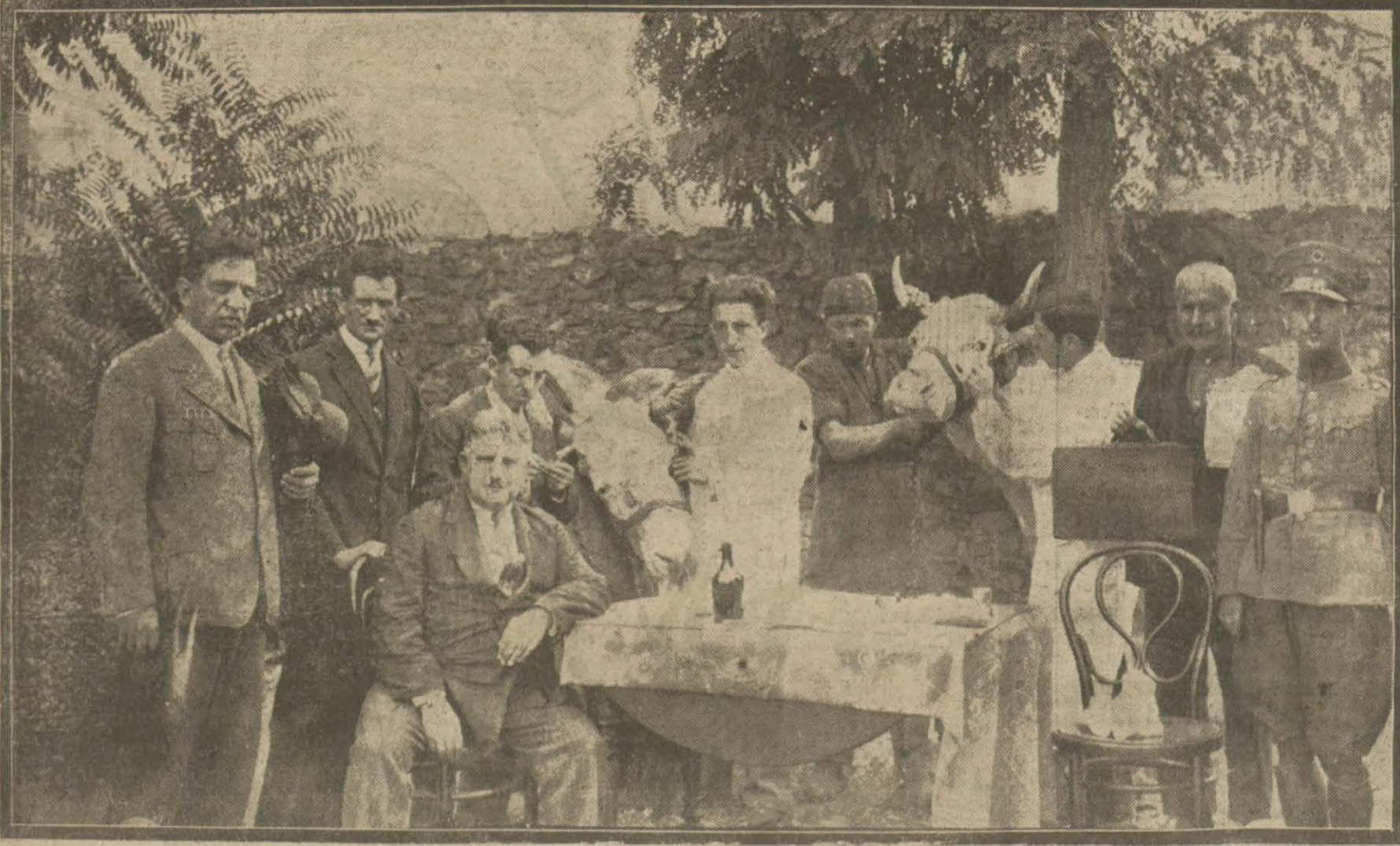
Dünden itibaren verimli ineklere verem aşısı tatbikatına başlanmıştır.