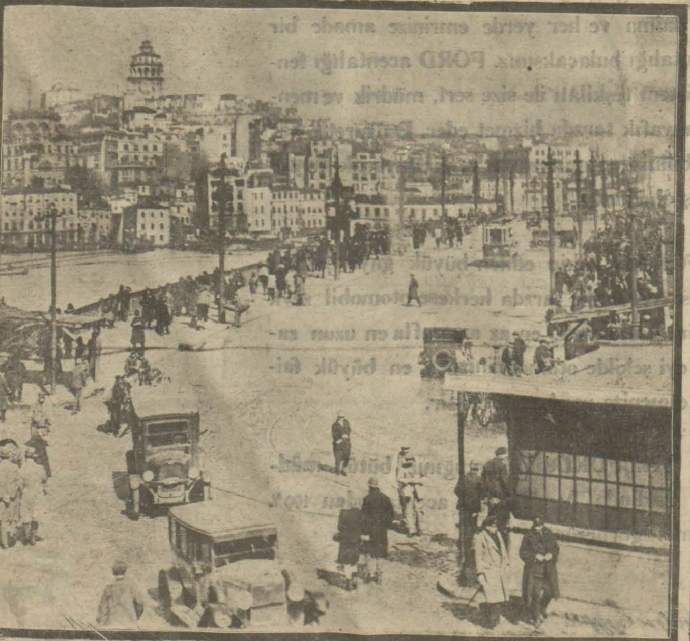
Günlerdenberi kar, tipi, sis, duman altında kalan İstanbul nihayet kıştan kurtuldu. Dün hava güneşli ve çok güzeldi.