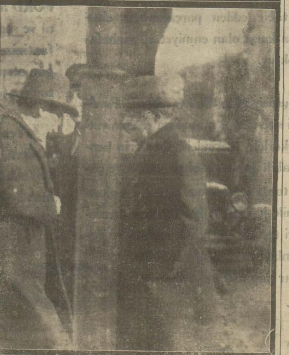
Cemiyeti Belediye dün son içtimamı aktektmiştir. İçtimadan sonra azalar Şehremaneti binasını terkederken.