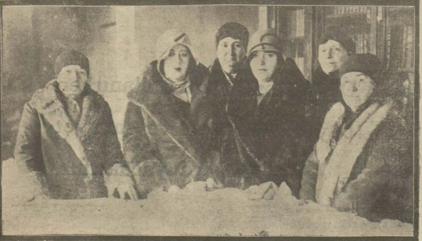
Türk kadınları Esirkeme derneği tarafından Türk ocağında bir sergi açılmıştır. Sergide kadın işleri gösterilmektedir.