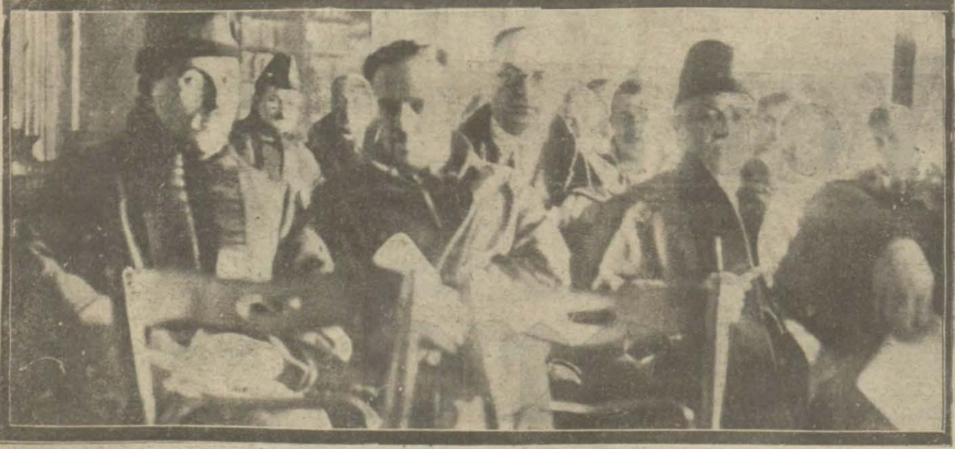
Baro heyeti umumiyesi dün bir içtima aktederek münhal meclisi inzibat azalarını intihap etmiştir.