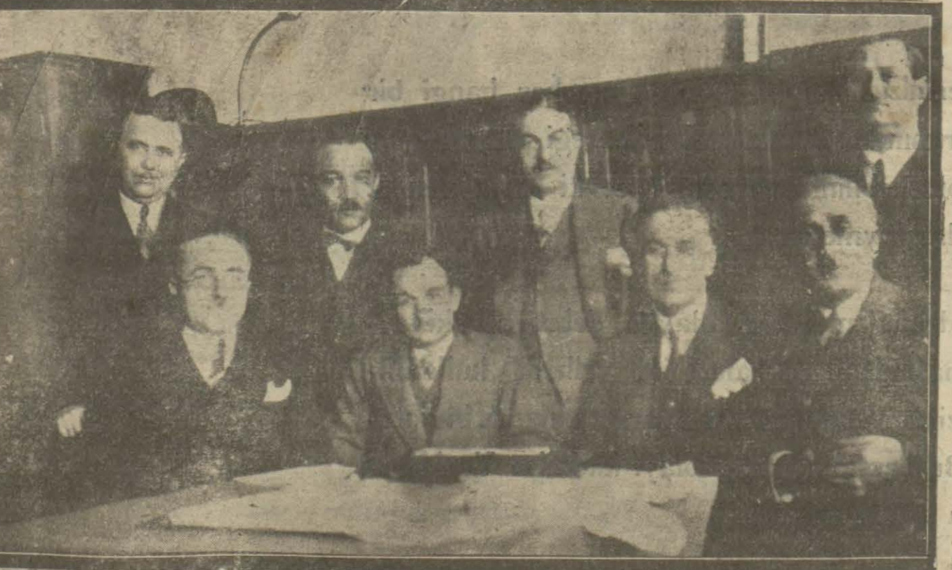
Üsküdar - Kadıköy ve temidli halk tramvayları heyeti idaresi dün bir içtima aktektmiştir.