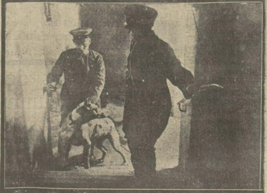
Almanya'da hırsız takibinde polisler köpek kullanmaktadırlar. Köpekli polisler hırsız peşinde.