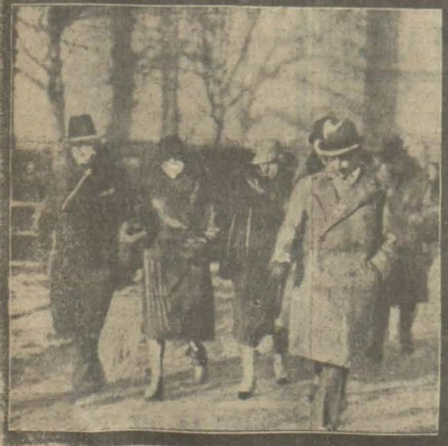
Dün akşam limanımızda küçük bir cevalan yaptıktan sonra avdet eden Pensilvanya ve Puruvians vapurlarına şehrimize gelen seyyahlar.