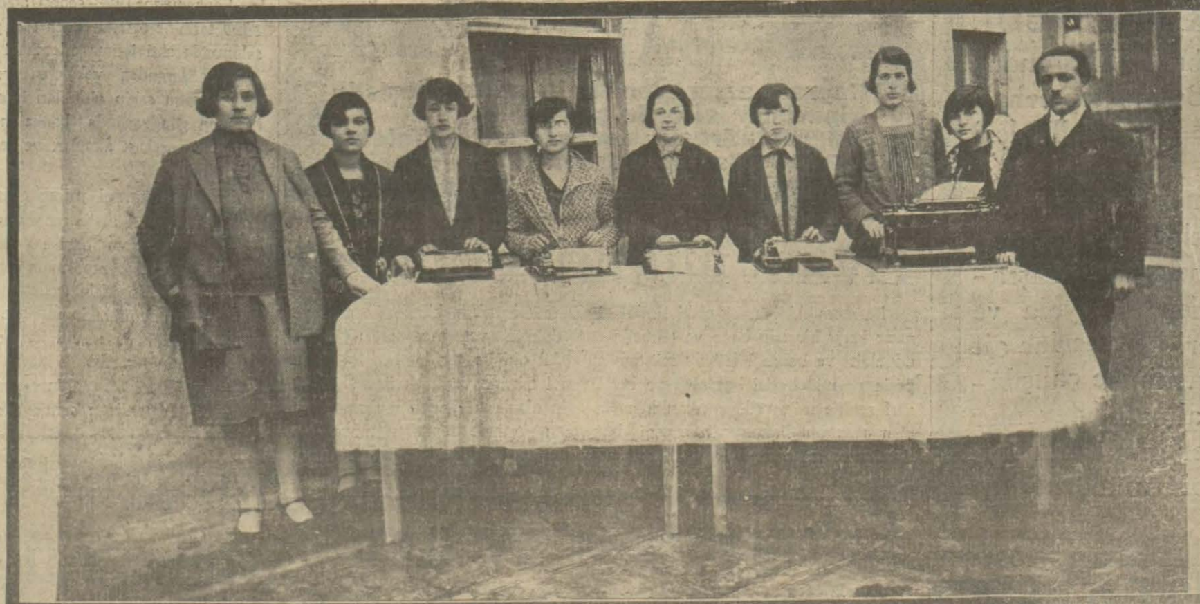
İzmit memleketimizin diğer mütakamil aksamında gösterilen hummalı faaliyetler gibi tekâmüle doğru büyük adımlar atmaktadır. Burada bir daktilo kursu açılmıştır. Kurstan ilk çıkan hanımların resimlerini dercediyoruz.