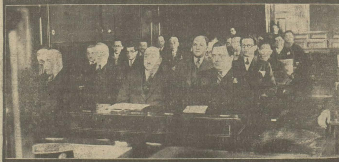
Dün ticaret odası senelik üçüncü kongresini aktetti. Reis vekill'ği ile Sanayi ve ticareti bahriye raporları müzakere edilmiştir.