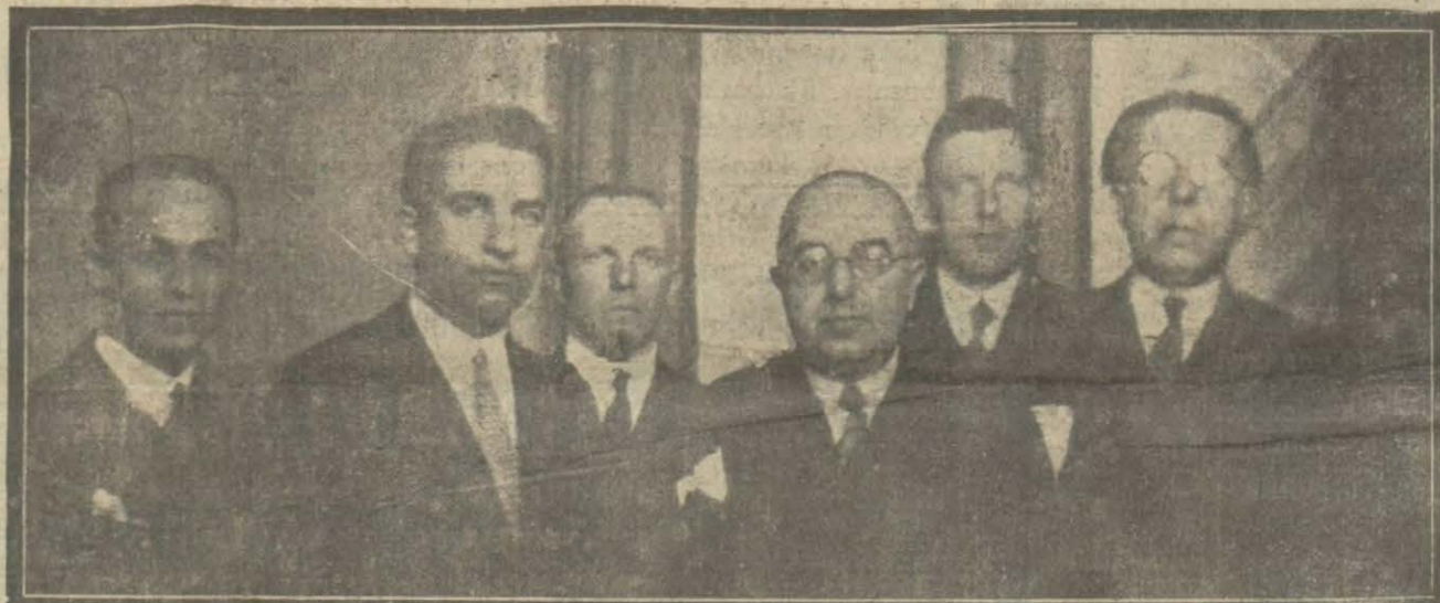
Tohum ıslah istasyonları müdürleri iktisat vekili Rahmi beyin riyaşeti altında içtima etmiştir.