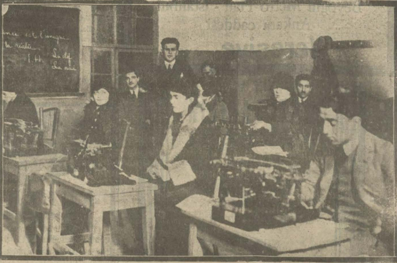
Galata Saray Lisesinde bir daktilo kursu açılmıştır. Buraya oir çok hanım ve beyler devam ediyorlar.