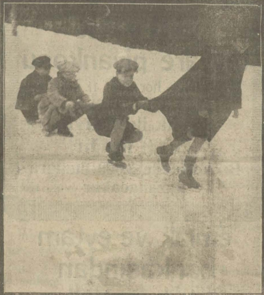
Dün de tek tük kar serpintisi oldu; fakat hava soğucu. Şehremaneti tanzifat ameliyesi yolları temizlemek için çalıştı. Kardan korkmayan çocuklar da oyunların devam ettiriler.