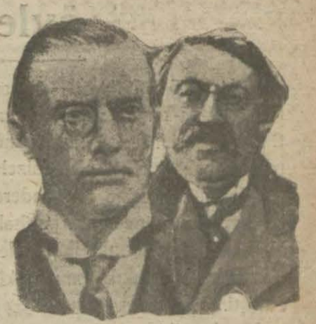
Hangisinin biri birinin cebinde olduğu uzun bir nutka vesile teşkil eden M. Briand ve Sir Chamberlain

İşbu sir bir ecnebi devlete veya onun memurlarına ifşa olunmuş ise failin göre-