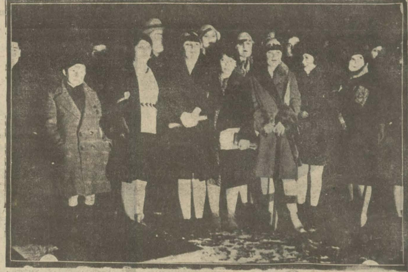
Beyoğlu Millet mekteplerinde faaliyetler devam etmektedir. Bu resimde senenin mezun hanımları görülüyor.