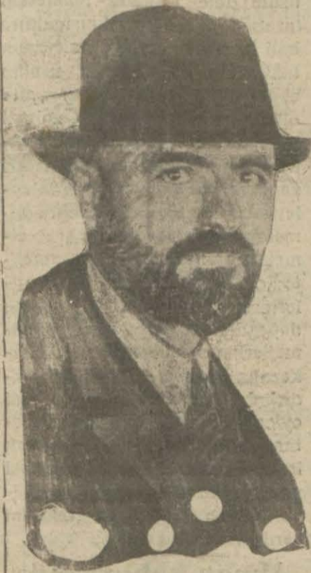
Fatin Bey haket arasında iribat tesis edilmiştir.

Büyüklerdeki bentlerde sokukların temadisinde çatlaklar hasıl olmuş ve bu vaziyet bir hafta devam ederse Takvim suyu kesileceği anlaşılmıştır. Bazı telgraf hatlarında arızalar tamir edilmiş İstanbul ile mü-