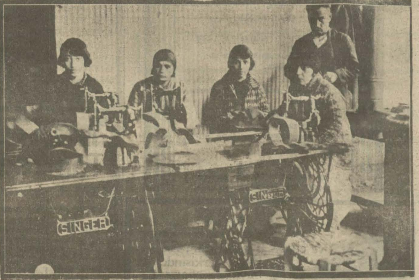
Cumhuriyet Halk fırkasının açtığı kadınları çalıştırma yurdu yeni imalatâneler açılıyor. Burada şapkada imal edilmektedir.