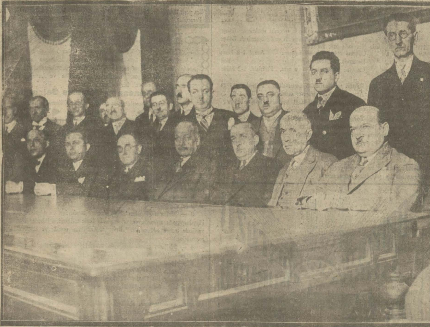
Vilâyet Umumi meclisi Cumhuriyet Halk Fırkası grubu dün içtima etmiştir. Vilâyet Meclisi 2 martta toplanacağı cihetle ikinci reis namzedi ve encümenler azası tespit olunmuştur.