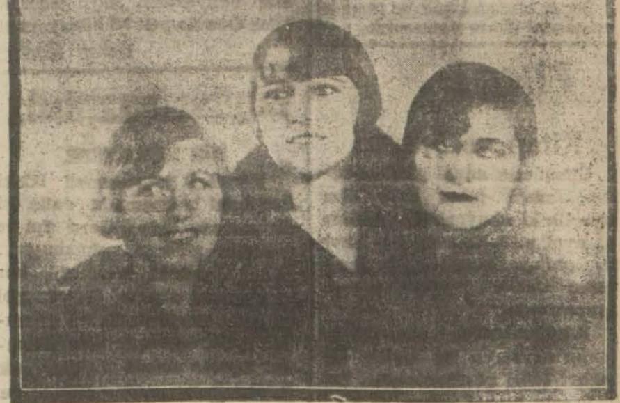
Ankara barında üçler

Ankarada kış nasıl geçiyor? İstanbul kar tipisi içinde bunalmış iken Ankara binnisde bahar içinde yaşıyordu