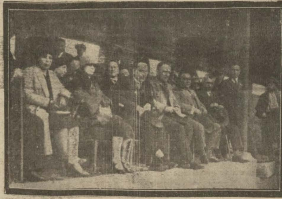
Çocuk bayramı münasebetile Balıkesir idman yurdu ile Aefa kulübü siporcuları balıkesirde bir maç yapmışlardır.