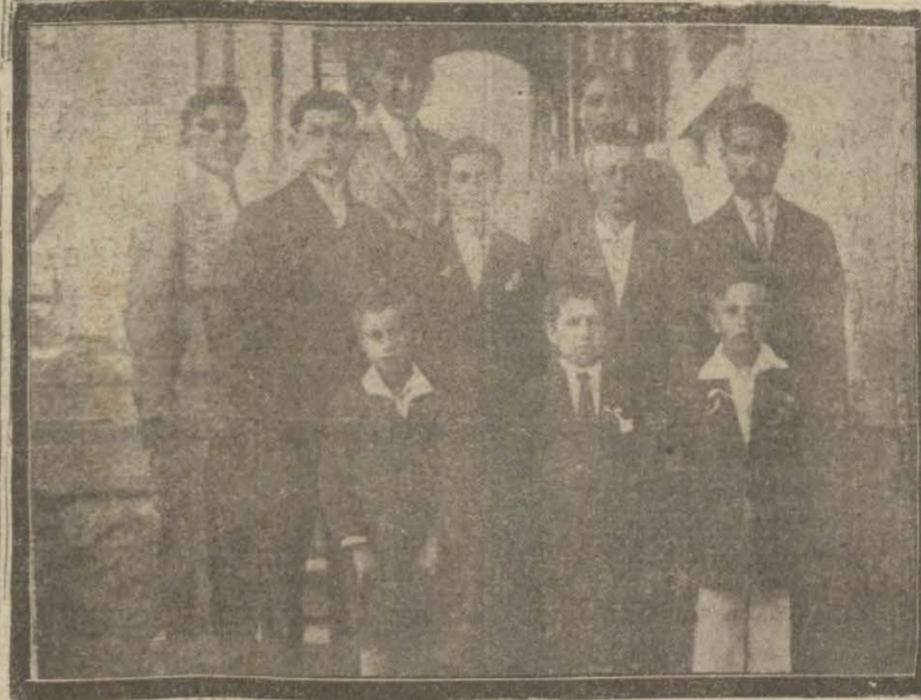
Çocuk bayramı münasebetile Kasımpaşa üçüncü mektepte bir müsamereler verilmiştir. Müsamerenin heyeti tertibiyesi.