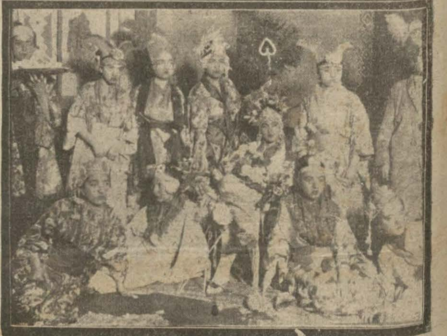
Dün çocuk haftasının son günü idi bu münasebetle Türk Ocağı tarafından Tepebaşı tiyatrosunda bir çocuk müsameresiverilmiştir.