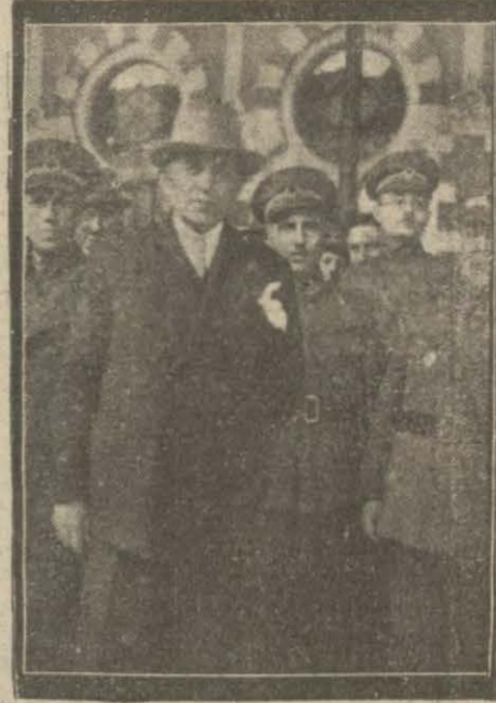
Londradaki askeri sihiye konferansına iştirak edecek olan hey'eti sihiye dñkñ ekspresle barakete almıştır.