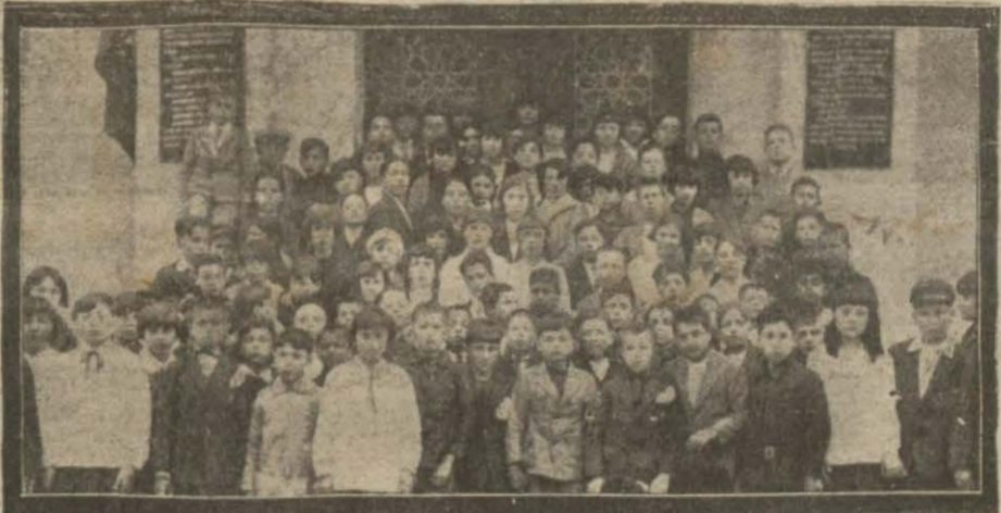
Ankarada çocuk bayramı - Ev sahibi ve uklar bir arada..