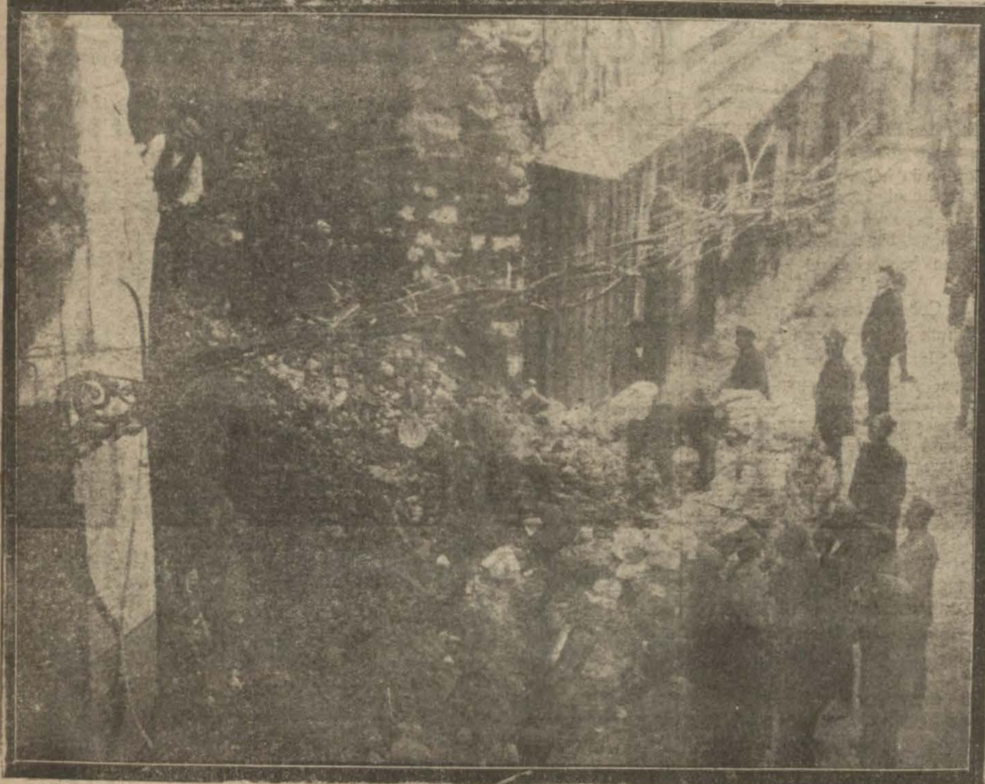
Dün Kapalı çarşıdaki bedestanın kapısı anı olarak yıkılmıştır. İnhidam anı olmuş ve yolun bir kısmını kapamıştır.