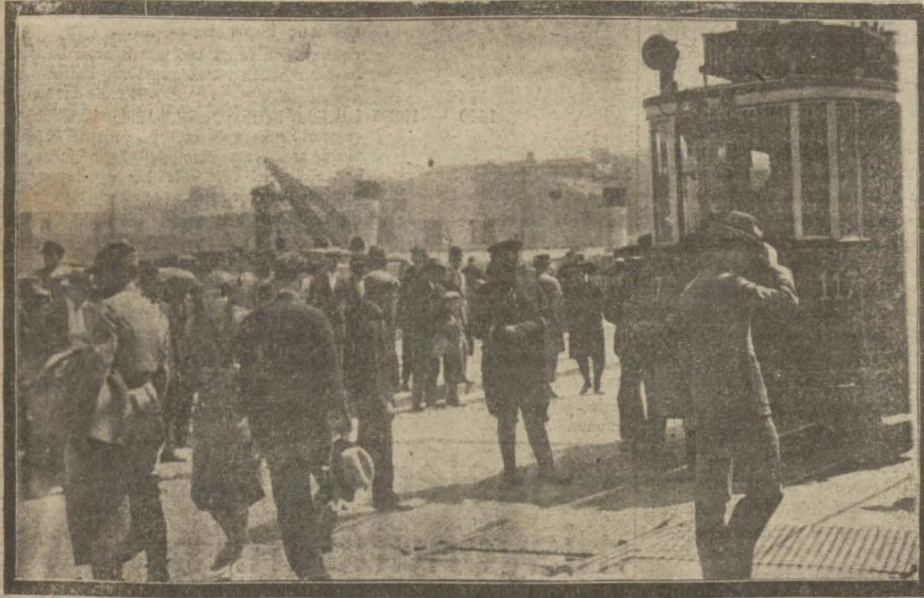
Dñkñ karayel fırtınası köprü'nün demir kapaklarını yerinden kaldırmıştır. Bu yüzden bir müddet tramvaylar işleyememiştir. Kapaklar yakında düzeltilecektir.