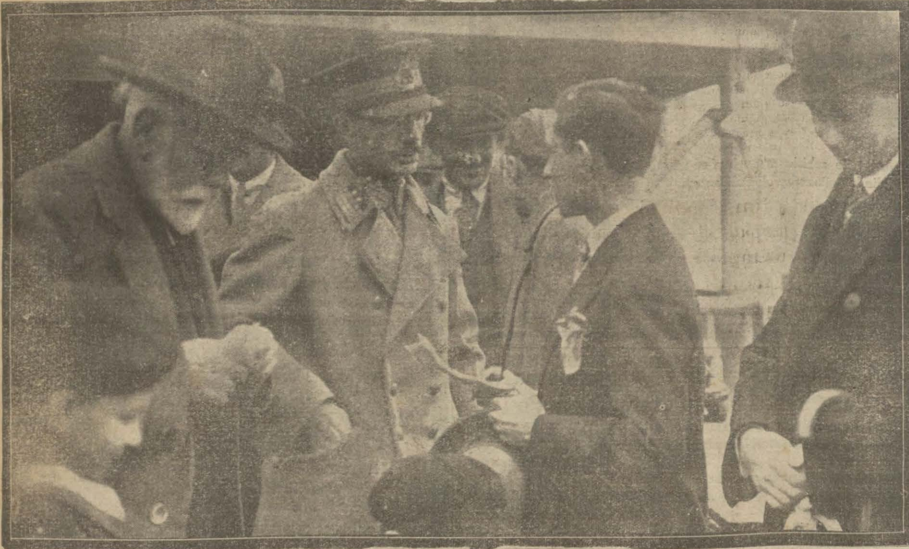
Afganistanda bulunan hey'eti askeriyemiz reisi kâzım paşa dün şehrimize avdet etmiştir