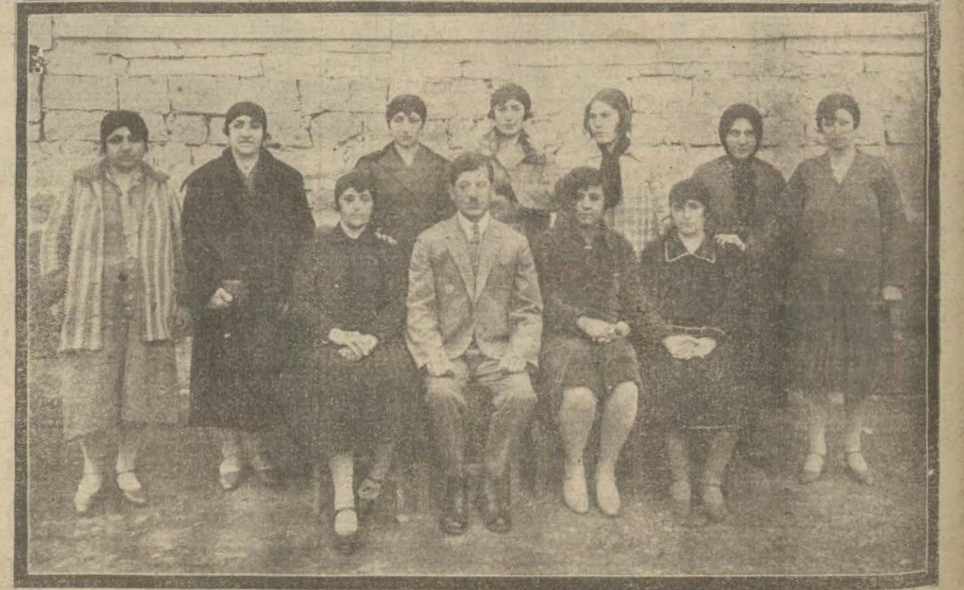
Kayseri Gazi Paşa Millet mektebinden şehadetname alan hanımlar

Fransa Hariciye nazareti ve Türkiye Şehbenderliğince musaddak diplomalarla birinciliği ihraz etmiştir.