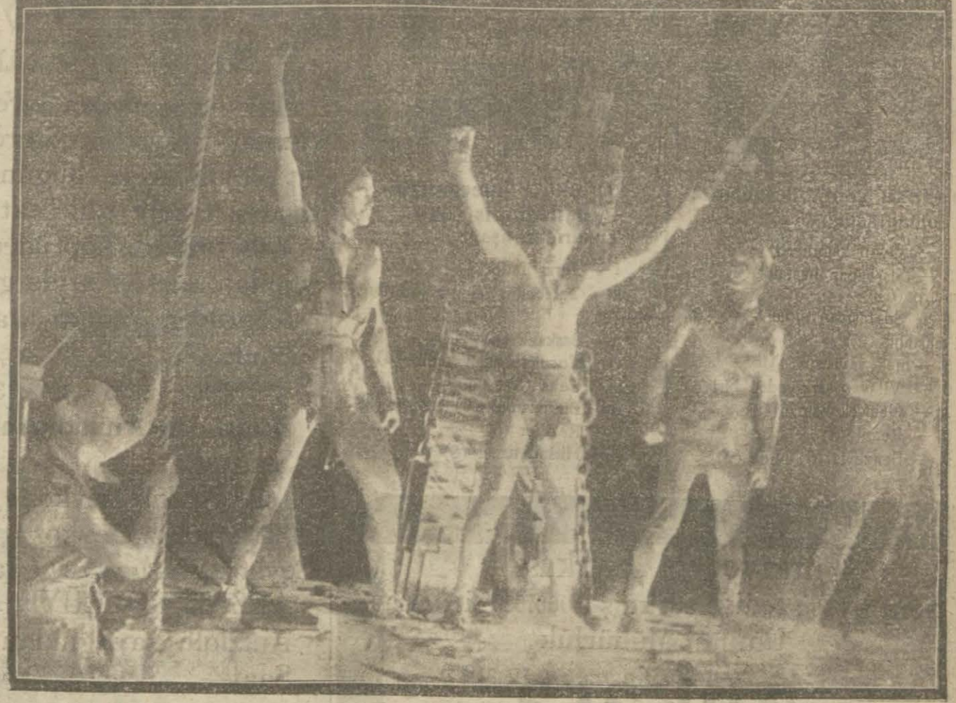
"Serseri şair", filminden

kası kendi akrabalarından bir gence vermek için kaçıyor. Vilon bunu işidince hemen sevgilisinin peşine