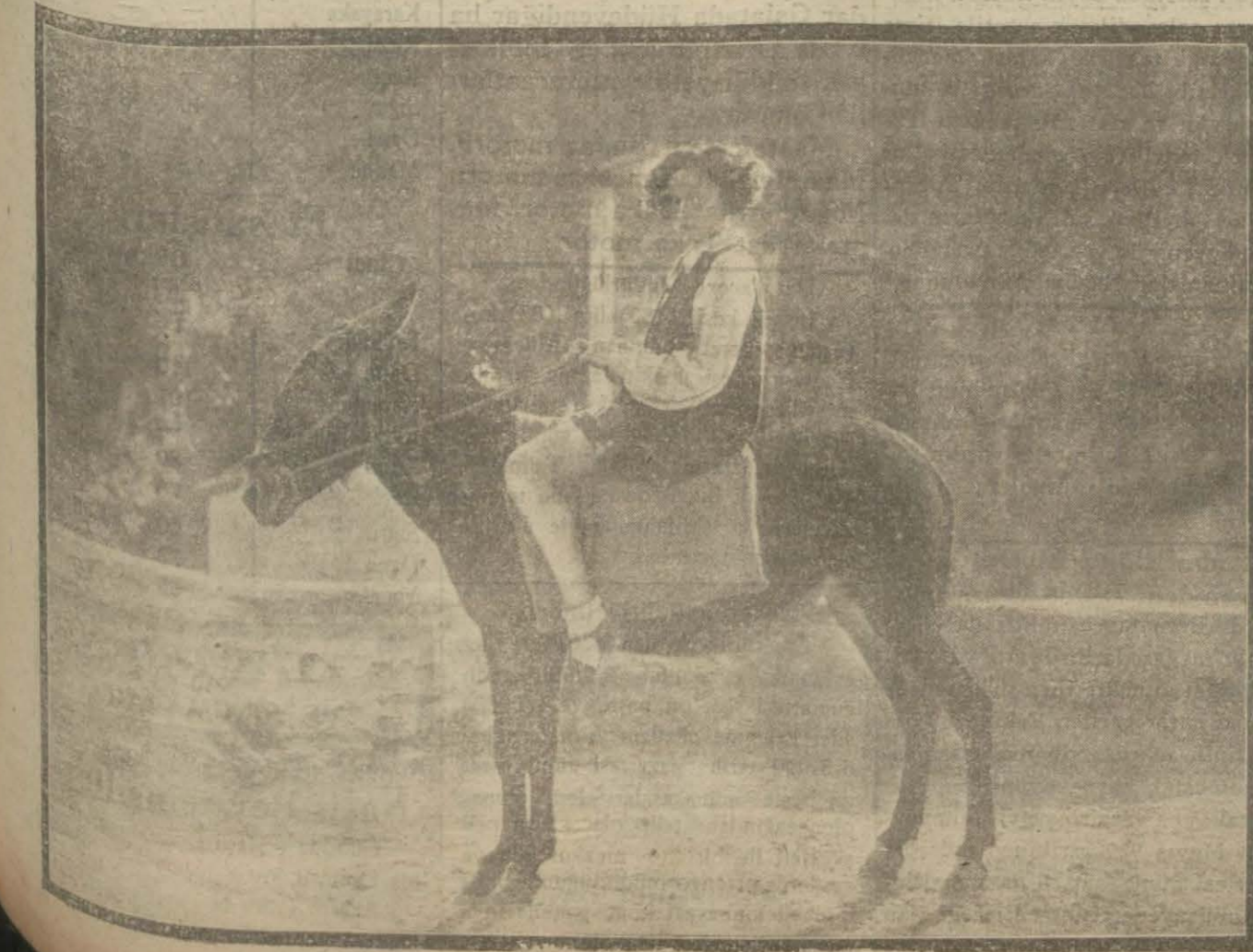
"Floransalı kemancı filminden.

§ Amerika sinema âleminin son ve büyük eserlerinden biri olarak bahsedilen "Nuhun gemisi" isminde ki filmin etrafındayapılan büyük gürültüye rağmen "mütavassıt" bir film olduğu söyleniyor. 7000 figüran muazzam şelâleler azim dekorlara rağmen senaryosunun kıymeti olmadığı ve eserin zamanımıza ait kısmında manasız ve çocukça şeyler olduğu söyleniyor bu eser İstanbul'da gelecek sene gelecektir.