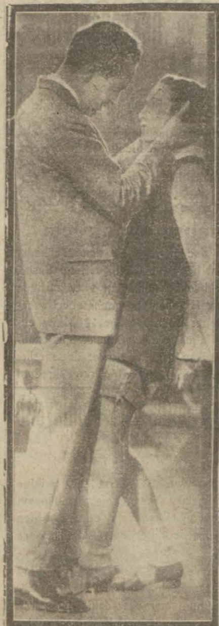
"Floransalı Kemancı" filminden

kiyafetine girer. Yolda kendisine rast gelen bir genç ressam onun model yapmak üzere yanına alır ve yaptığı tablo büyük şöret kazanır. Bir taraftan gencin kız gibi tavurları ressamı şüphelendirirken öteden kızını aramakta olan babası ressamın şöret kazanan tablosunda kendi kızı Reneyi tanır Derhal ressamın materyesine giderek modelin kendi kızına benzediğini söyler. Ressam derhal kızın desti izdivacını ister. Ösra meydana çıkan Rene babasının boynuna atılır, ressam da kızla evlenir.