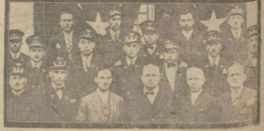
Şimeñdifer mektebinden mezun gençler resimde görülmektedir.