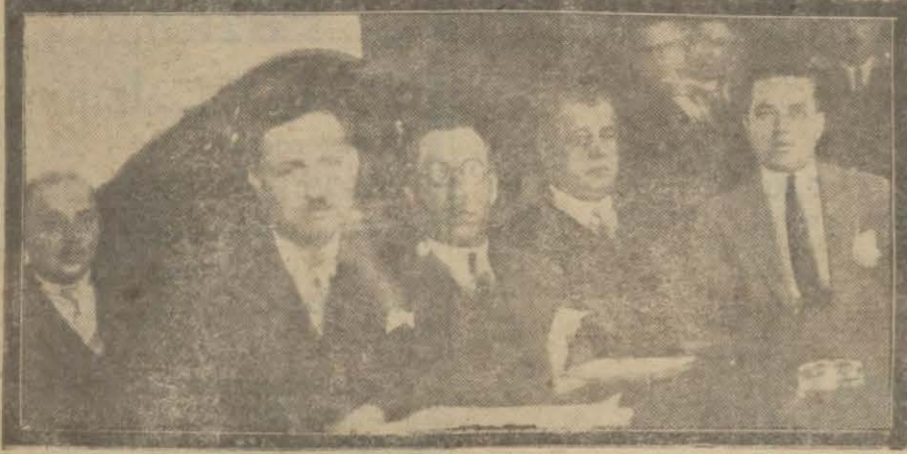
Dün Esnaf bankası hey'eti umumiyesti toplanarak sermayesini (500,000) liraya iblağa karar vermiştir.