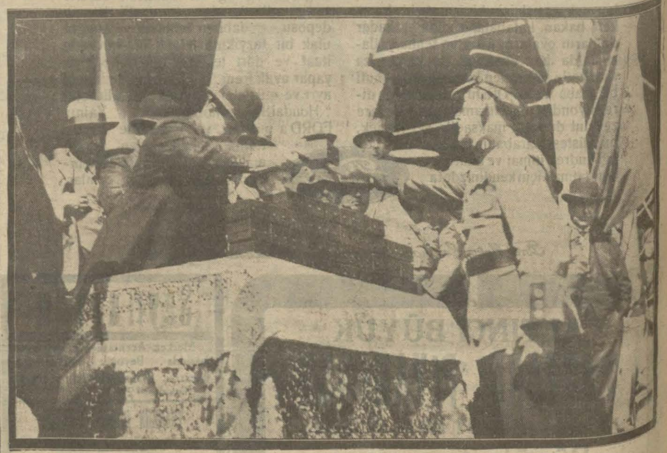
Atış talimlerinde birinci gelen polis memurlarına dün mükâfatları tevzi olunmuş ve geçit resmi yapılmıştır.

İstanbul tevkifhane ve hapşanesinden 700 den fazla mahkûm ve mevkuf, Hükümetimizin haklarında gösterdiği şefkate minnettar olarak dün hüriyetlerine kavuştular.