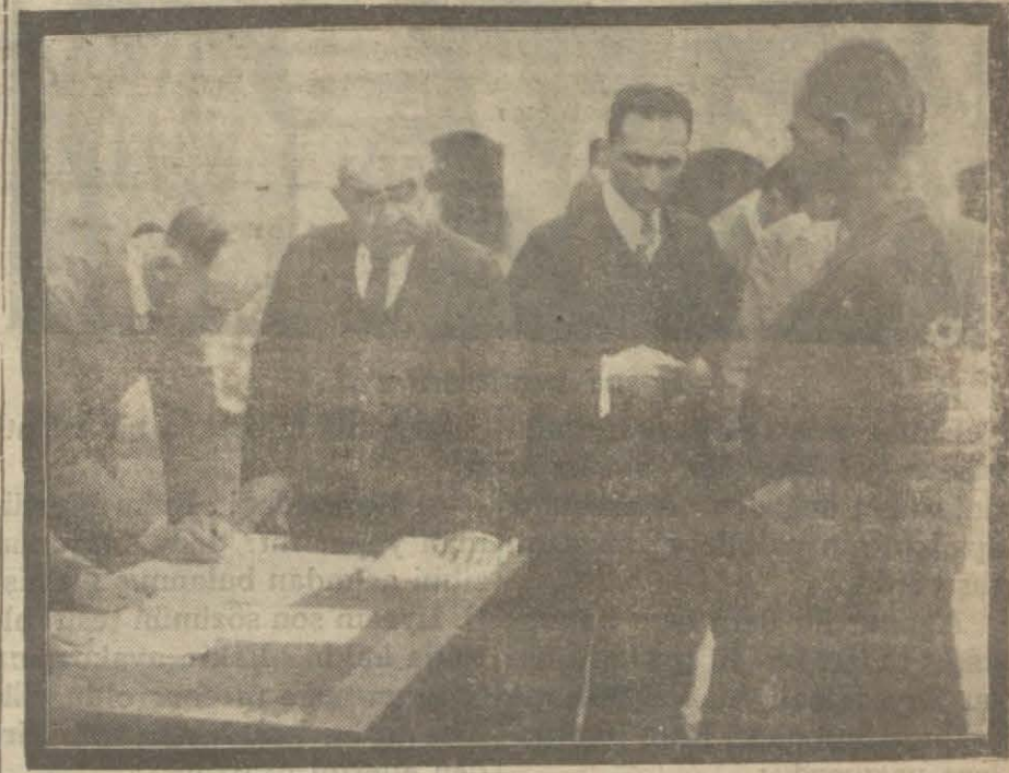
Cumhuriyetin şefkat ve merhametinden de istifade edenlerin evrakı tetkik edildiği ve bunlar birer birer kurtuluşları için iznini alıyorlardı

750 erkek 6 kadın! Dün hapishane ve tevkifhaneden çıkanlar