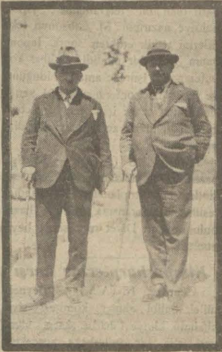
Maliye ve Dahiliye vekillerinin en son resimleri

Maliye vekili bundan sonra eski maaş usulündeki diğer mülkiyâtı izah ederek vergilerde aynı karışık vaziyetin mevcudiyetine temas etmiş, bunu da etrafıyla izahatın sonra beyanına şöyle devam etmiştir: Hâlişen arz ettiğim bu karışıklıklara bir nihayet vermek ve sadece bir hizmet mukabil para vermek demek olan maaş meselesini tek bir sütun