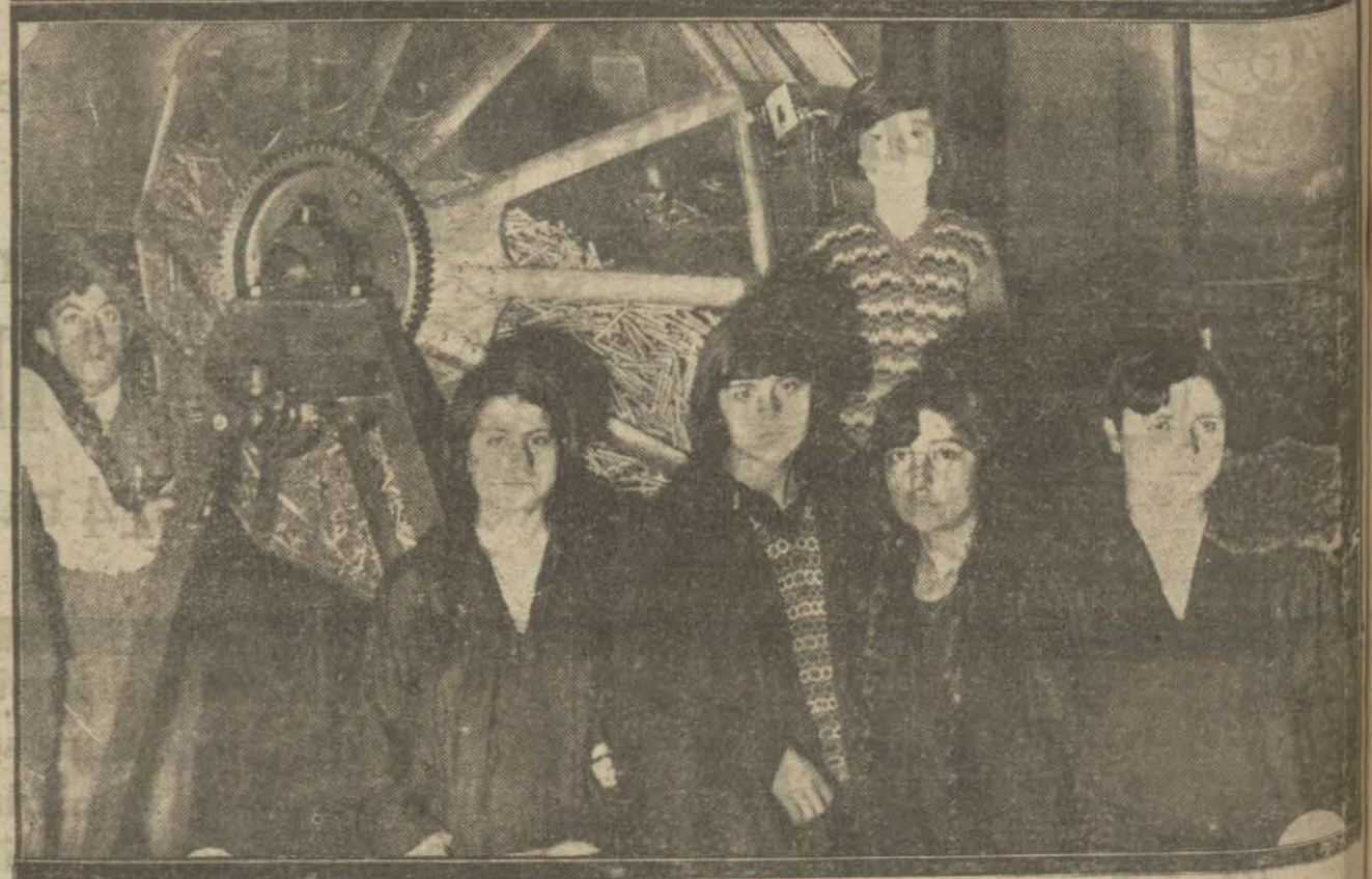
Tayyare piyangosunun dün Darülfünun konferans salonunda keşidesine de m'cdilmiş ve keşide bitmiştir.

Talip olanların bir kısma ait mukavele, şartname vahidi kıyasî fiyat cedveli, münakasa ve ihale şartnamesi ve mütemimim mebaîni şartnamesi ile teminatî muvakkatte ve kat'iyе mektupları nümuneleri ve projeleri otuz beş lira mukabilinde ve iki kısma ait evrakî fenniyeyi otuz yedi buçuk lira mukabilinde almak üzere Ankarada Devlet demir yolları ve limanları umumî idaresi maliye ve muhasebe işleri reisliğine müracaat eylemeleri lüzumu ilan olmuştur.