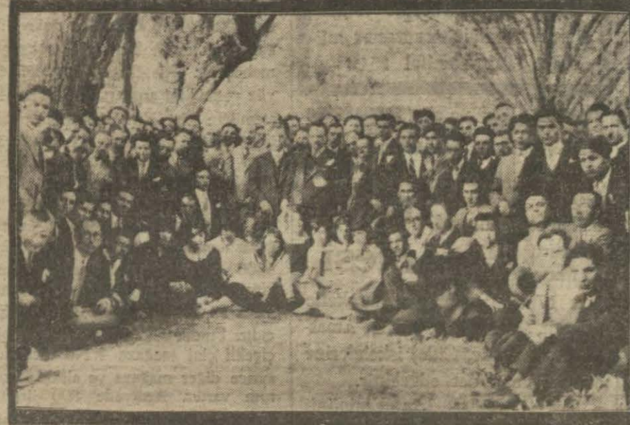
Ankara hukuk mektebi talebesinin kayaş gezmesi İntibalarından. Adliye vekilli beyfendi talebe arasında.