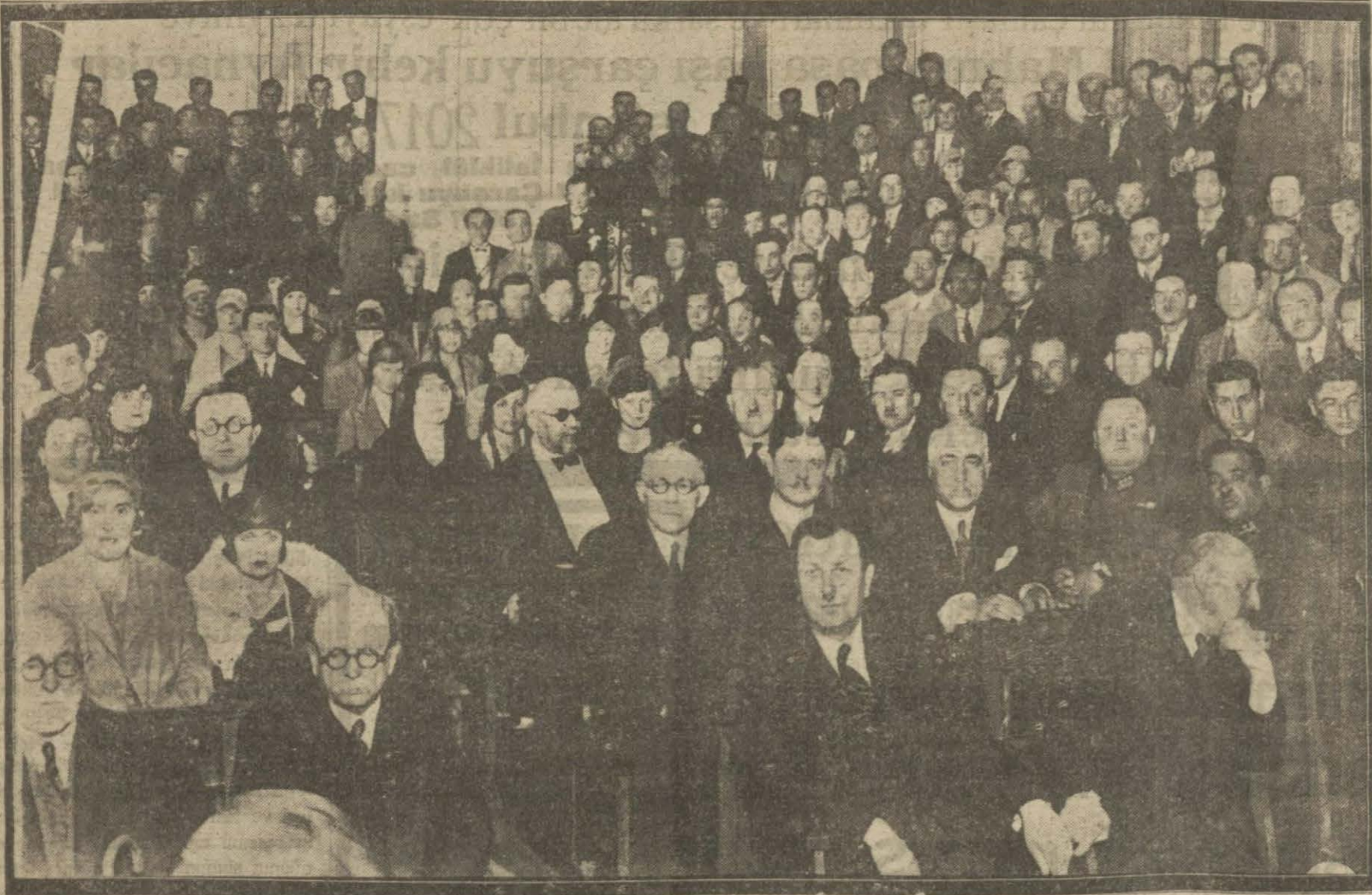
1400 tarihinde teassus eden ilk tababetin yıl dönümü dün Tıp fakültesinde parlak merasimle tes't edilmiştir.