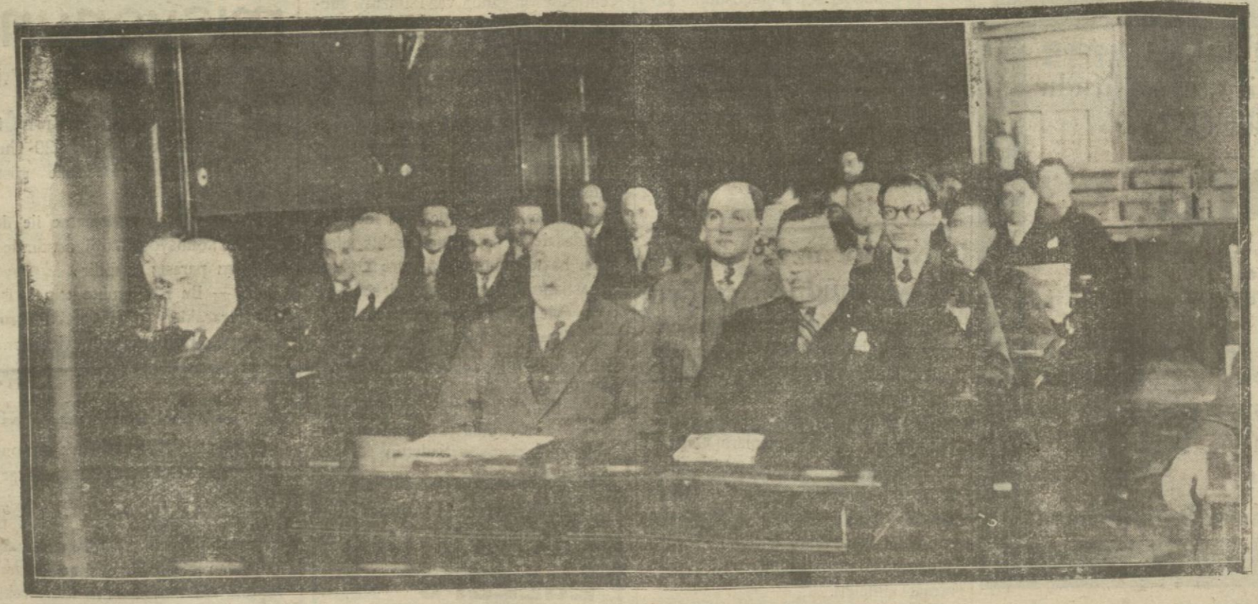
Dün İstanbul Ticaret odası kongrası ikinci içtimasını akdetti. Ticaret ve Sanayi kredilerinin kolay olması için hazırlanan raporlar hükûmete gönderilecektir.