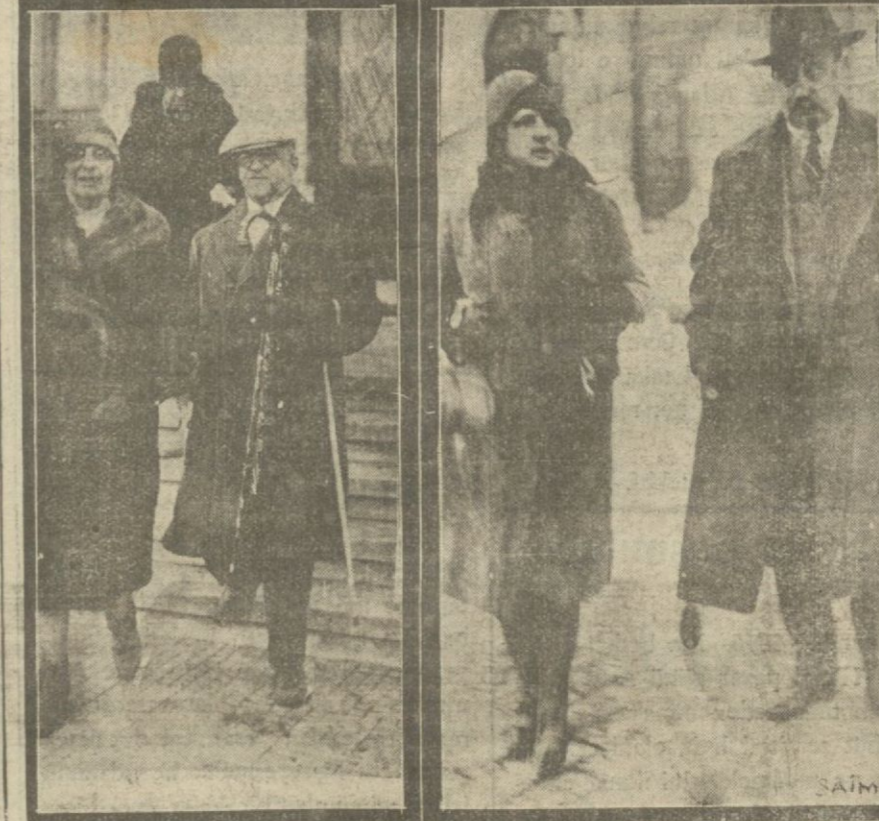
Dün «Stella Polaris» vapuruyla şehrimize gelen seyyahlar, müzeleri ve diğer güzel yerleri gezmişlerdir.