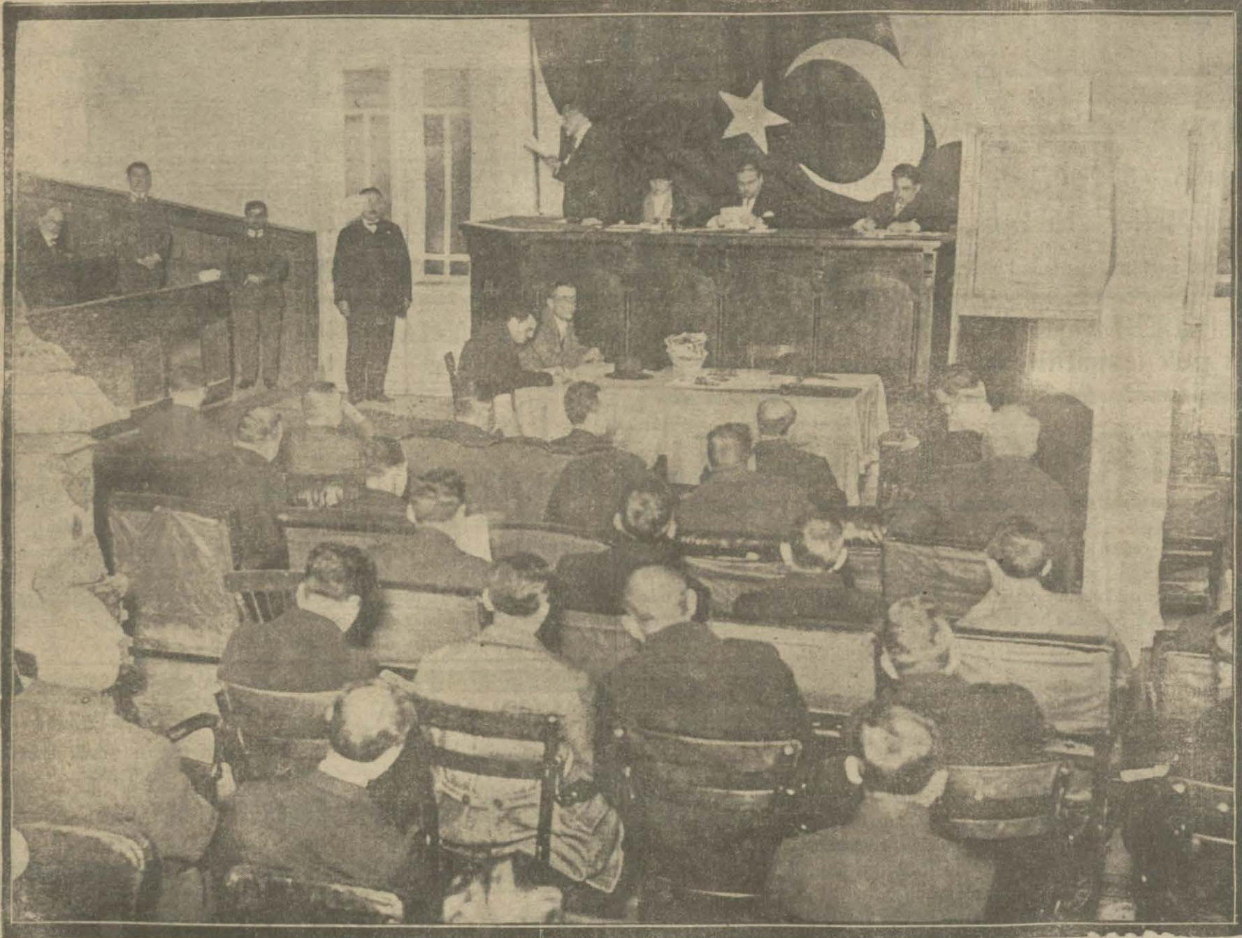
Dün İstanbul Hilâiahmer kongrası toplandı. Bu içt.mada cemiyetin vaziyeti tetkik edilmiş ve varidatın tezyidi için umumî kongraya bildirilecek teklifler hazırlanmıştır.