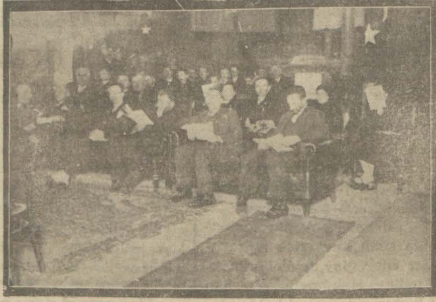
Dün Hilâlahmer İstanbul şubesi senelik kongresini akdetti. İstanbul varidatı 74,840, masarifi ise 36,893 liradır