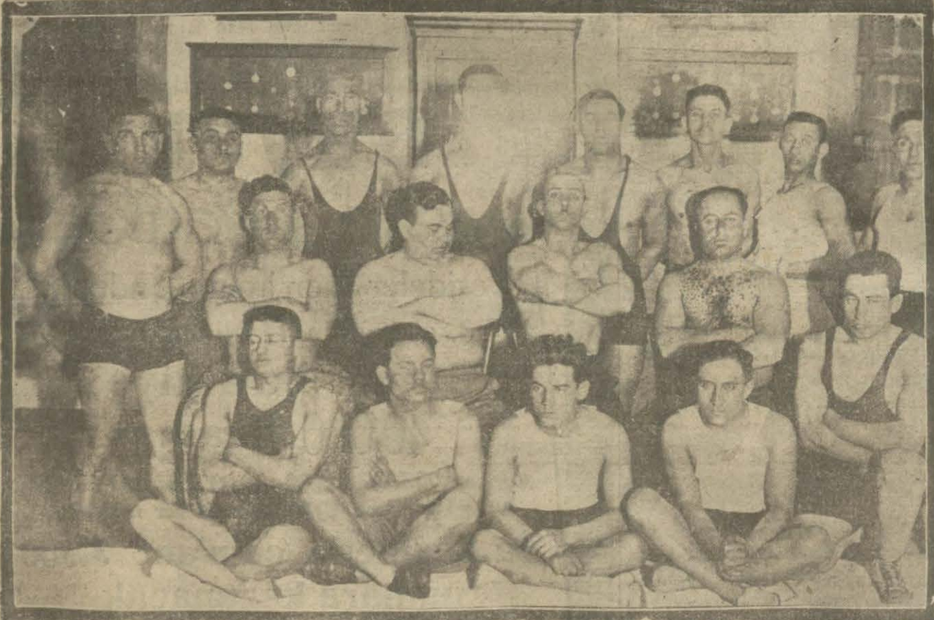
Haliç idman yurdu güreşçileri mütemadi ve muntazam bir faaliyetle tekâmül etmişlerdir.