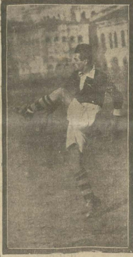
Dünkü maçtan heyecanlı bir enstantane