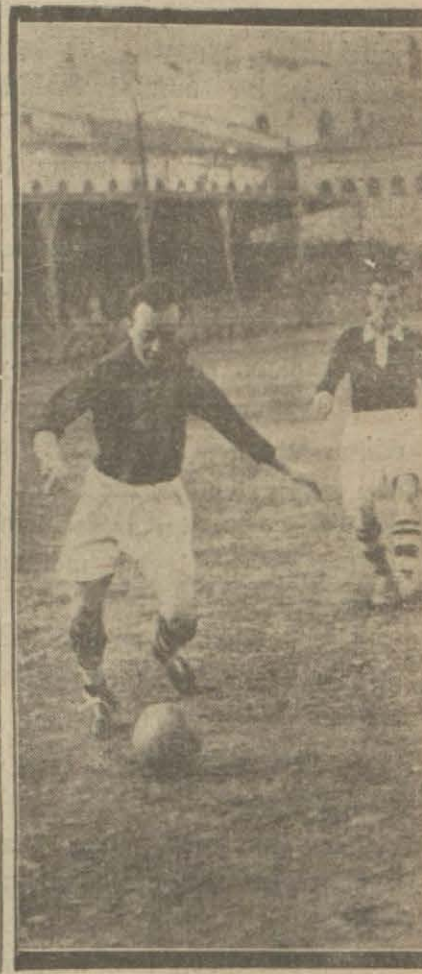
Dünkü maç pek hararetti oldu Beşiktaşlar parlak bir galebe elde ettiler