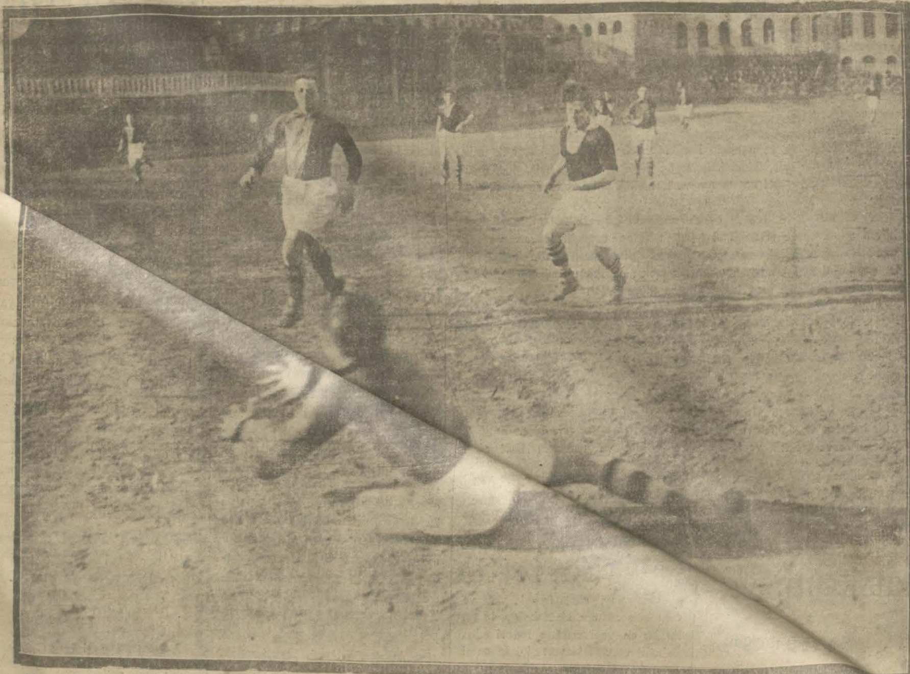
Dün Beşiktaş kulübü ile Galatasaray-Fene rbahece muhtelimi maçı yapıldı. Beşiktaş takımını bire karşı beş sayı ile galip geldi.

İZMİR VE PARİS SERGİLERİNDE BÜYÜK MÜKÂFAT VE ALTIN MADALYA İHRAZ EDEN MARUF