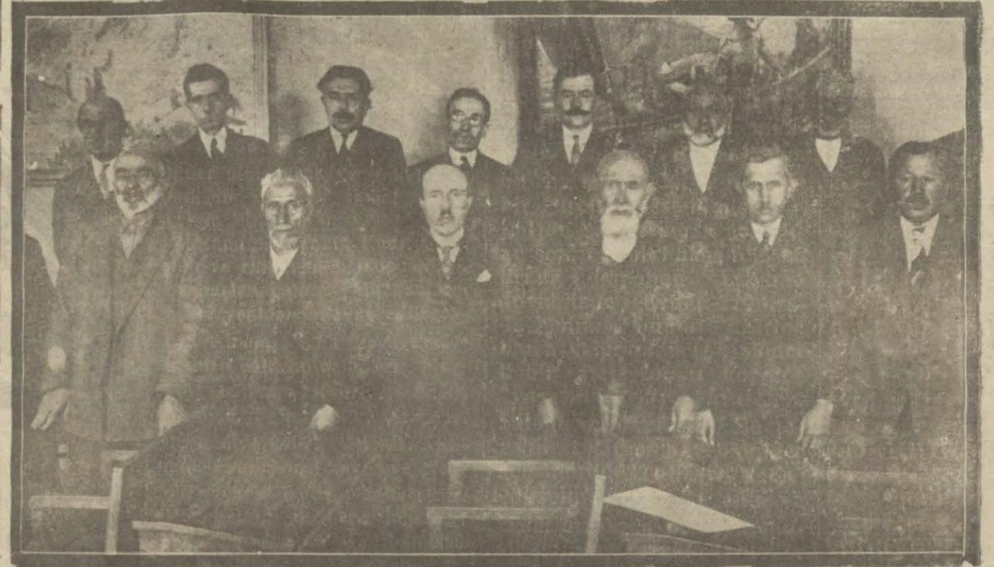
Ankarada Vilayet meclisi senelik içtimamı akteymiş ve şehir işlerini müzakere eylemişti.