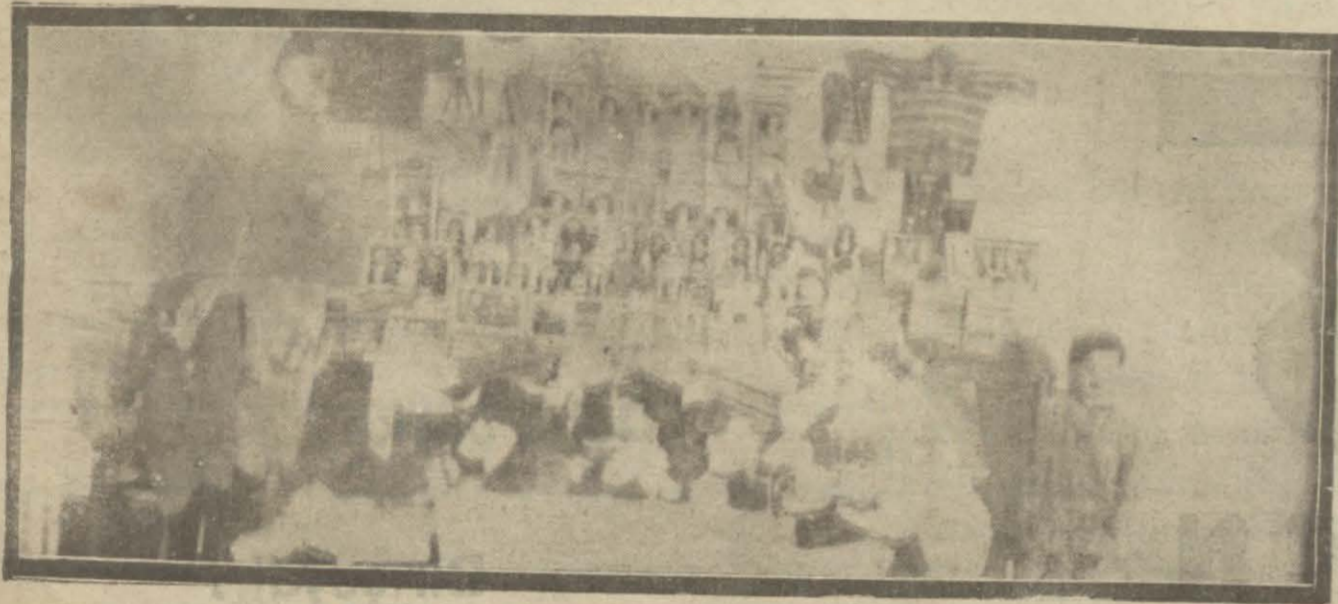
Notridam dö Siyon mektebi talebesi bu senede Darülaceze Süt Damlasın hediyelediler.

Kalyoncukulluğunda feci cinayet; tahkikat devam etmektedir. Viktorya ağır yaralı olarak stahanedeyatmaktadır. Resmimiz mecruh Viktorya ile cinayet evini gösteriyor.