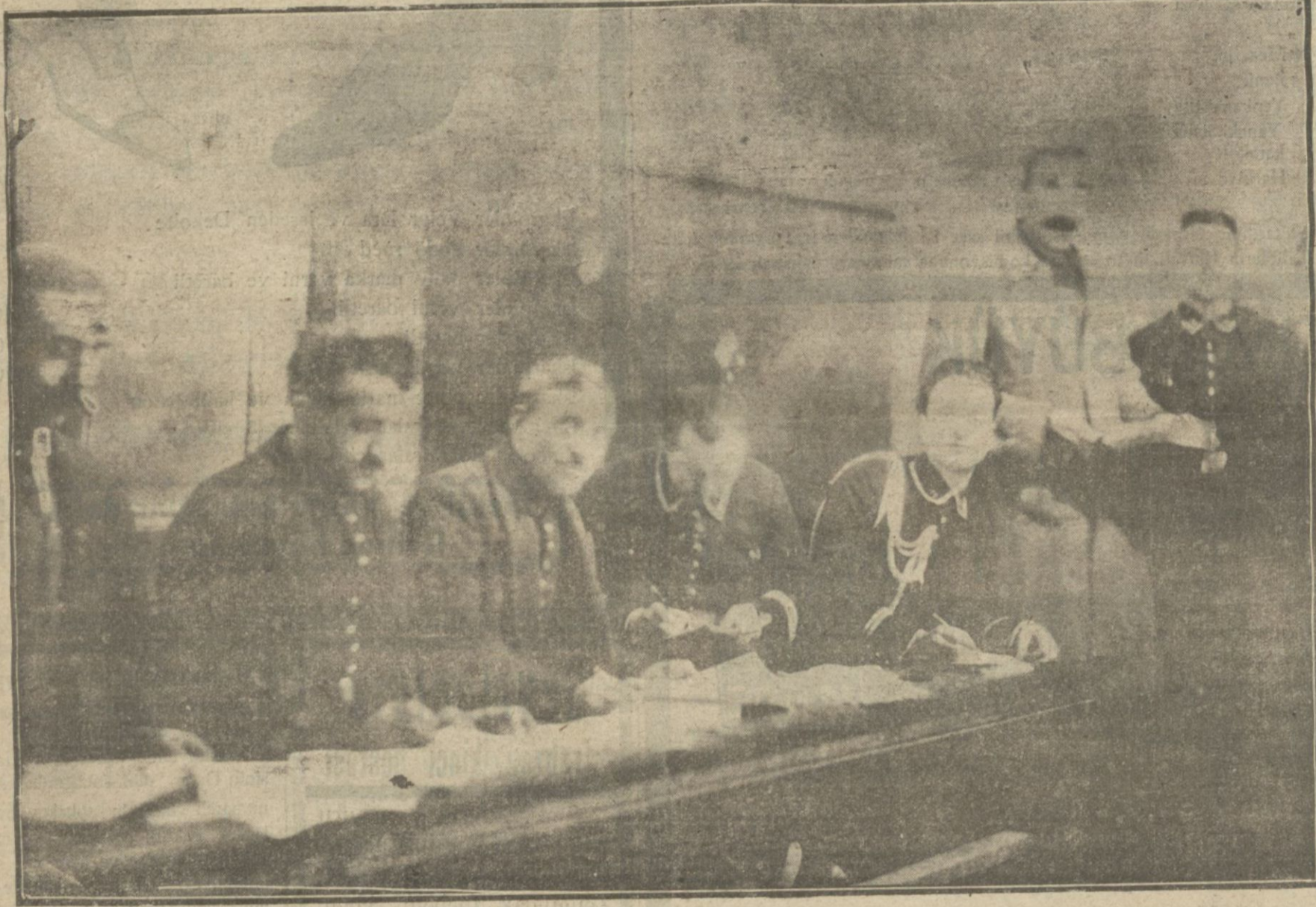
Adliye mubaşırının yerleri alınarak başkalarına verilmiştir. Bundan dolayı mubaşırar artık koridorlara masalarını koyarak iş görmeğe başlamışlardır.