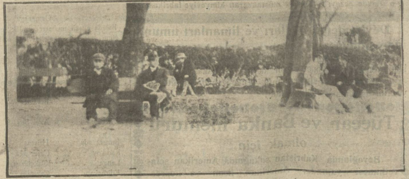
Dün havanın güneşli olması bir çok kimseleri parklara ve açık makallere sevketmiştir. Yukarıdaki resim Sultan Ahmet parkında güneşten istifade edenleri göstermektedir.