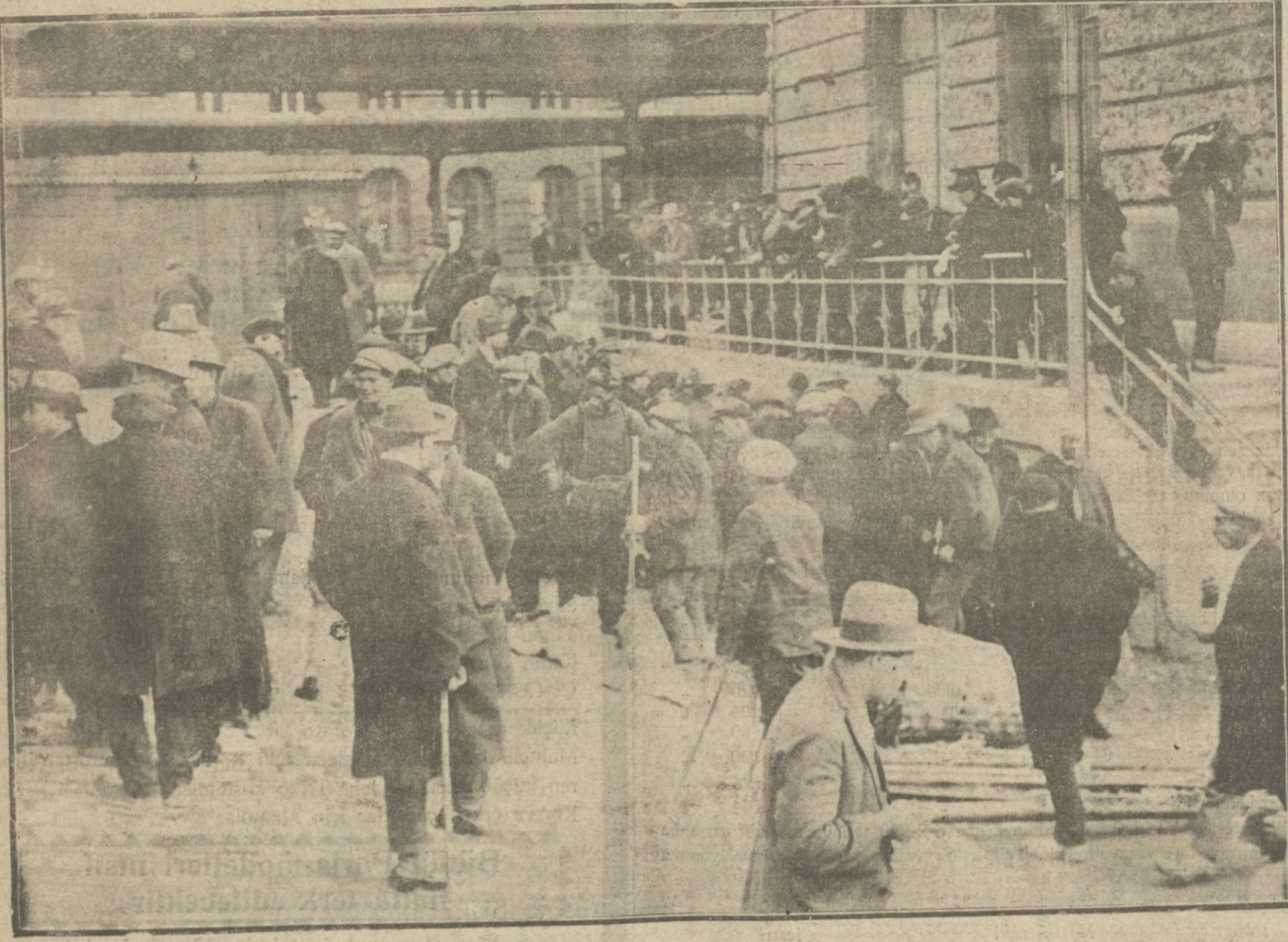
Haydarpaşa gümrüğünde toplanan sahihsiz eşyanın satışına başlanmıştır. Bu suretle gümrüklerde toplanan eşya miktarı pek çoktur. Bedelleri hazineye varidat kaydedilmektedir.