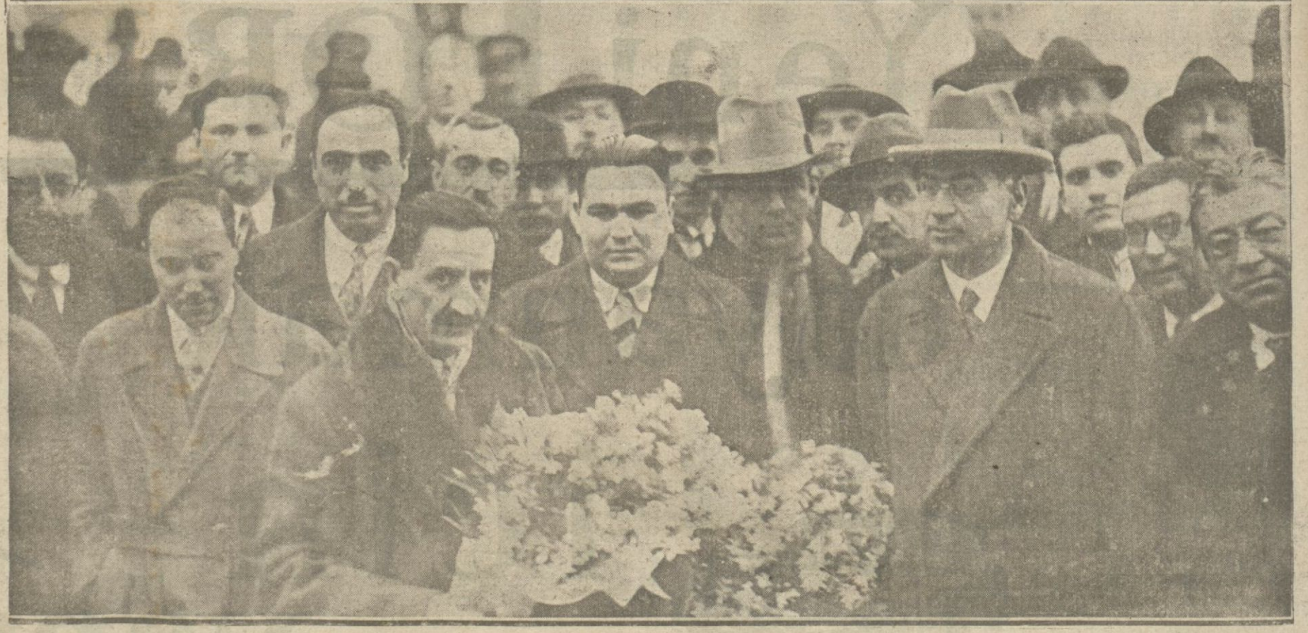
Avrupada tetkikatta bulunan kadastro hey'eti dün sabahki ekspreste şehrimize geldi. Bu tetkikata istinaden 4 sene zarfında memleketimizde yapılacak kadastro işleri hakkında esash bir program vücade getirilmiştir.