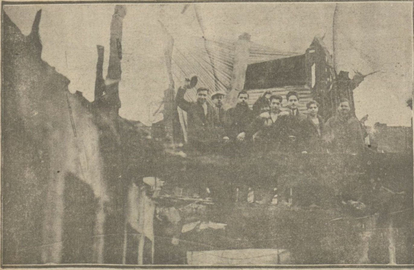
Çarşıkapıdaki tarihi taşhanın mühim bir kısmı evelki gece yandı. Bina sigortalıdır. Zabita yangın çıkmasını şüpheli görek tahkikat yapmaktadır.