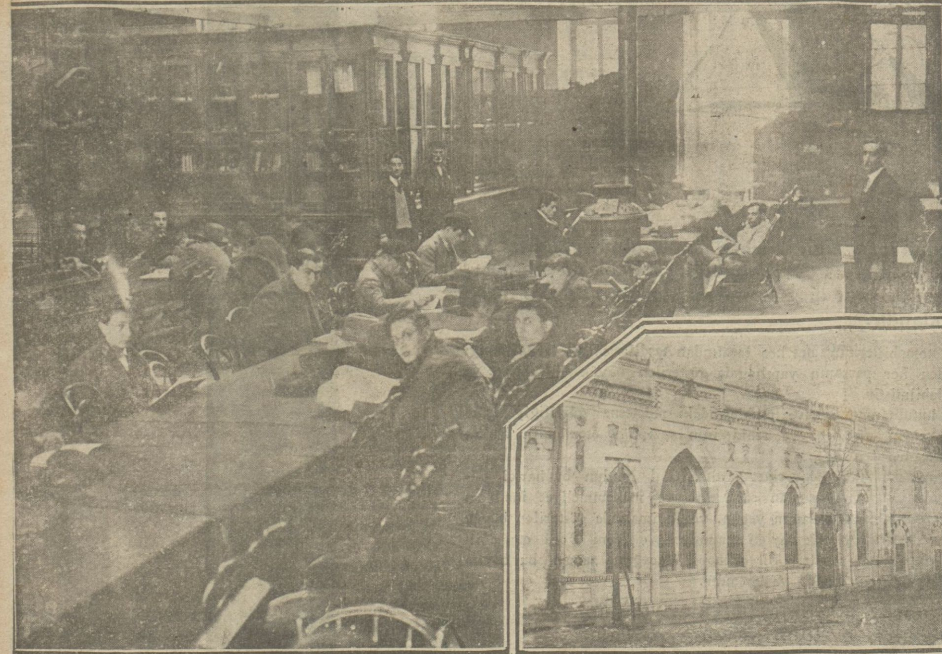
Istanbul kütüphanelerinin tevhidü üzerine okuyanlar bir misli artmıştır. Bunlardan ekserisini muallim ve mektepliler teşkil etmektedir. Eski vakıf eserlerin kıymeti iki milyon liradan fazladır. kitaplar arasında tasviye yapılması muvafık görülmektedir.