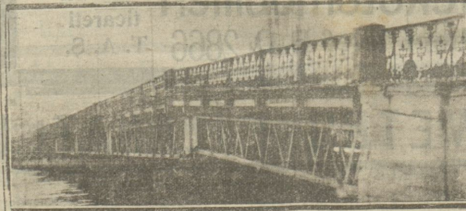
Un kapalı köprüsü son fırtınalardan müteessir oldu. İnşallah yakında yapılır.