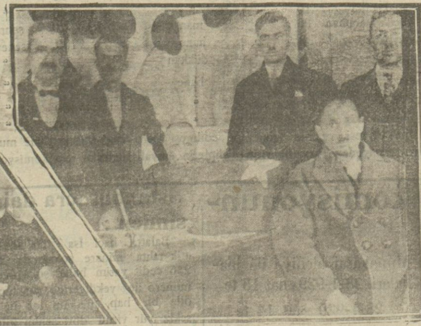
Dün araçlar ve hey'eti idarelerini intihap ettiler