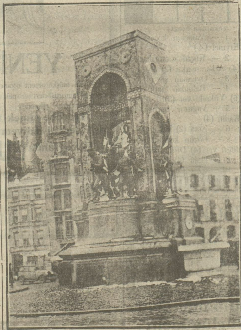
Teşvikat noticesinde Abidedeki çatlağın çok ehemmiyetsiz olduğu anlaşılmıştır.