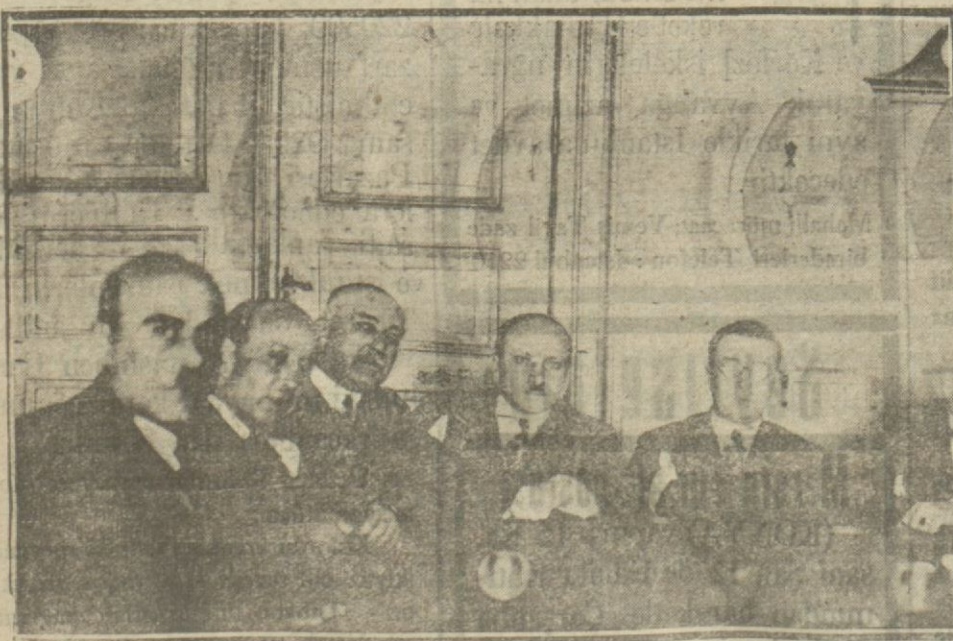
Yeni Cemiyet Belediye intihabı için intihap hey'eti fealiyete başlamıştır.