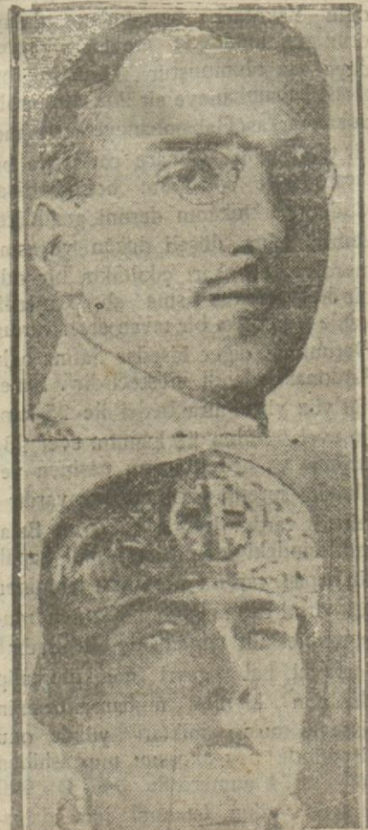
Şerh kralı için yeni vaziyet iyi görülmüyor. Bakalım ne olacak?