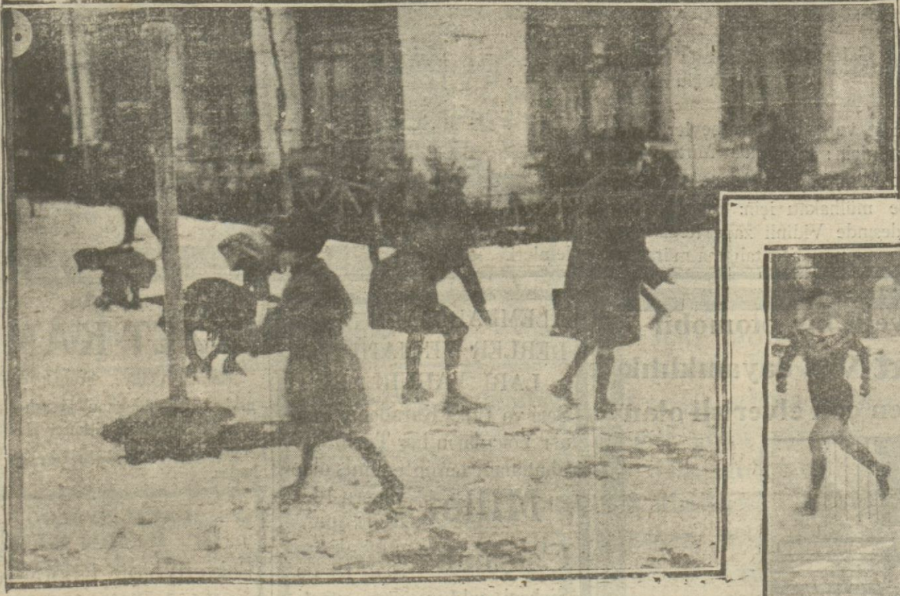
Mektep çocukları kar altında oynarken