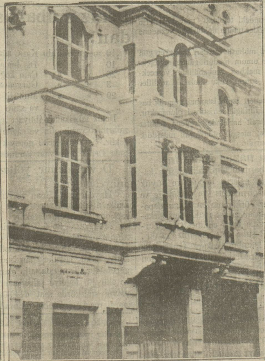
Muameleleri itibarile bir hayli taraktı eden Emlak bankası.