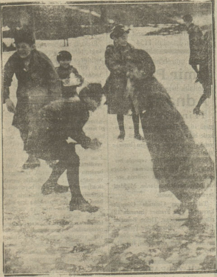
Pünkü lardan en fazla sevinen mektepliler.