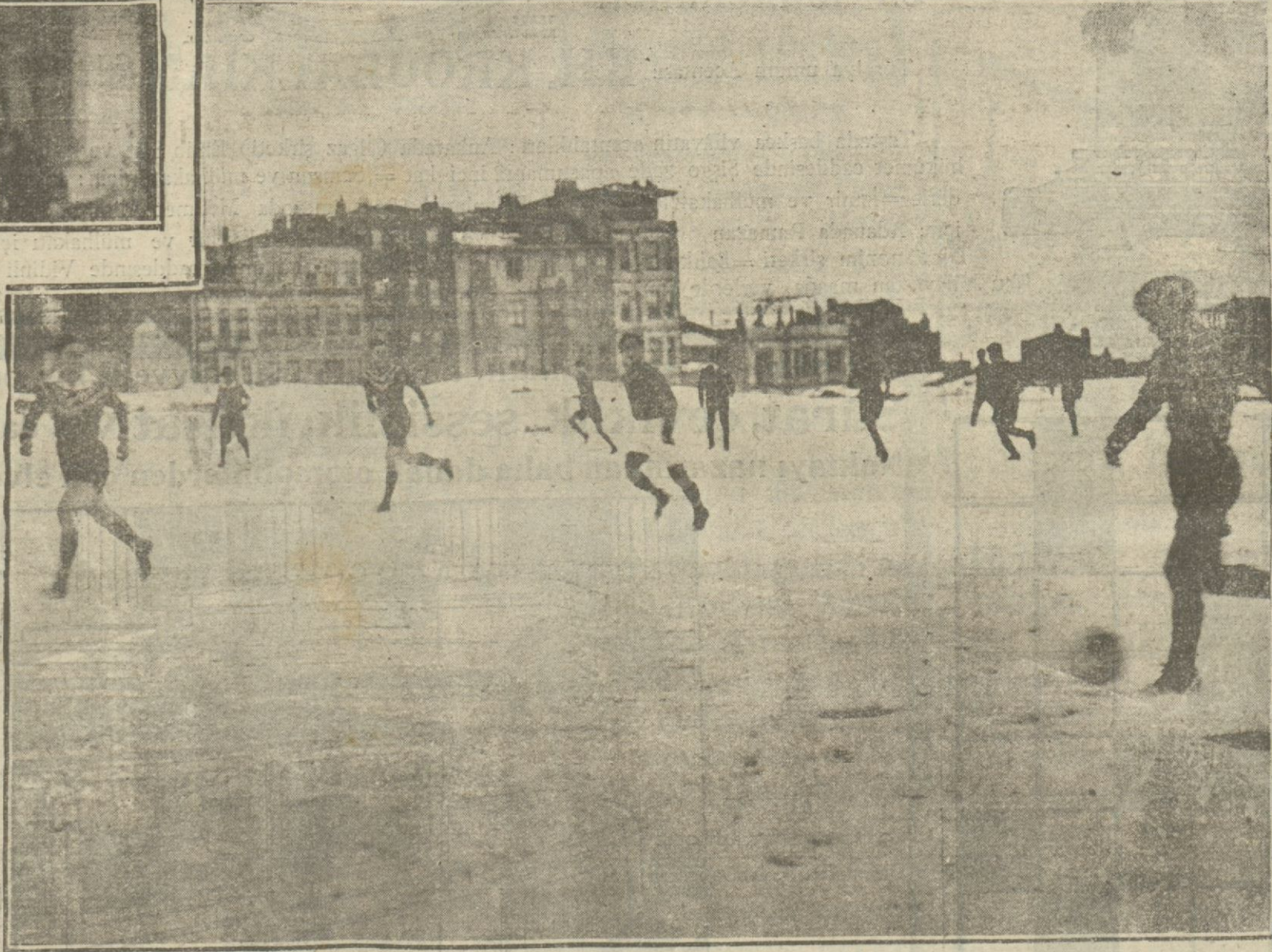
Dün gene hava karladı. Gençler kış sporu olarak Taksimde top oynadılar.