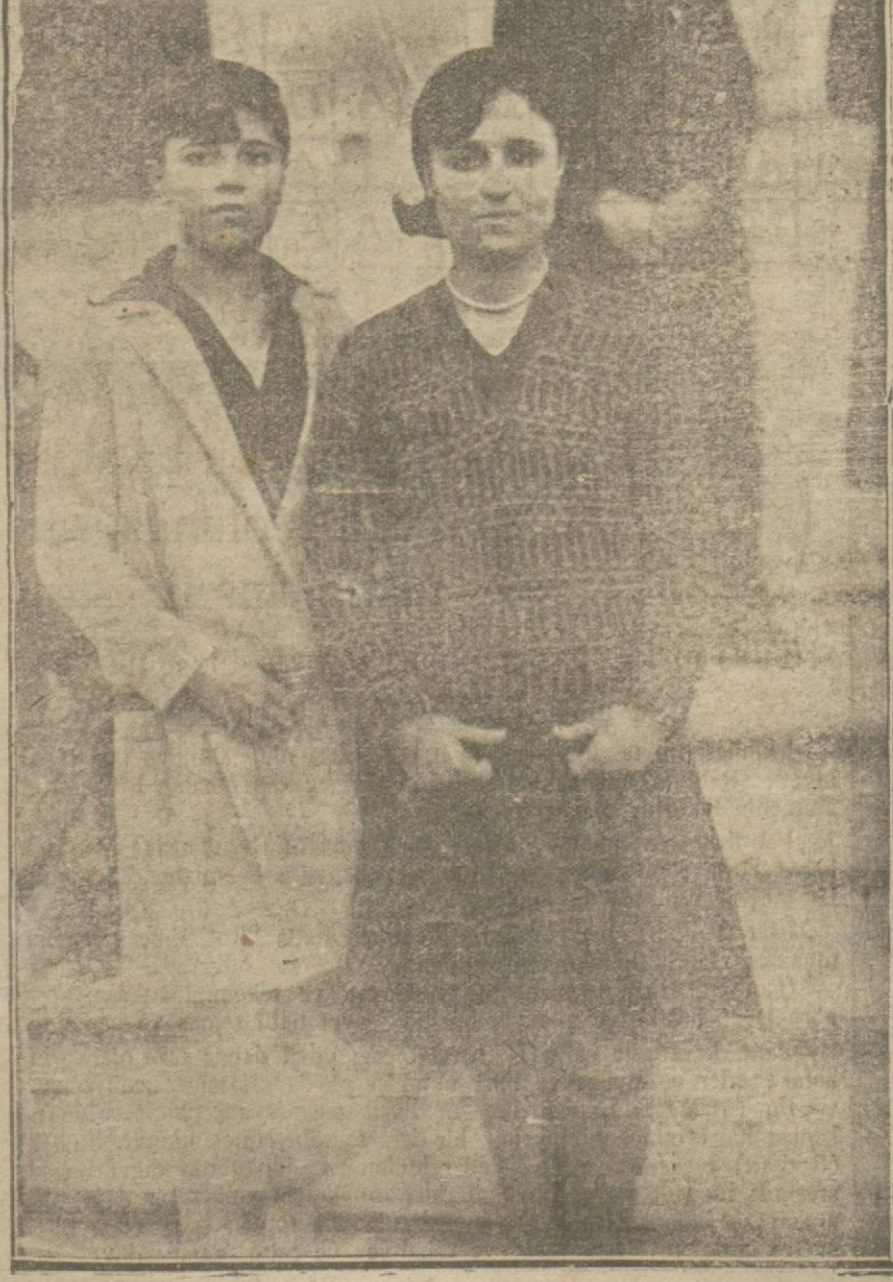
Tayyare piyankosunu çeken kızlar, kazanan numaraların yazıldığı siyah tahta: