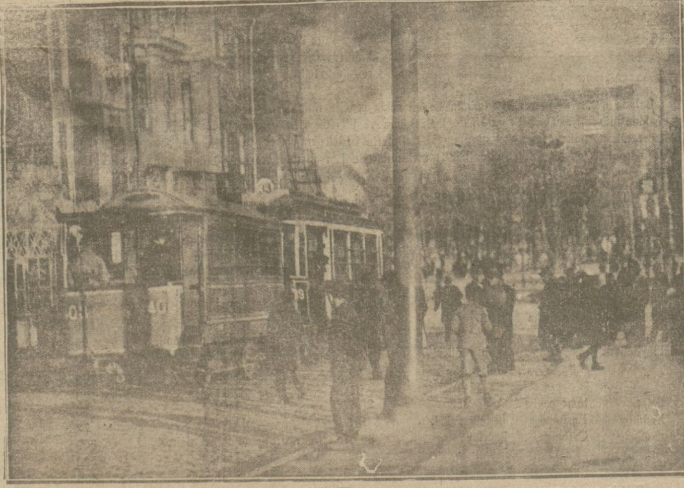
Bir kaçgünü evel hava tamamene kışa çevirmişti. Fakat dünkü güneşli hava İstanbullulara bir bahar günü yaşamak fırsatını verdi.