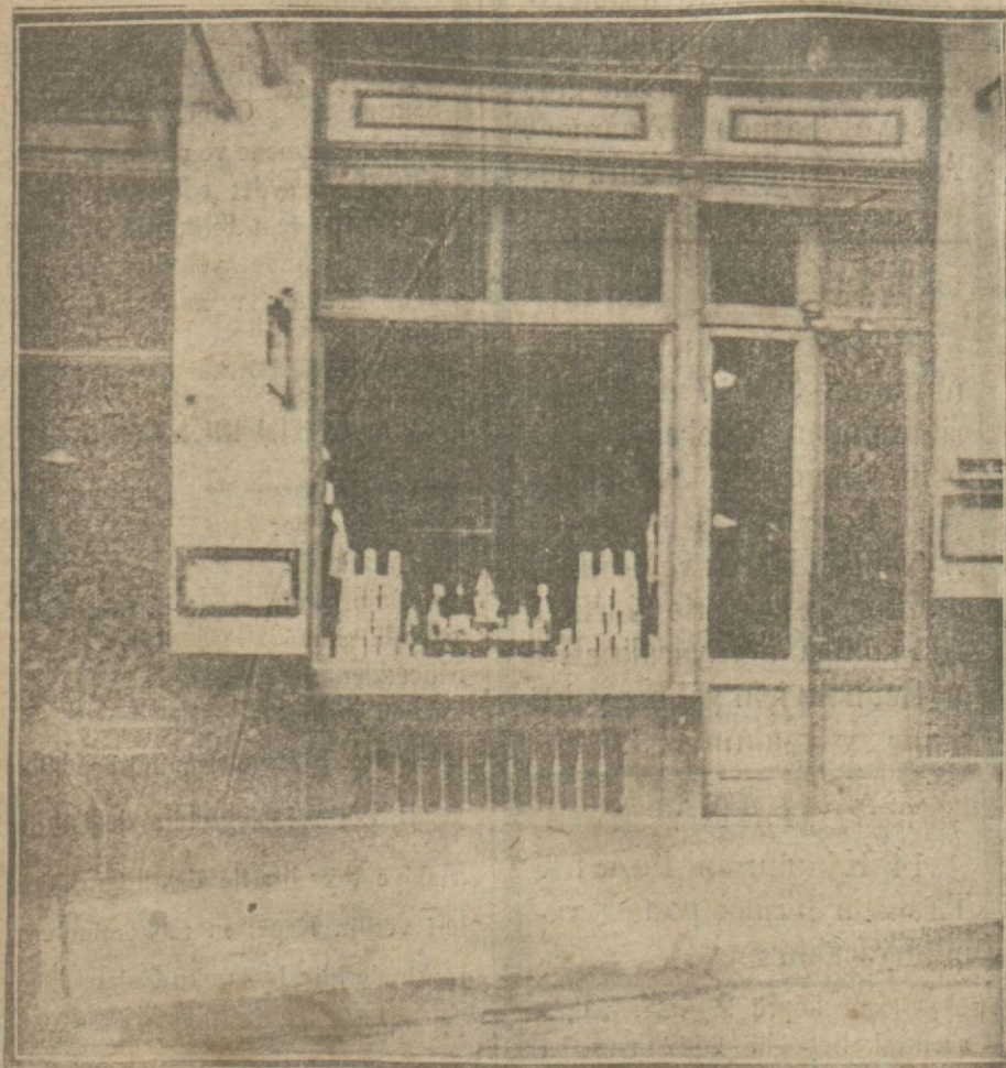
Fezacılar ilaç fiyatlarını artırdılar. Bunun sebebi pahalılaşan alkolün ispirotudur.