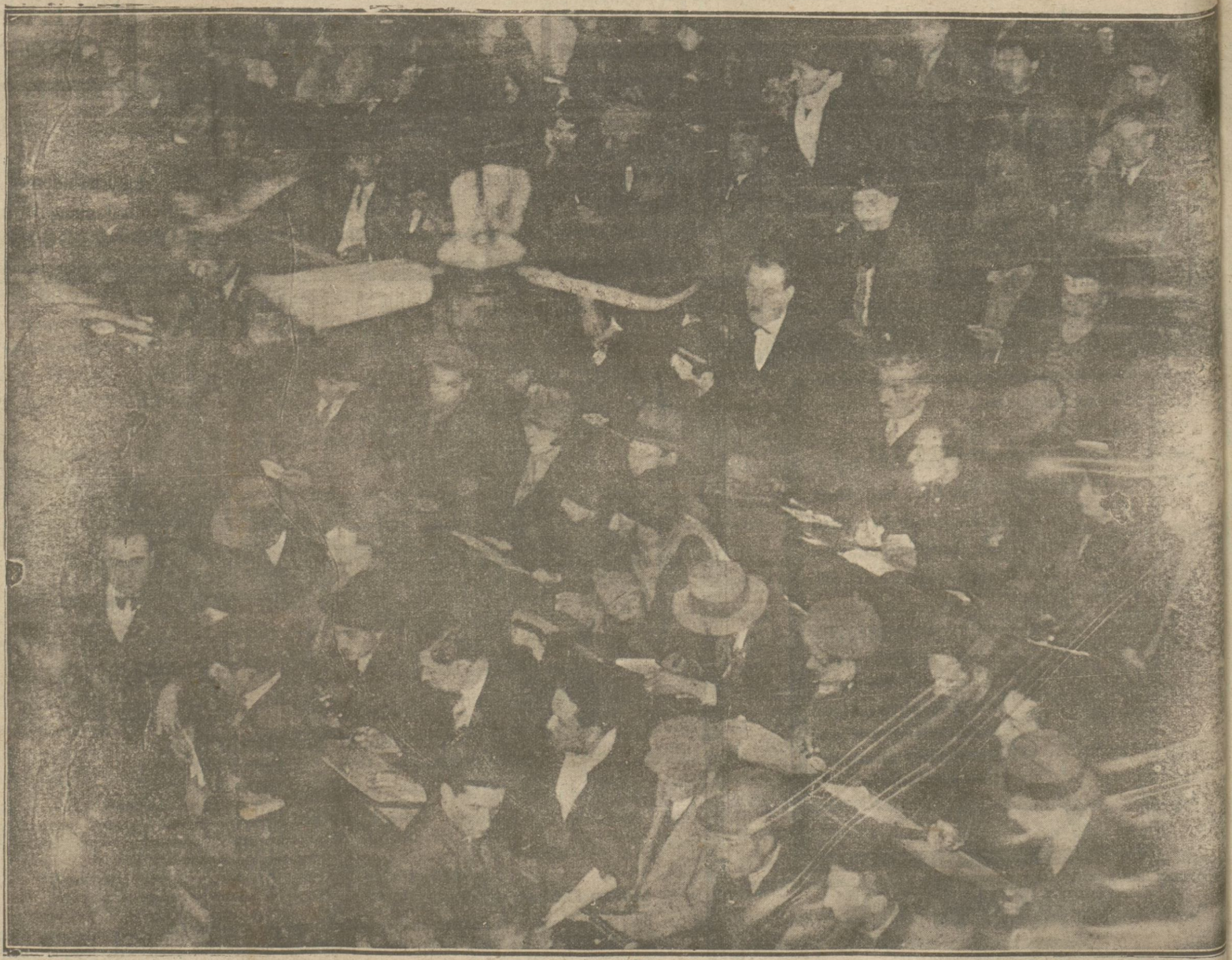
Tayyare piyangosunun altıncı keşidesi dün çekildi. Salon her zamankinden kalabalıktı. Artık 30,000 liralık ikramiye olmayacağı için herkes keşideyi heyecanla takip ediyordu. Resmimiz bu sahneyi gösteriyor.