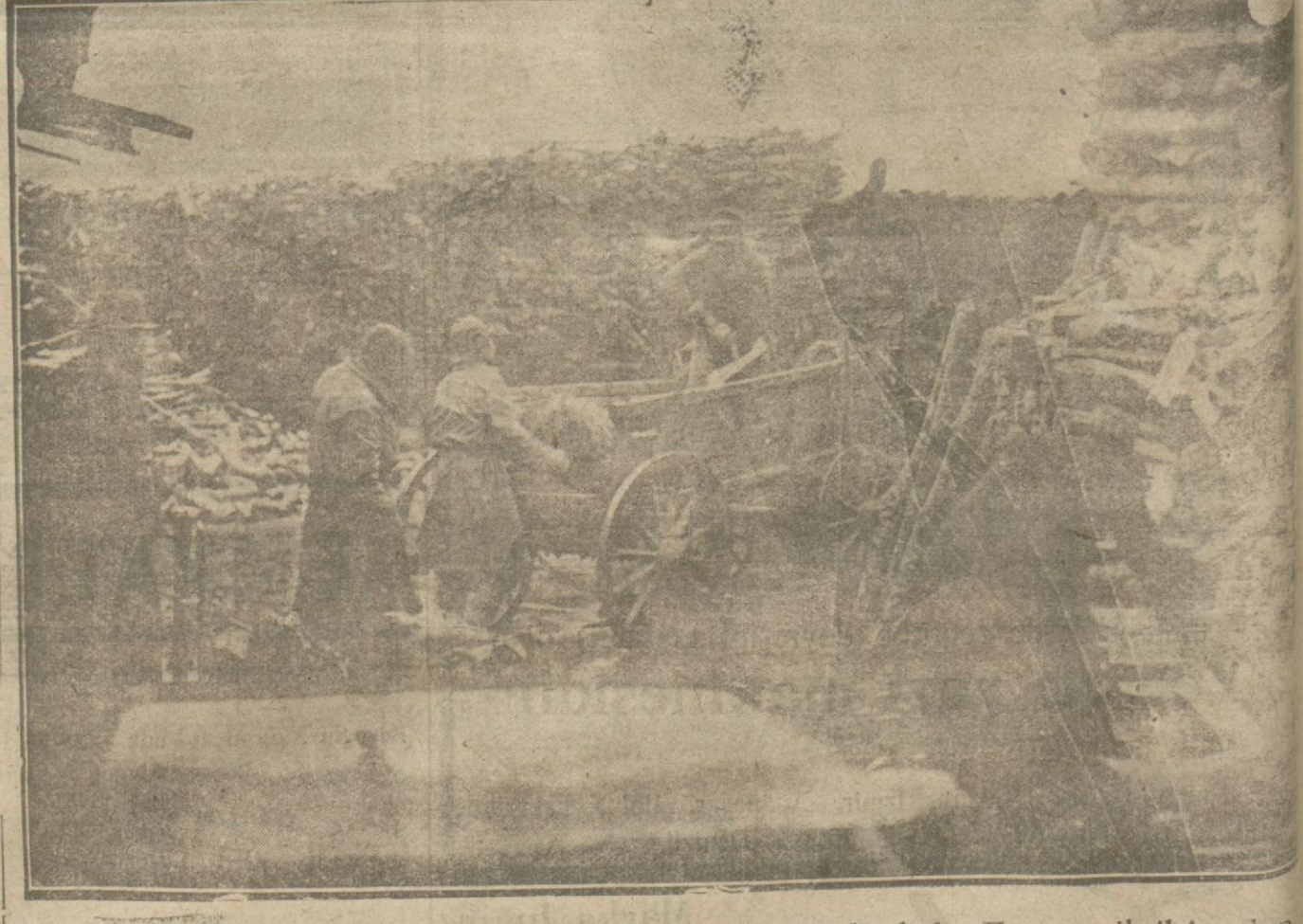
Kış gelir gelmez kömür ve odun pahalılaşmaya başladı. Emanet ihtikâr olup olmadığını tespit ettirmektedir.