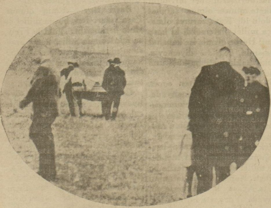
Meçhul katilin öldürdüğü kadınlardan birinin cenazesi nakledilirken..

Düsseldorftan bildiriliyor: — Düsseldorf'taki gizli haydut hakkında hâlâ tahkikat devam ediyorsa da bir türlü bu haydut bulunamamıştır. Son günlerde gene dört yaşında bir erkek çocuk bir tecavuze uğramıştır. Bunun üzerine halkın heyecanı yeniden artarak artık meçhul haydut hakkında hatırı hayale gelmeyen masallar uydurulmuştur. Polis yeniden bir işçiyi yakalamıştır. Bu işçi de kadın kıyafetine girip gezmek bir eğlence olmuştur. Bir nevi spor halini alan bu eğlencenin müptelaları gittikçe artmaktadır.