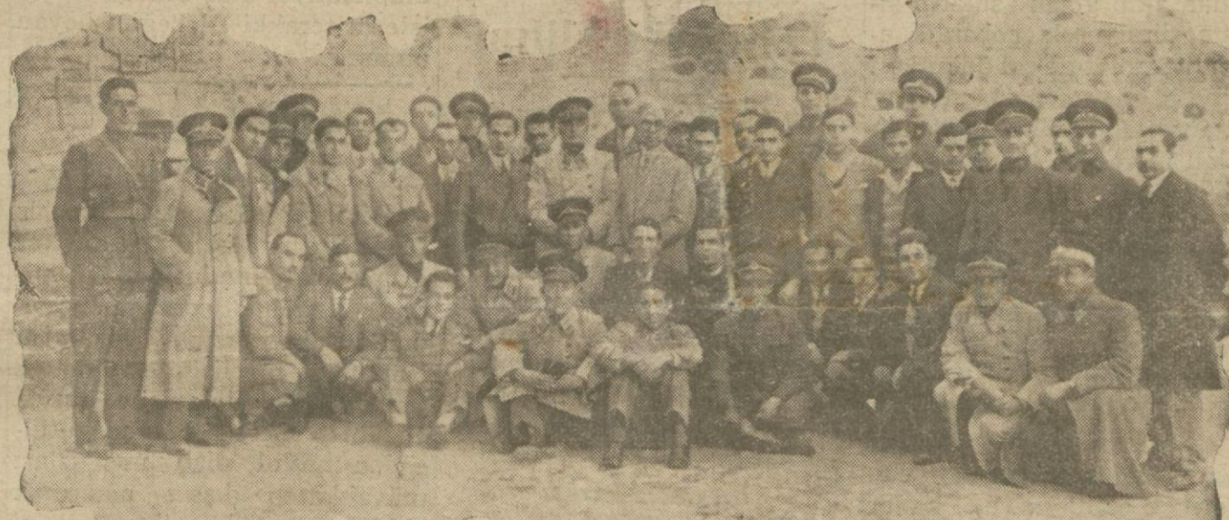
Fenerbahçeliler Ankarada samimî bir surette istikbal edildiler

Oyun çok samimî olmuş iki taraf çalışmıştır