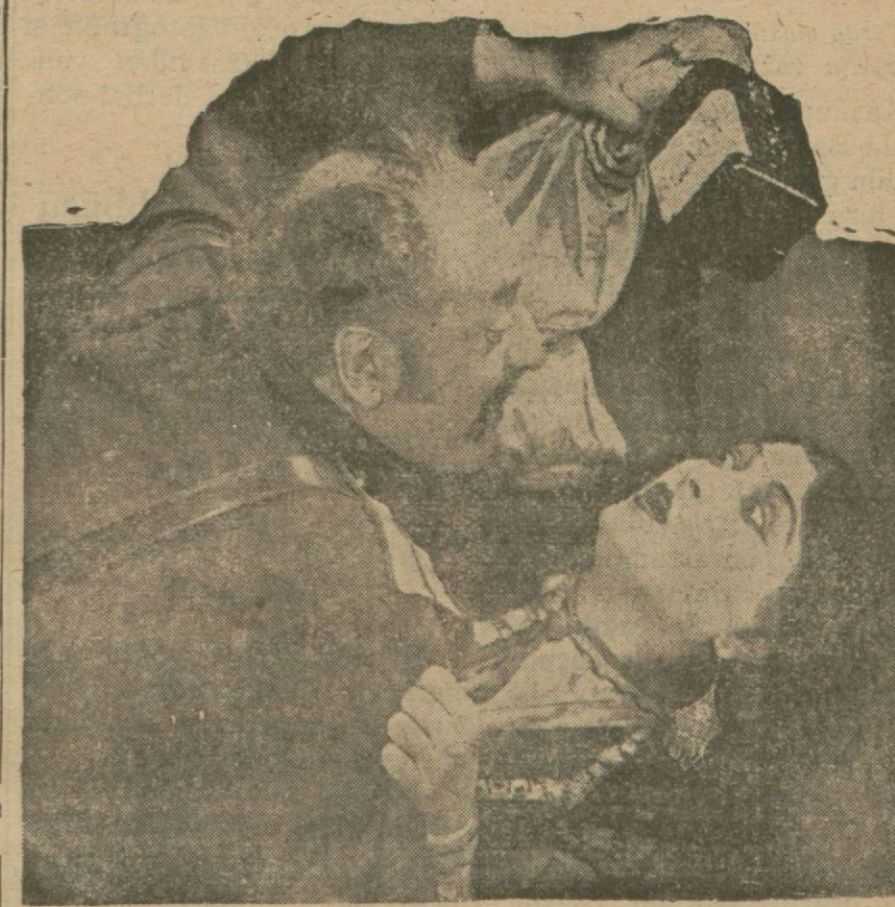
"Son çarlar., filminden

Şimdi Varnes Brothers, Paramunt kumpanyası ile bir kombinasyon yapmak niyetindedir.