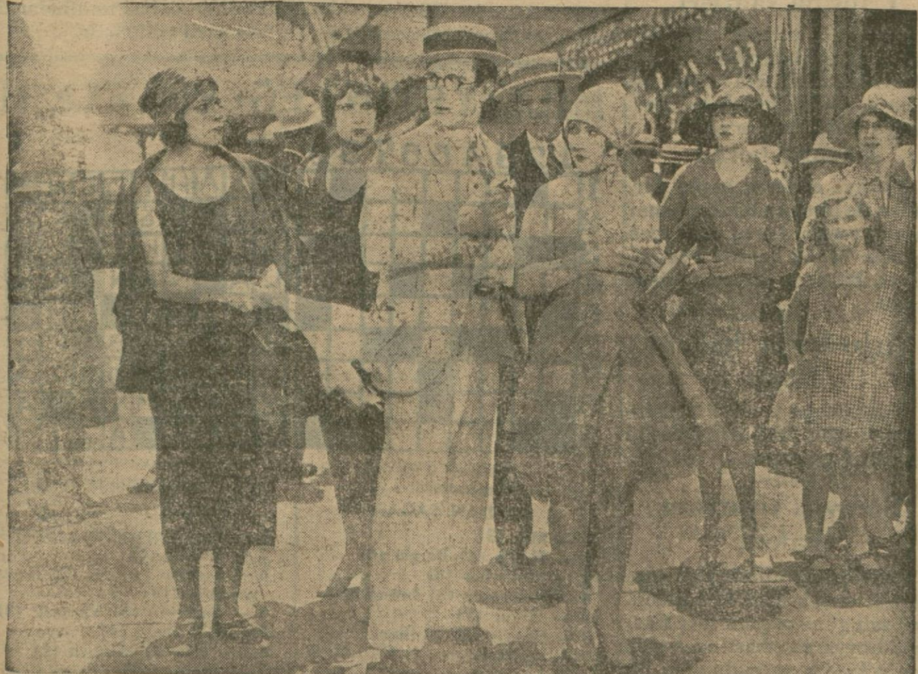
"Ateş gibi., filminden

Maryo işinin başma gider Ri ta da zengin bir aramı metresi olur. Bir gün araplar kumandanın üzerindeki plânları almak için onu eski metresinin evine celbedip soyarlar. Maryonun karısı, kocasının kendisine daima sadık olduğunu onun bir ar kadaşı vasıtasile öğrenince onu aramaya çıkar ve bu suretle cel bedildiği yerde baygın bir halde bulur. Kumandan ayrılınca hemen aramı peşine düşer, onu yakalar ve bu esnada yar r t sada zevcesile buluşur.