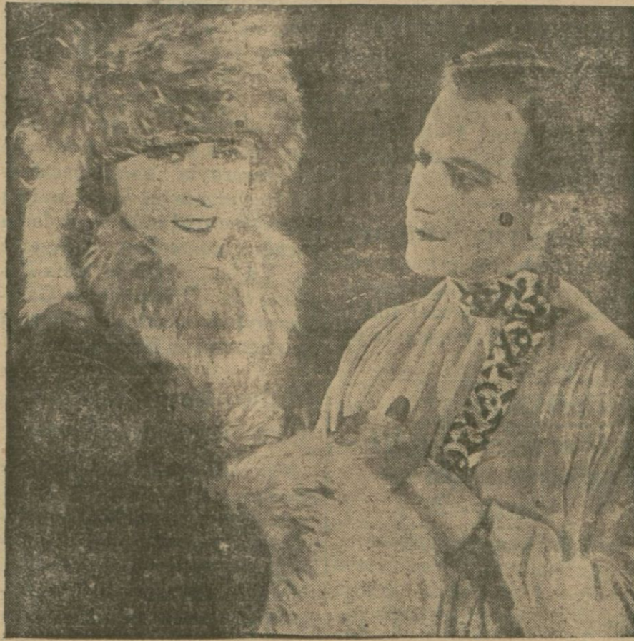
"Son çarlar., filminden