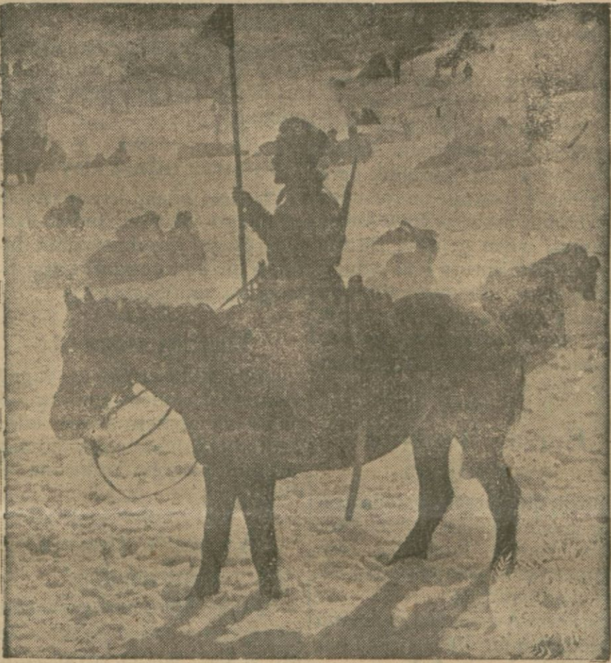
"Son çarlar., filminden