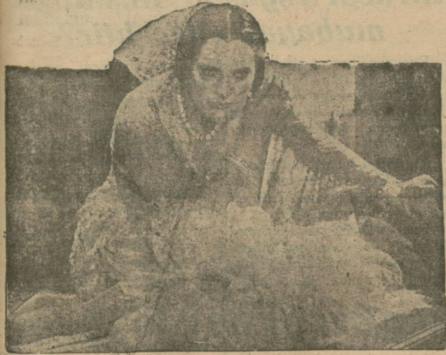
İmdat *S. O. S., filminden