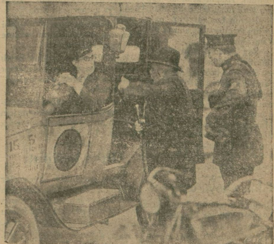
"Ateş gibi., filminden

Maurice Chevalier'nin "Ateş resmi geçidi" isimli ikinci serli filminin yakında Nevyork'da iraesine başlanacaktır.