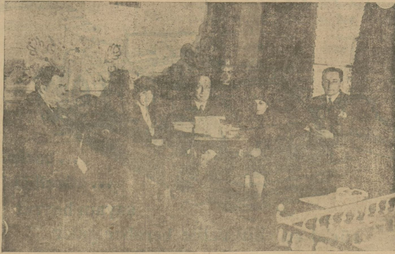
Millî tasarruf Cemiyeti İstanbul şubesi İdare hey'eti ilk içtimasını dün C. H. F. merkezinde yapmış ve Cemiyetin faaliyetine dair görüşmüştür

Ankara erkek lisesinde bir İngilizce muallimliği münhaldir. Maaşı 37,5 tutarı 120 liradır. Yüksek tahsili olmak ve lisansla birlikte bilmek şarttır. Taliplerin on güne kadar bizzat veya mektupla müracaatları.