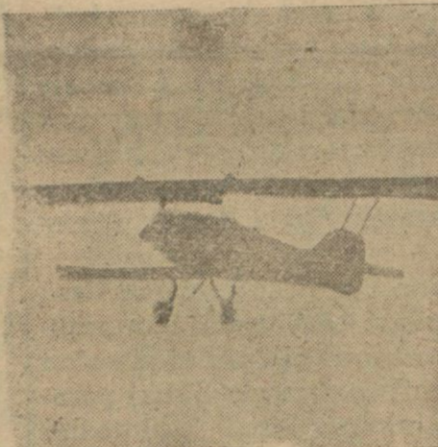
Aeroekspresunun kaybolan tayyarelerinden biri

Atina 26 (Apo) — Salı günü İstanbuldan Brindiziyeye hareket eden Aeroekspresinin bir tayyaresi telsizle imdat ve tehlike işaretleri vermeye başlamış ve gece saat 11 de Elli namındaki Yunan kruazörü kazazede tayyare yolcularıyla mürettebatını kurtarmak için Ayios Efstratiyos adasına hareket etmiştir. Elli Kruazörü bütün gün taharriyatta bulunduğunda bir netice elde edememiş ve fırtınadan dolayı Stiros adasına ilticaya mecbur kalmıştır. Kruazör tekrar taharriyatta bulunacaktır. Tayyarenin yolcular ve mürettebatı kaybolduğuna zannolunuyor. Bugün Aeroekspresinin iki tayyare resî taharriyatta bulunmak için mahalli kazaya gitmişlerdir.