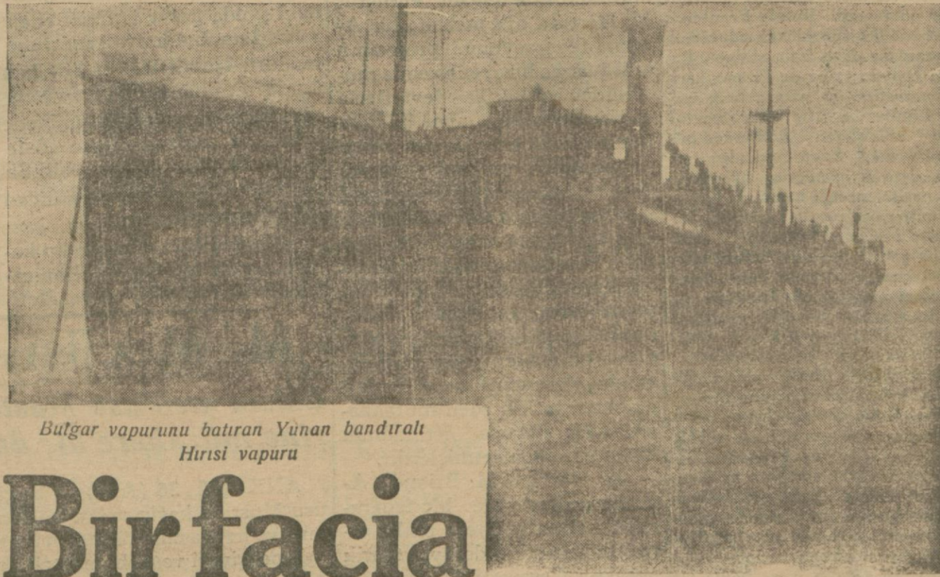
Bulgar vapurunu batıran Yunan bandıralı Hırısı vapuru