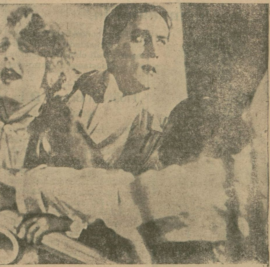
İmdat *S. O. S., filminden

Bezbol. Günün birinde Ateş gibi iştirak edemediği bir Bezbol maçı esnasında Dillon'un imtiyazının elinden alınmasına dair bazı tasavvurlara vakıf oluyor. Baba Dillon'un bütün hayatının bu arabaya bağlı olduğunu bilen ve, esasen hafidesi Jana tutkun olan Ateş gibi tam atlı tramvayın aşırıldığını duyunca hiç bir şeyden çekinmiyerek işe girişmeğe karar veriyor. Çünkü eğer Baba Dillon yevmiye bir sefer yapmıyacak olursa imtiyaz hakkını kaybedecektir. Bu vaziyet karşısında Ateş gibi hiç bir şeyden yılmıyarak işe girişiyor ve Baba Dillon'un hakkını daha doğrusu kendi muhabbetini vikaye kasabile bin müşkülât tahtında atlı tramvayı yerine yetiştiriyor ve bu hareketi Baba Dillon'un takdirine mazhar olması dolayısıyla kendi saadetini de temin etmiş oluyor.