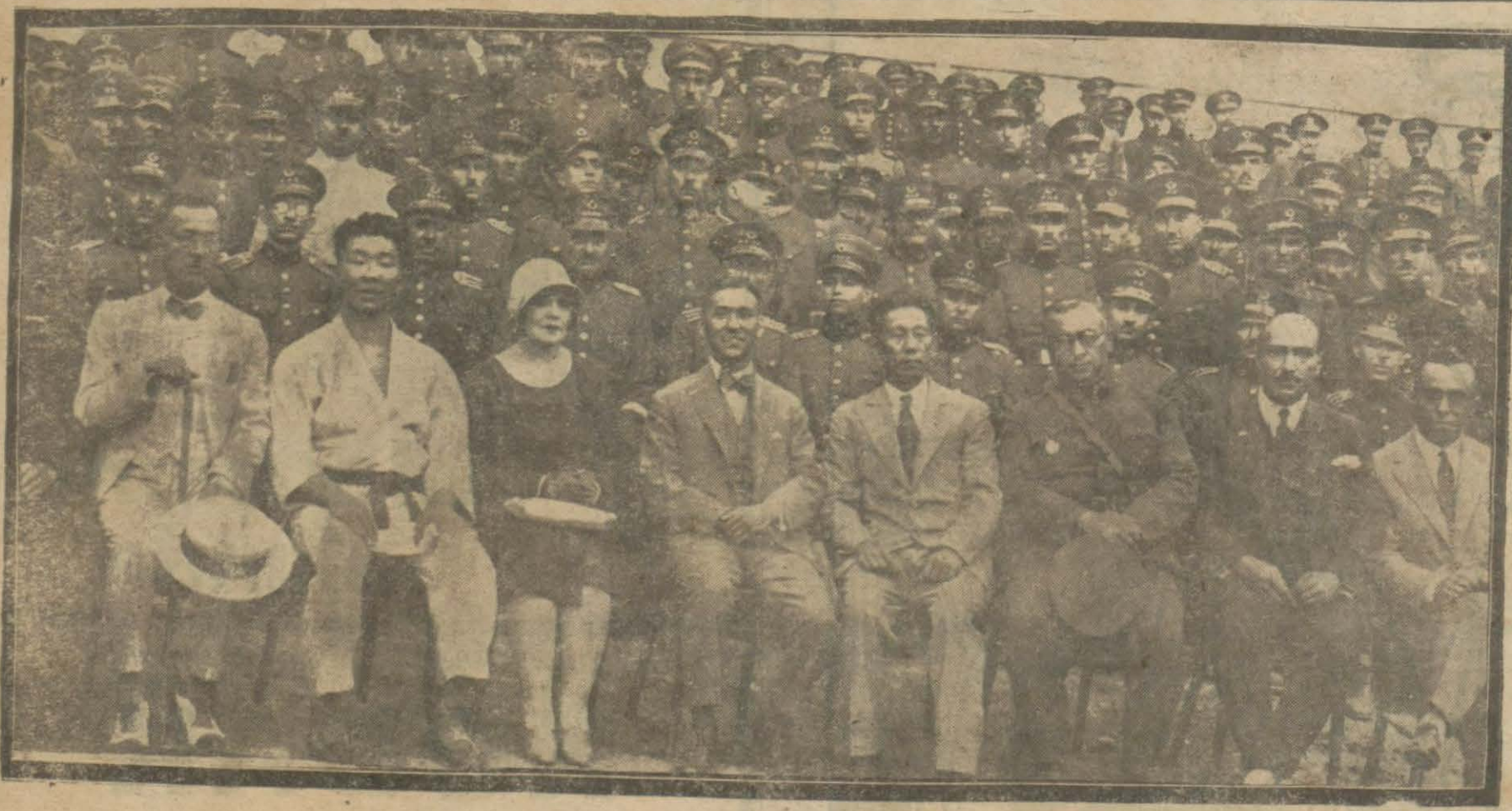
Dün bir Japon hey'eti Polis mektebimizde musaraa usulu hakkında bir konferans verdi ve hareketleri vapp.