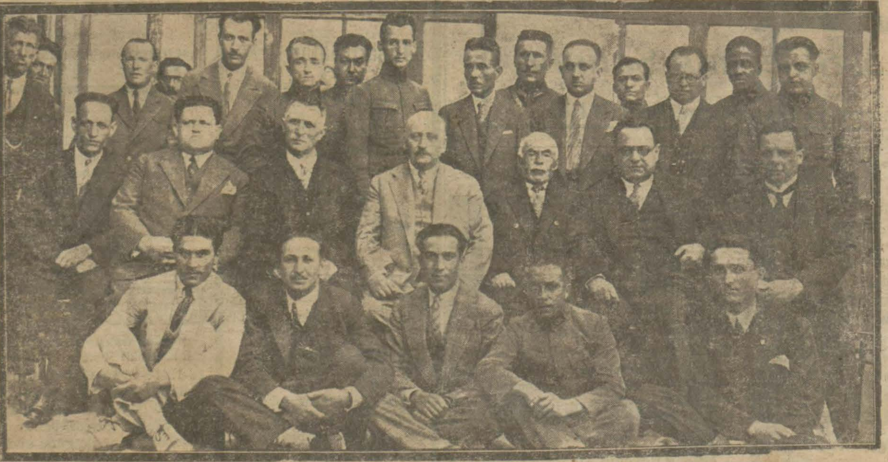
Eczacı mektebinden bu sene kıymetli gençler mezun olmuştur. Resmimiz bu sene mezunlarını göstermektedir.

KARON Alman kitaphanesi Beyoğlu Tünel meydanında 523