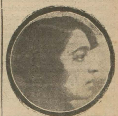
Ağa oğlu Tezer H.

Bence, - Gazinin en büyük eseri mes'elesi iki cihetten mevzuu bahs olamaz. Evvela: Bu aklın hududunu aşan ve zamani taşan eserlerin hepsi birbirinden büyüktür. Saniyen: bu pek yüksek eserler birleşince bir bütün teşkil ederler. İşte Gazinin eseri bu bütündür, bu yeni Türkiye'dir ve yeni Türkiyeyi kurmak için Gazinin, kudretli yaratıcı eilele yapılan bütün inkişâflar-bütün büyük