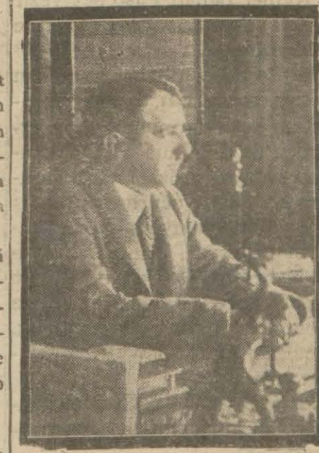
Köprülüzade Mehmet Fuat Bey Bana Gazinin en büyük eserini so-

"Millî hudutları içinde tabii inkişafını takip eden müstakil Türkiye!"